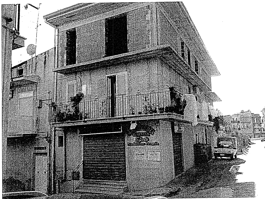
Foto 1 - Locale commerciale ingresso via Giovanni XXIII

In Catasto Fabbricati al Foglio 9, part. 1776 sub 1