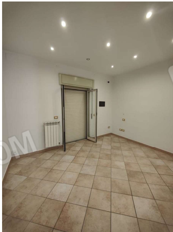
Foto n. 17: stanza da letto con porta che dà sul balcone che si affaccia su Via S.Ten. G. Grasso.