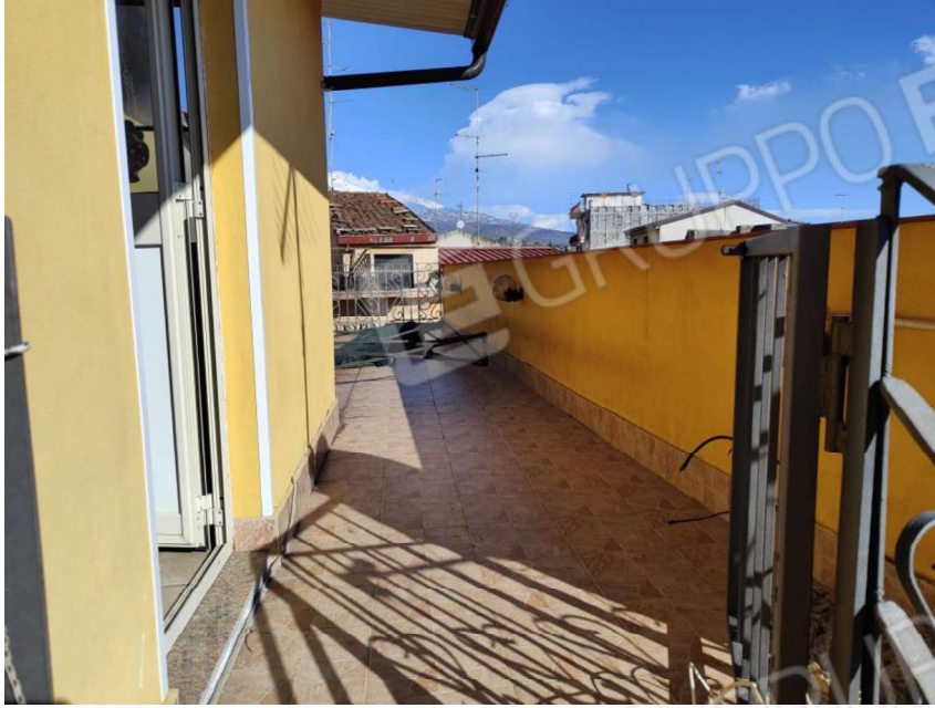
Foto n. 26 : altra veduta del lastrico solare. A sinistra entrata del locale abusivo.