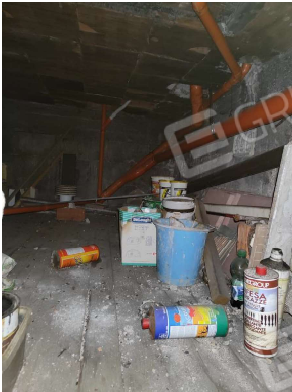
Foto n. 14: altra porzione del piano ammezzato con caratteristiche da sottotetto.