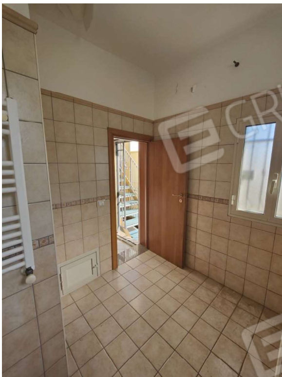
Foto n. 22: porta che immette in un pianerottolo dotato di scale che conducono al lastrico solare.