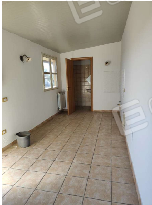
Foto n. 25: interno del piccolo locale realizzato in assenza di autorizzazione edificatoria. Sul fondo il servizio igienico.