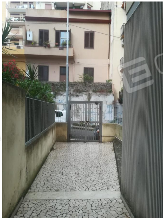
Foton.2 : Vista interna ingresso Via Setaioli;