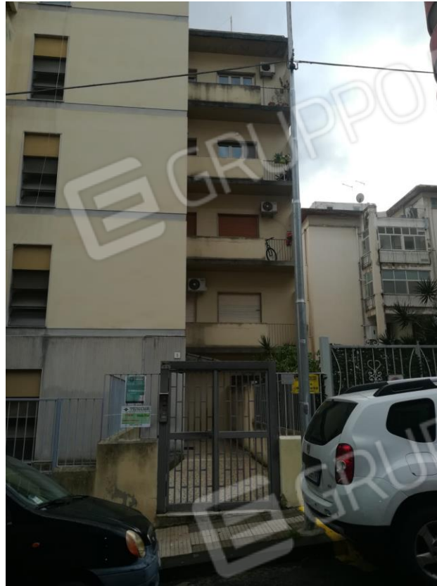
Foton.1: Ingresso Immobile Scipilliti dalla via Setaioli;