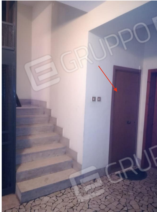
Foton.5 : Vista portone di accesso immobile Scipilliti al piano 1° sottostrada;