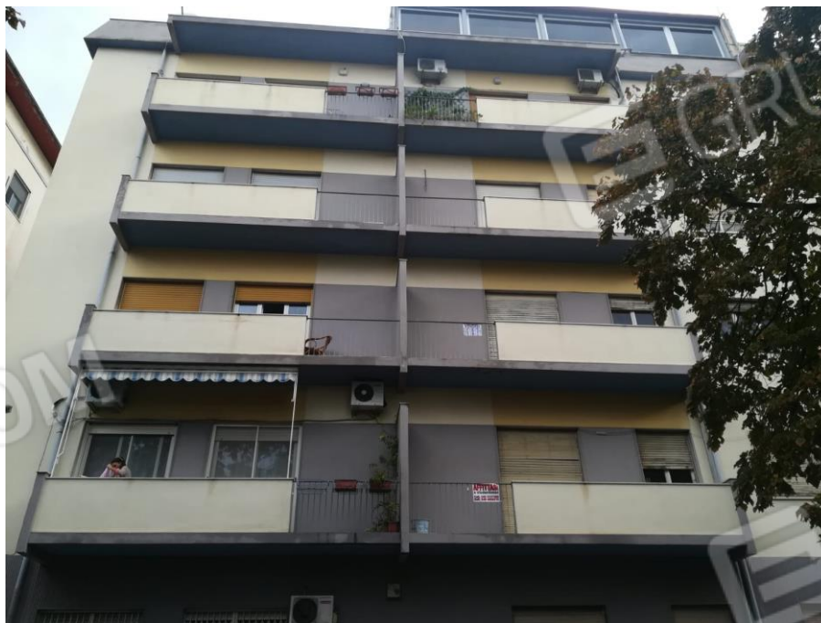
Foton.4 : Vista is.399 da Via San Giovanni di Malta;