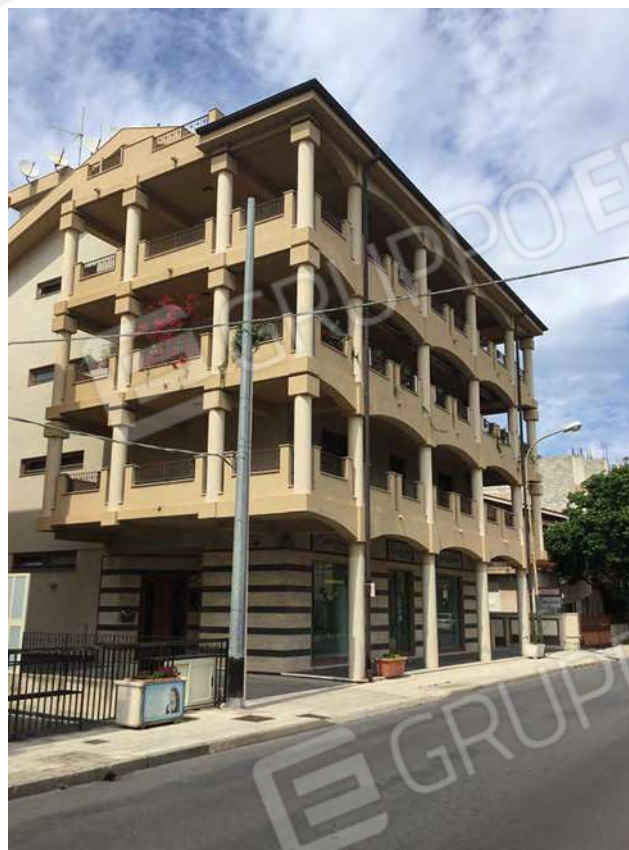
3 - Vista da Via Nazionale