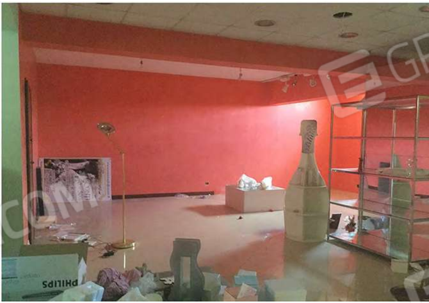
11 - Interno del negozio