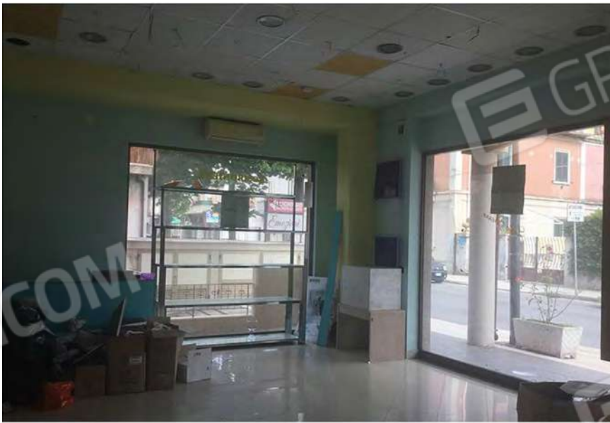
8 - Vista delle vetrine