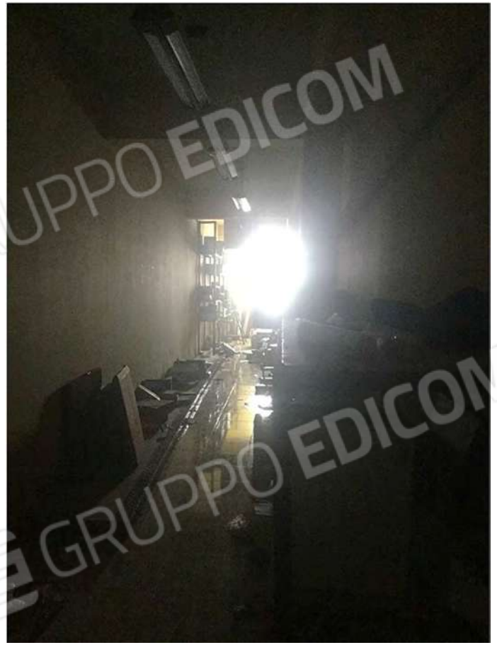
25 - Vista del locale corpo aggiunto