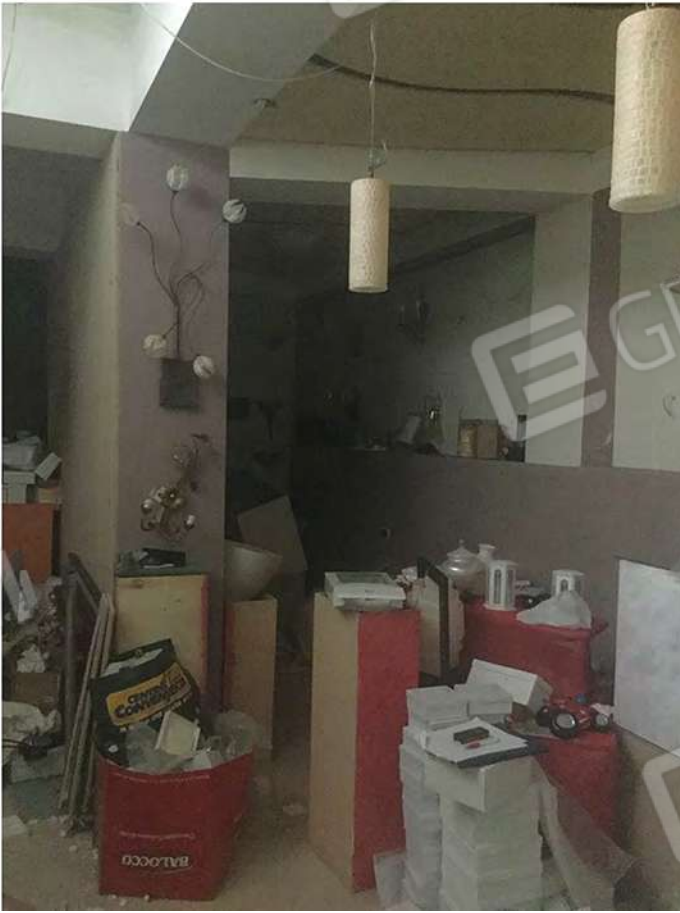
20 - Vista del seminterrato