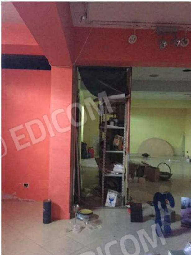
14 - Interno del negozio quota m - 1,00