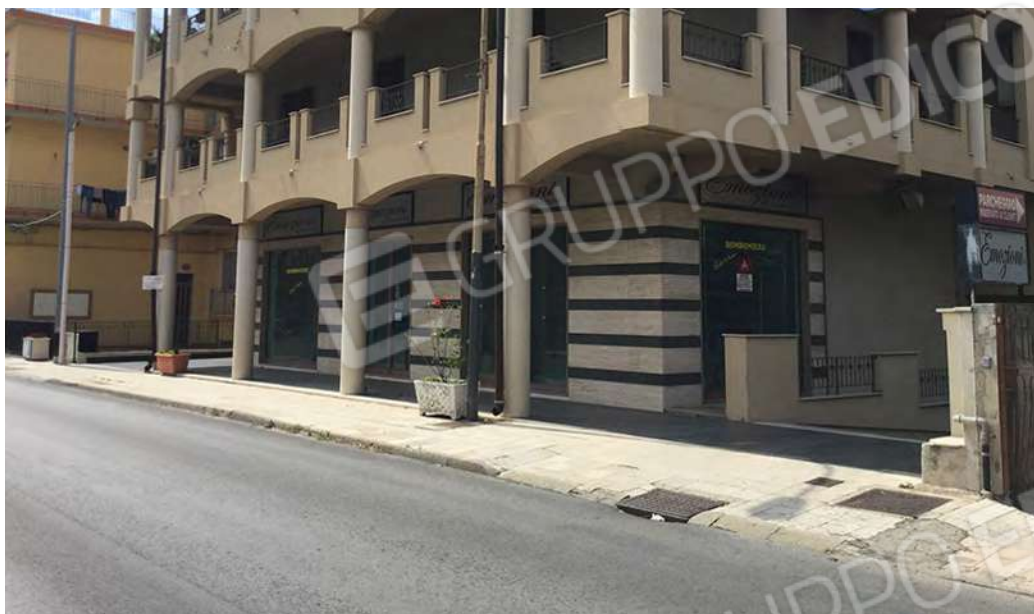
1 - Vista del complesso edilizio da Via Nazionale