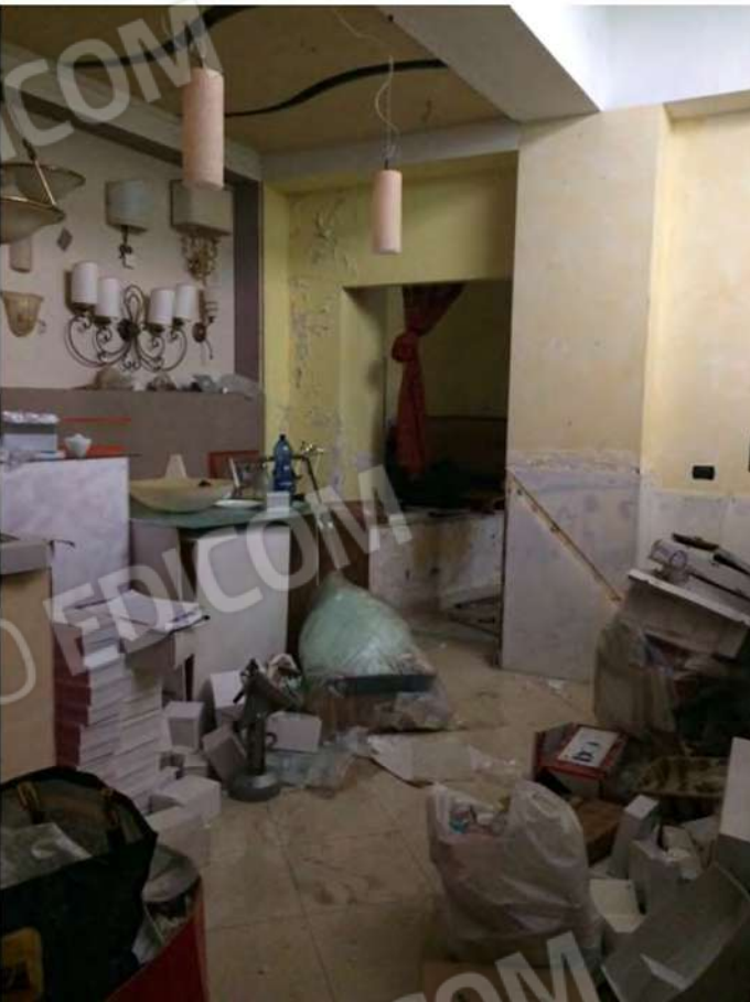
22 - Vista del passaggio realizzato per accedere al corpo aggiunto