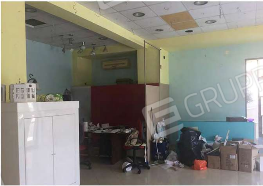
7 - Interno del negozio