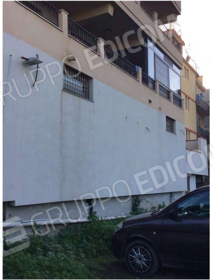
29 - Vista del prospetto esposto a nord