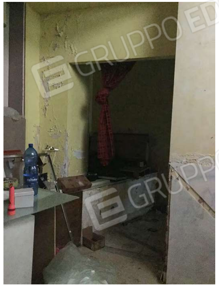
23 - Vista del passaggio realizzato per accedere al corpo aggiunto