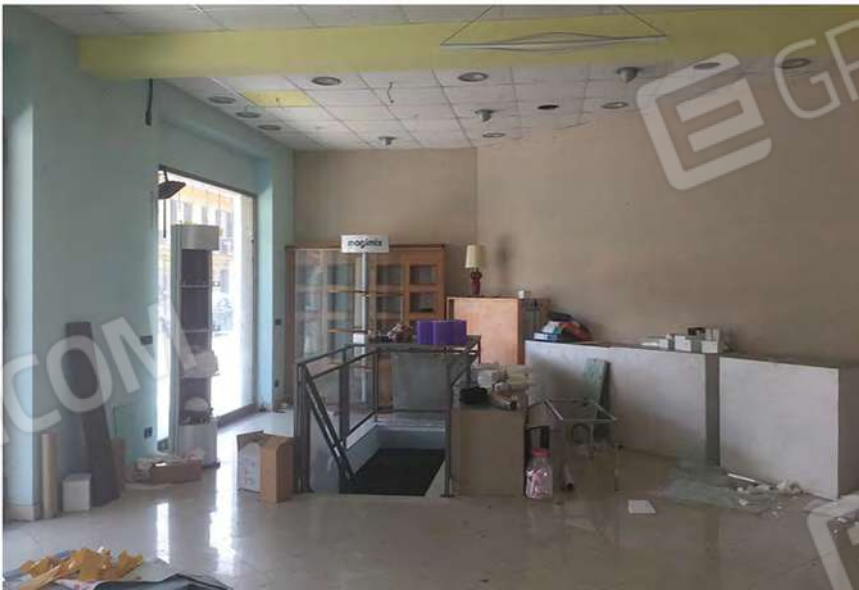
5 - Vista della scala che conduce al piano seminterrato