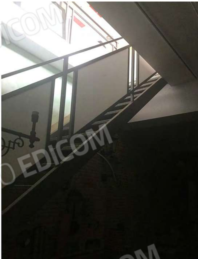
18 - Vista della scala interna che conduce al seminterrato