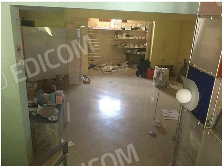
9 - Interno del negozio quota -1,00