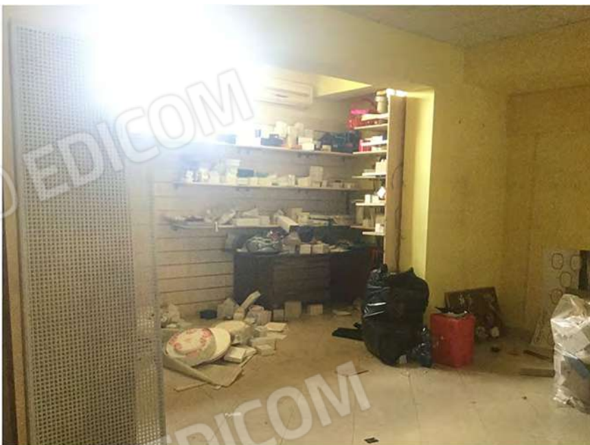
12- Interno del negozio