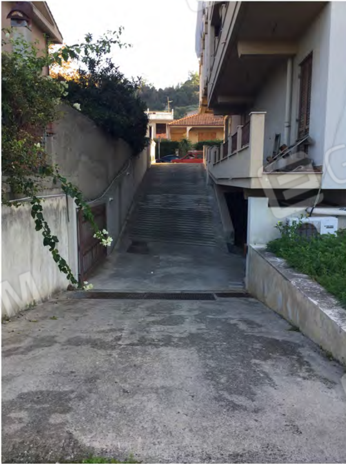
28 - Vista della rampa che conduce alle autorimesse e corte esterna