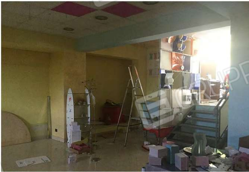
10 - Vista della scala che conduce alla quota -1,00 del negozio