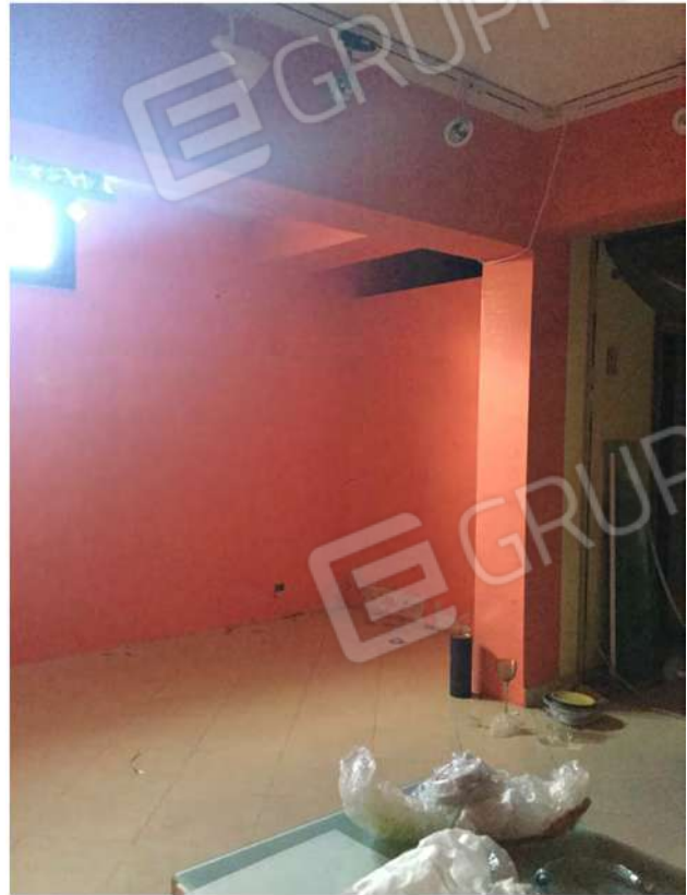
15 - Interno del negozio quota m - 1,00