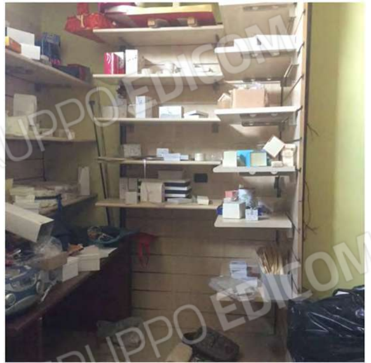
16- Interno del negozio