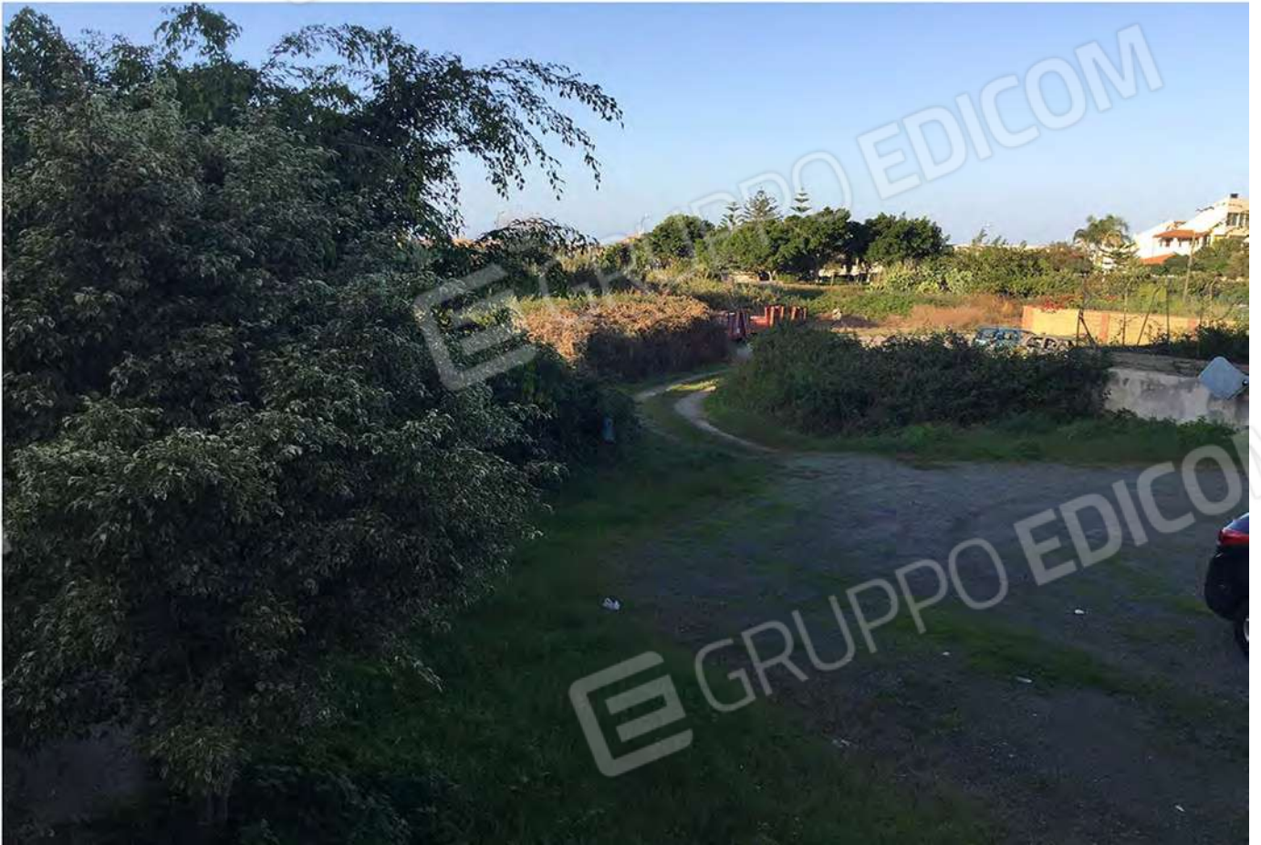
31 - Vista della corte esterna