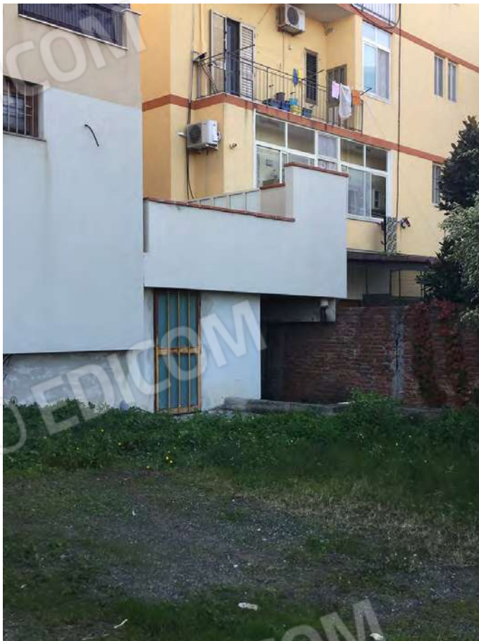
26 - Vista dalla corte di pertinenza del corpo aggiunto