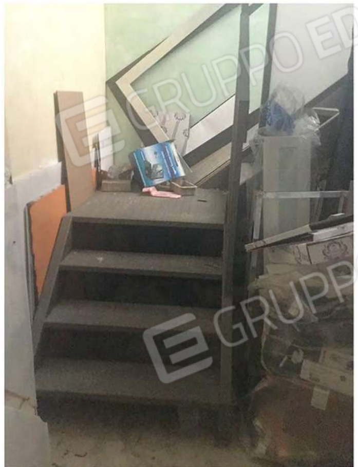
19 - Vista della scala dal seminterrato