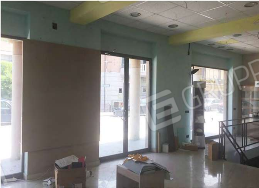
4 - Ingresso al negozio da Via Nazionale