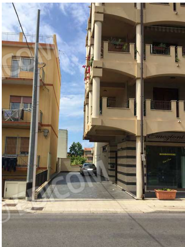
2 - Vista dell'ingresso al complesso edilizio, da Via Nazionale