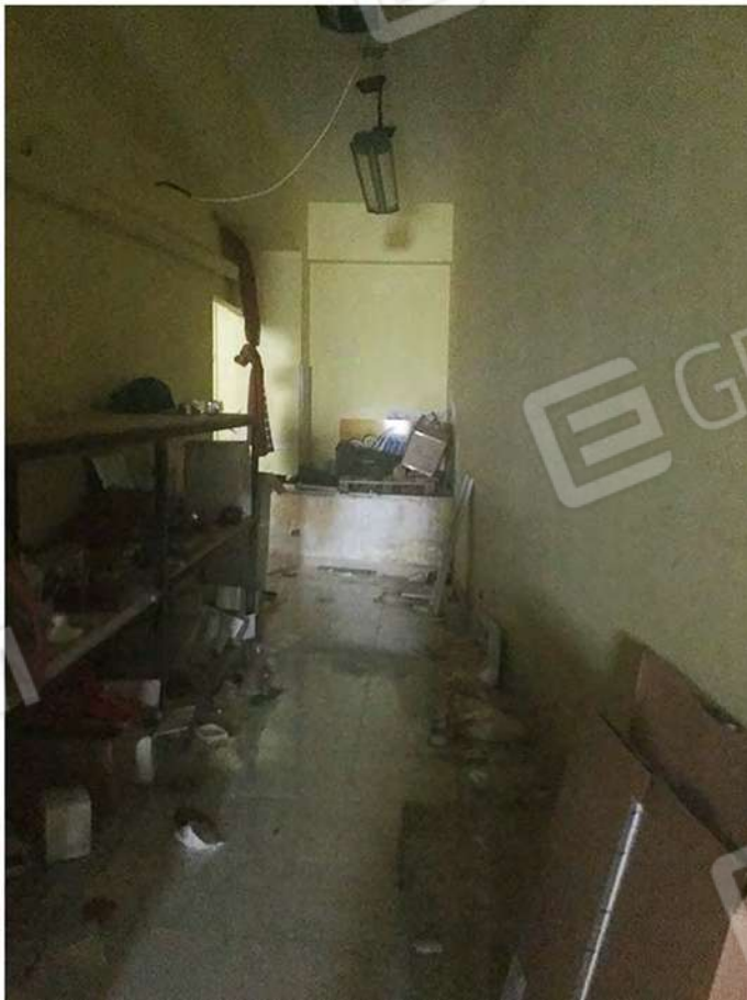
24 - Vista del locale corpo aggiunto