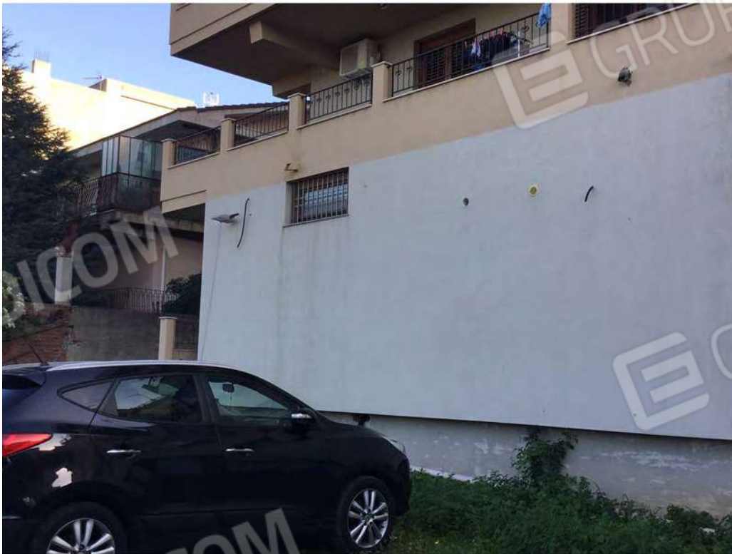
30 - Vista del prospetto nord