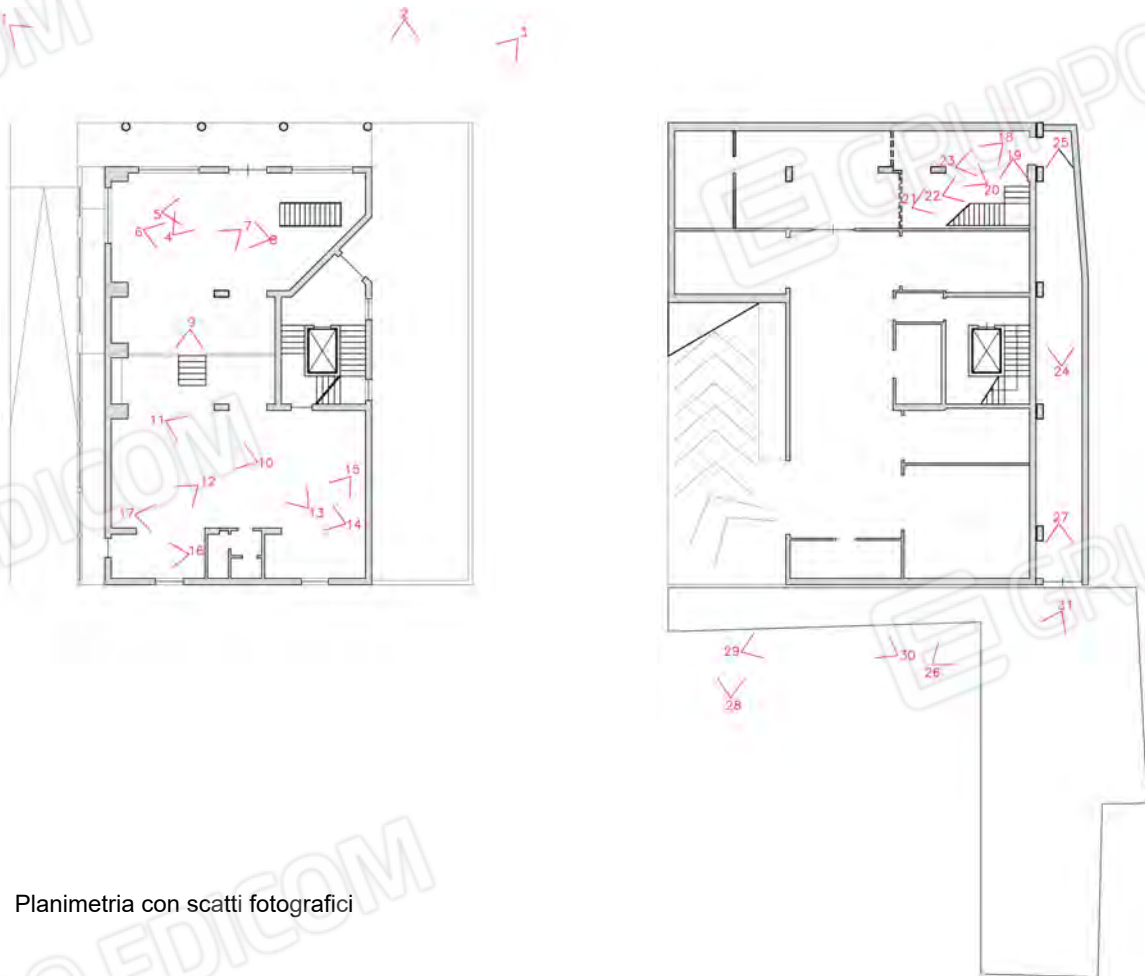
Planimetria con scatti fotografici