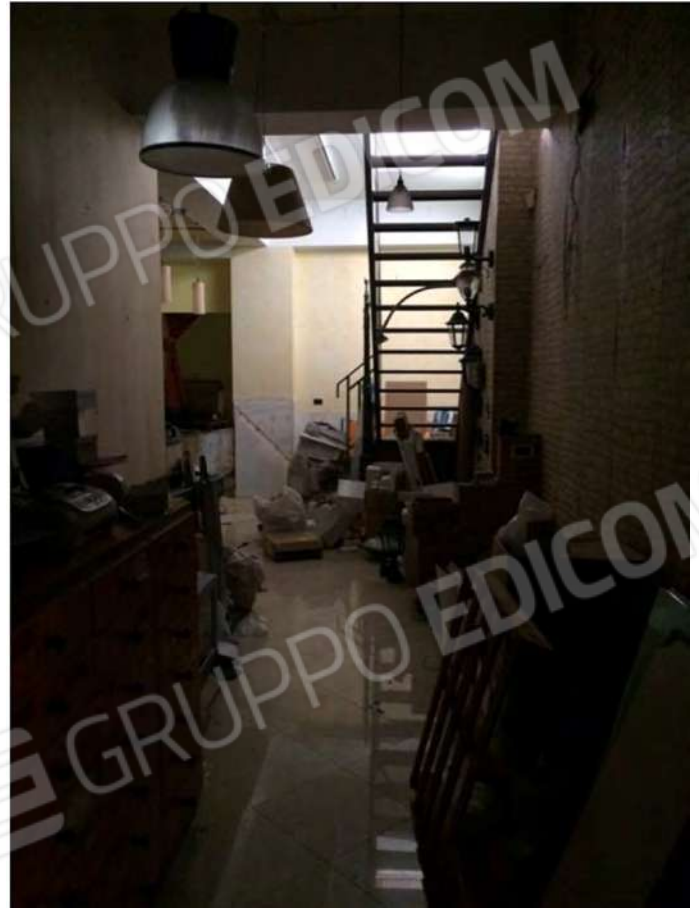
21 - Vista del seminterrato