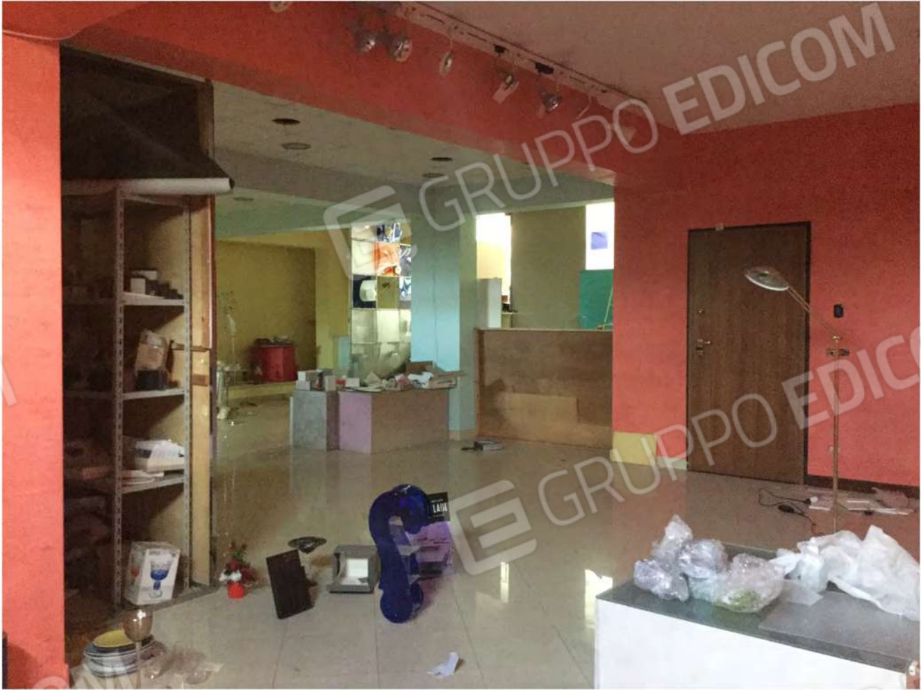
13- Negozio quota m - 1,00. Portone ingresso da corpo scala