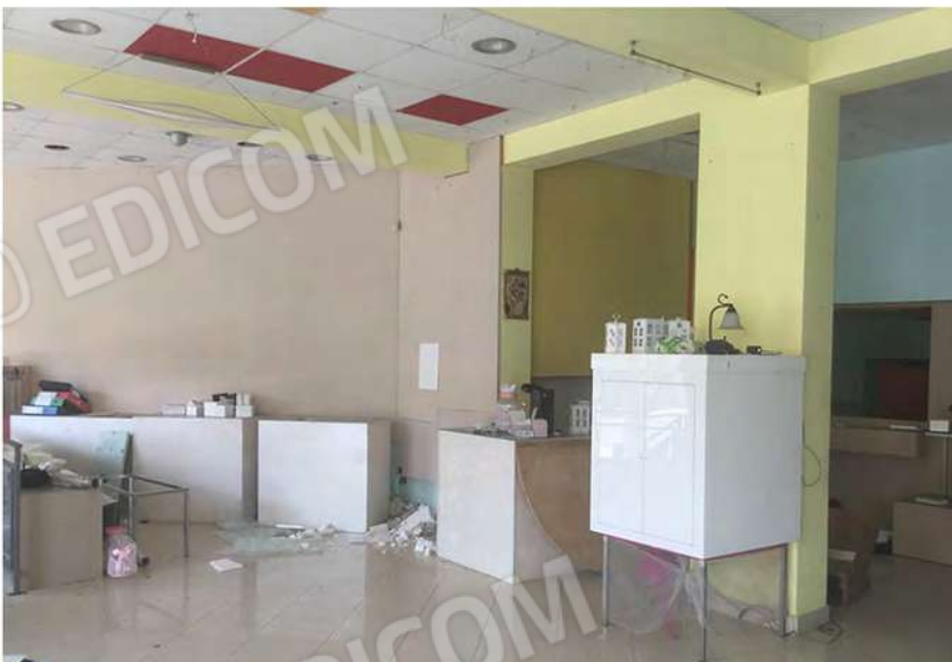
6 - Interno del negozio