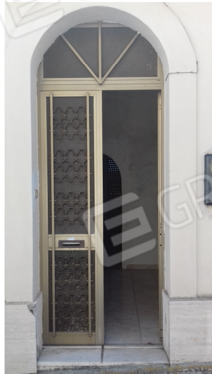
Fig. nr. 2: ingresso dalla via Regina Margherita