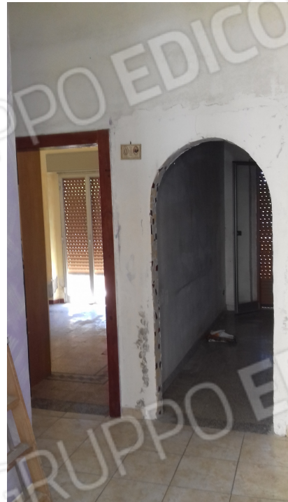
Fig. nr. 6 : piano primo, particolari ambienti interni, da cui si evince lo stato di degrado dell'immobile