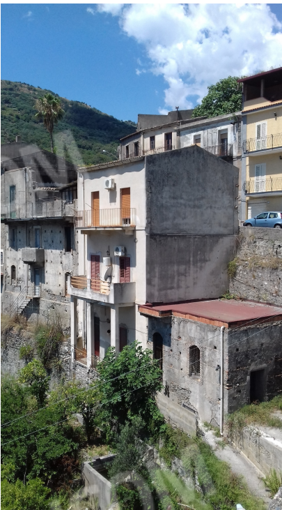
Fig. nr. 1: prospetto del fabbricato