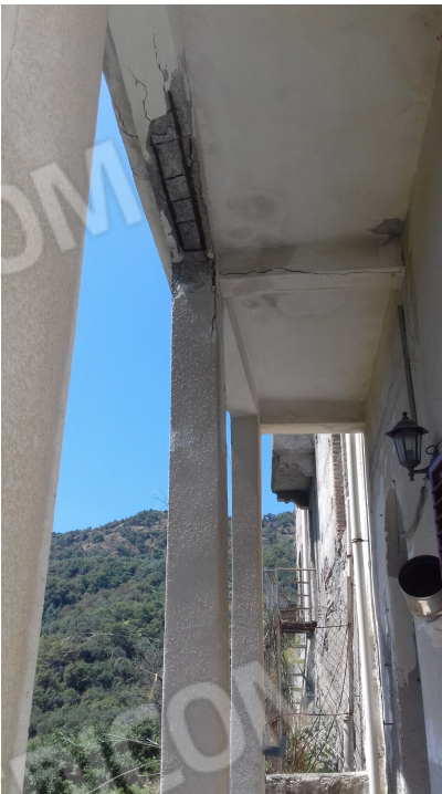
Fig. nr. 7: particolare relativo all'ammaloramento del fabbricato