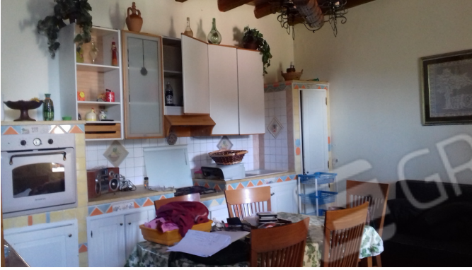
Fig. nr. 3: piano seminterrato, destinato abusivamente a cucina