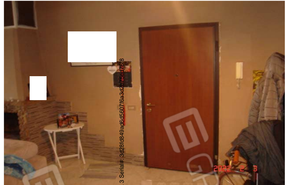
Vista porta di ingresso