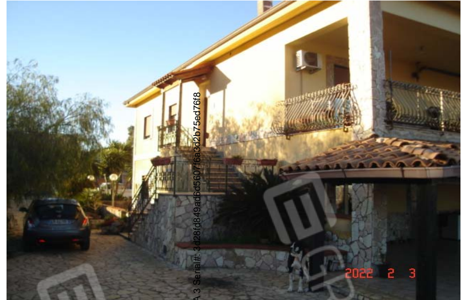
Vista esterna villino