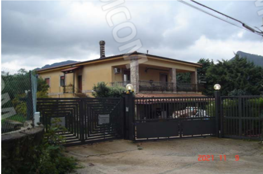
Vista esterna villino

PIENA ED INTERA PROPRIETA' DI ABITAZIONE IN VILLINO SITA IN MONREALE, C.DA CACULLA, TRAZZERA CANNAVERA N. 12, PIANO PRIMO, CENSITA AL C.F. AL FG. 51, P.LLA 1726 SUB. 3, CON LA QUOTA DI 1/2 INDIVISO DELLA CORTE COMUNE DI SUPERFICIE CATASTALE COMPLESSIVA, COMPRESO IL SEDIME DEL FABBRICATO, DI 1.055 MQ, IDENTIFICATA AL C.F. AL FG. 51, P.LLA 1726 SUB. 1 (B.C.N.C.)