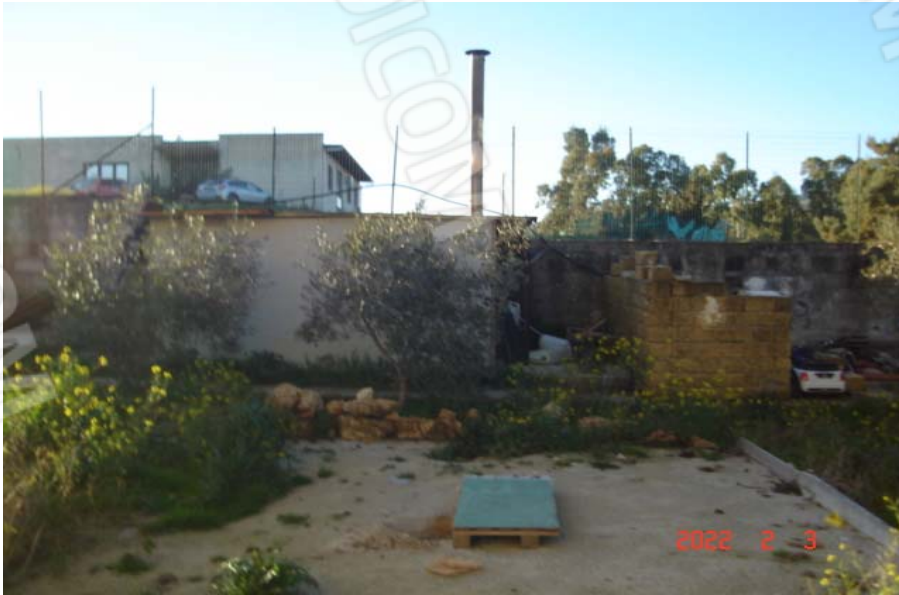
Vista corte comune

PIENA ED INTERA PROPRIETA' DI ABITAZIONE IN VILLINO SITA IN MONREALE, C.DA CACULLA, TRAZZERA CANNAVERA N. 12, PIANO PRIMO, CENSITA AL C.F. AL FG. 51, P.LLA 1726 SUB. 3, CON LA QUOTA DI 1/2 INDIVISO DELLA CORTE COMUNE DI SUPERFICIE CATASTALE COMPLESSIVA, COMPRESO IL SEDIME DEL FABBRICATO, DI 1.055 MQ, IDENTIFICATA AL C.F. AL FG. 51, P.LLA 1726 SUB. 1 (B.C.N.C.)