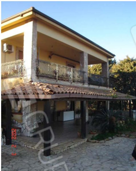
Vista esterna villino