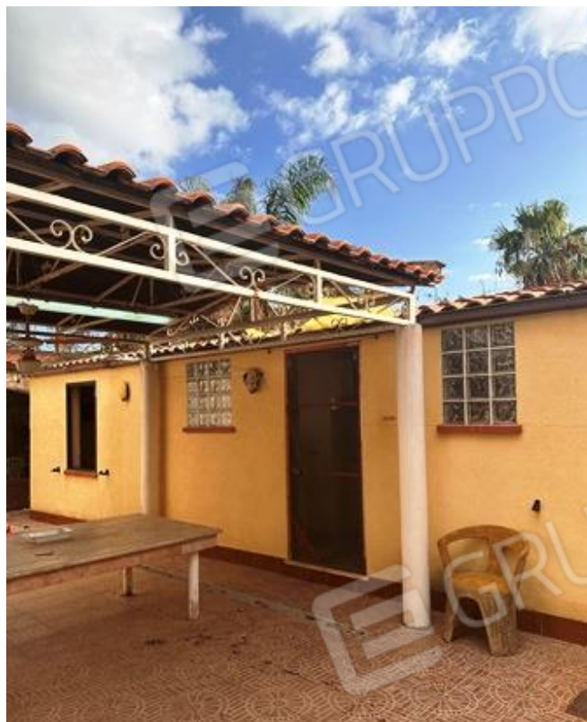
Foto n. 3 - Prospetto laterale dell'unità immobiliare, oltre il corpo accessorio

Comune di Carini (PA) Via Piante del Principe n. 59