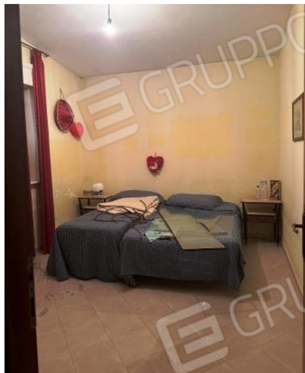
Foto n. 10 - il piano primo dell'unità immobiliare è destinato alla zona notte, con annesso servizio igienico dotato di vasca da bagno.

Comune di Carini (PA) Via Piante del Principe n. 59