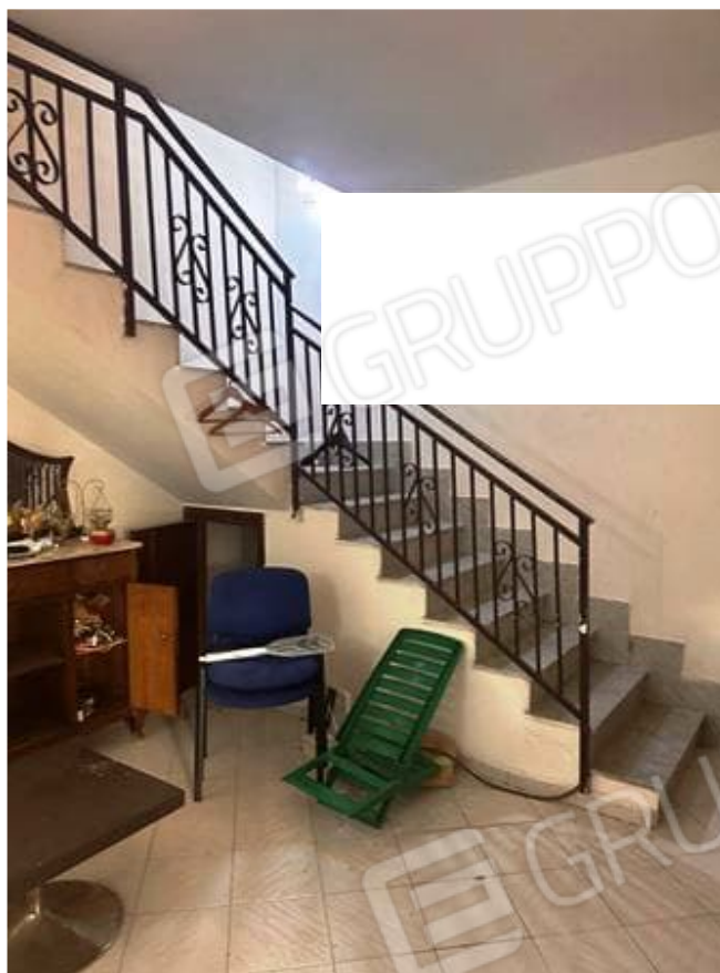
Foto n. 7 - Zona living che disimpegna il piano terra e primo, a quest'ultimo si accede dalla scala interna rifinita in marmo.

Comune di Carini (PA) Via Pianta del Principe n. 59