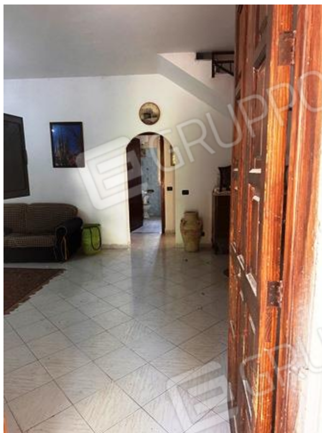
Foto n. 6 - Ingresso principale dell'unità, che immette nell'area living.

Comune di Carini (PA) Via Piante del Principe n. 59