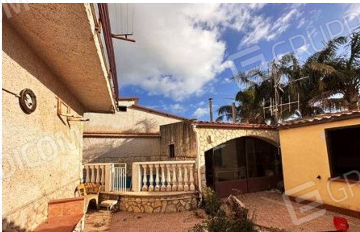
Foto n. 4 - Retrospetto e secondo corpo accessorio.

Comune di Carini (PA) Via Piante del Principe n. 59