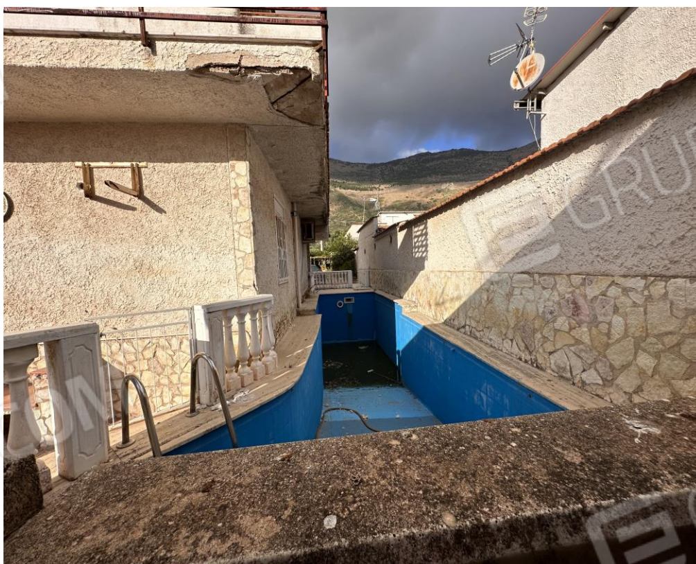
Foto n. 5 - Retrospetto, ingresso alla piscina da inertizzare posta sul lato nord dell'unità immobiliare.

Comune di Carini (PA) Via Pianta del Principe n. 59