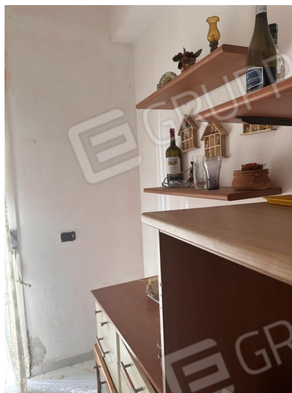
Foto n. 8 – Cucina dell'unità immobiliare, con porta/finestra che permette l'accesso al retrospetto dell'unità immobiliare.

Comune di Carini (PA) Via Pianta del Principe n. 59