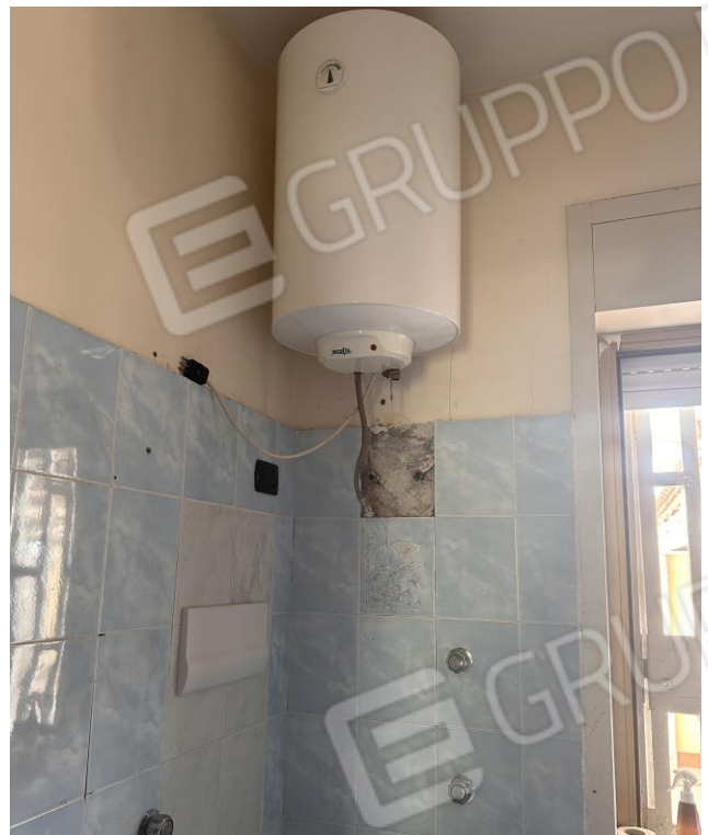
Foto n. 9 - Servizio igienico di piano terra, boiler elettrico per la produzione dell'ACS in pessime condizioni di manutenzione.

Comune di Carini (PA) Via Pianta del Principe n. 59