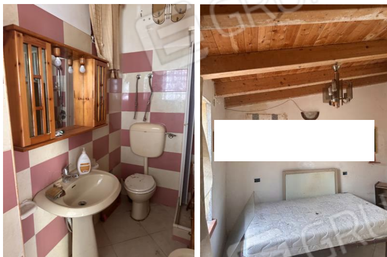
Foto n. 12 - Interno dei vani oggetto di messa in pristino.

Comune di Carini (PA) Via Pianta del Principe n. 59