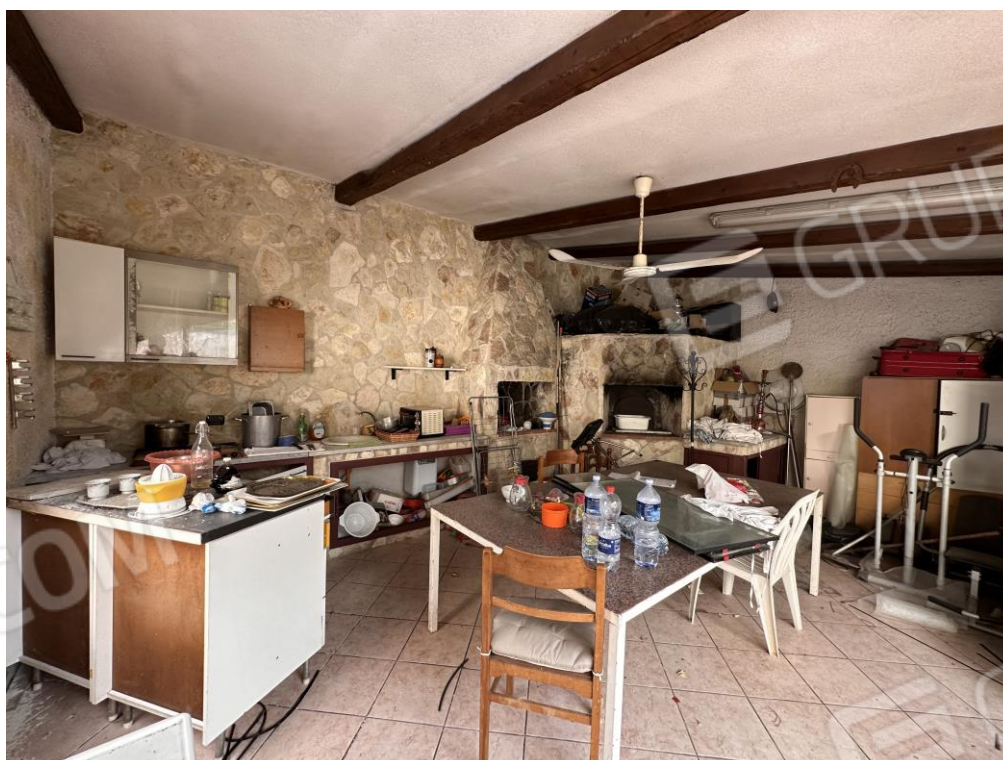
Foto n. 13 - Cucina esterna.

Comune di Carini (PA) Via Piante del Principe n. 59