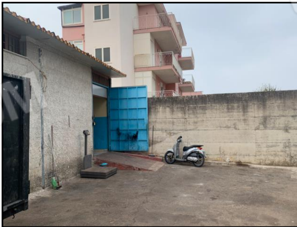
Corte esterna comune e ingresso magazzino maggiore