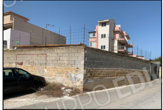
Immobile vista fronte vista SUD-EST