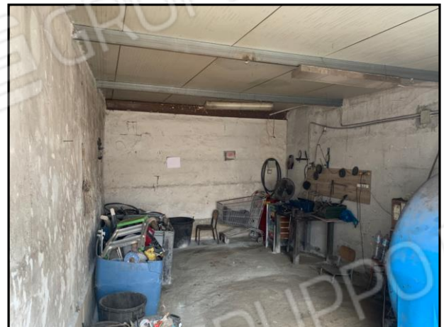
Interni magazzino piccolo (box)