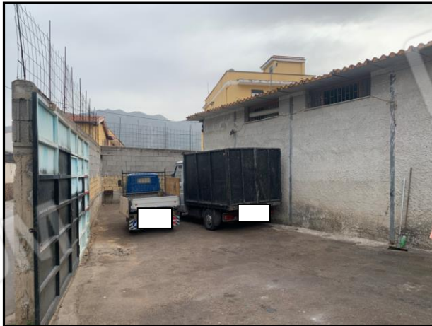
Corte esterna comune