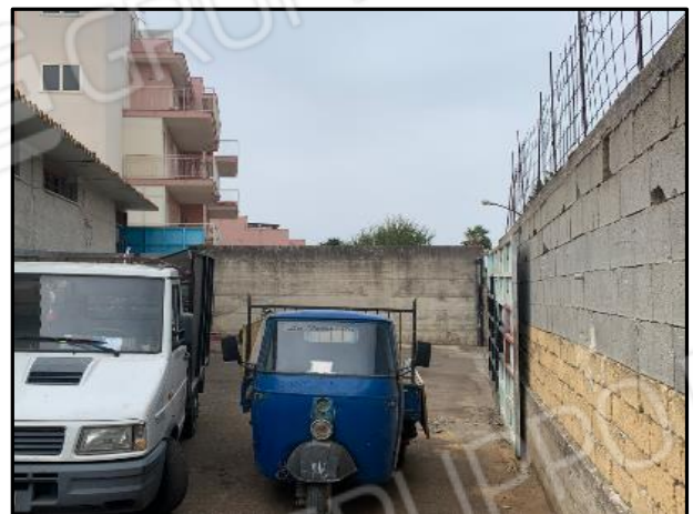
Corte esterna comune