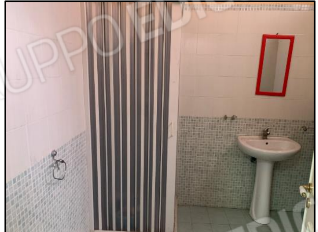
Interni wc magazzino maggiore