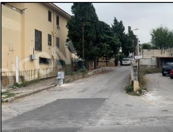
Contesto di zona via Lipari (traversa SS 113)