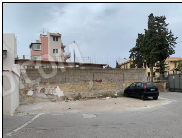
Immobile vista fronte vista SUD