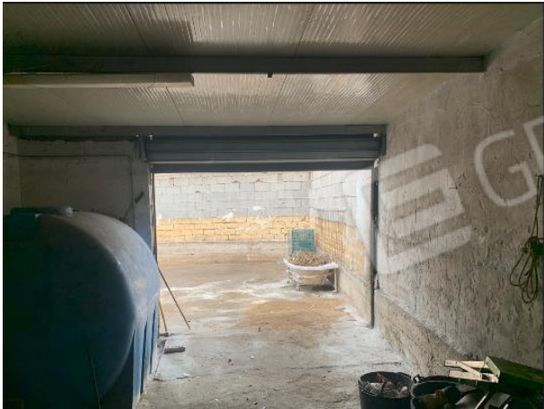
Interni magazzino (box)