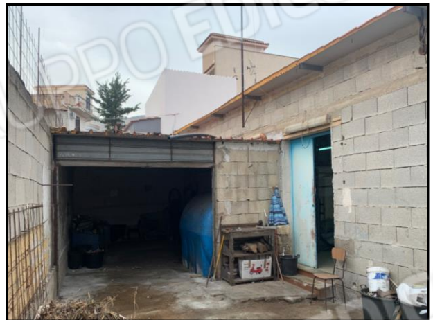
Ingresso magazzino piccolo (box)