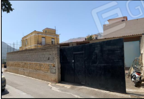
Ingresso immobile fronte vista EST