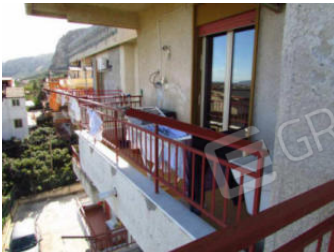
13- balcone cucina.

Locale di sgombero di P-T catastato con il sub. 6: