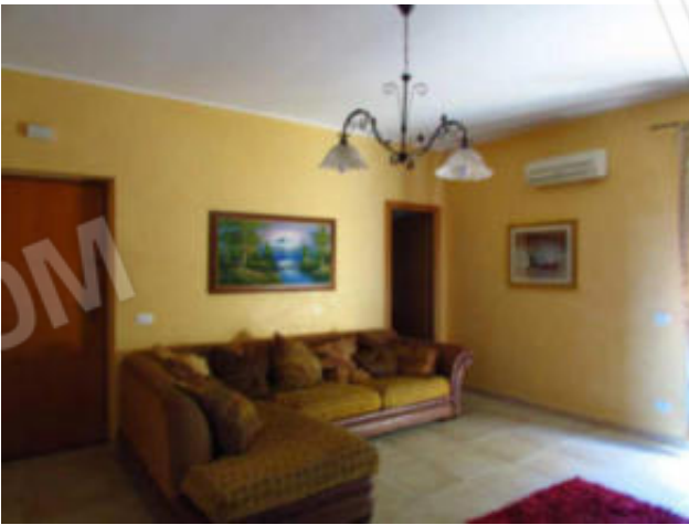
1-2 Ingresso/ salone.