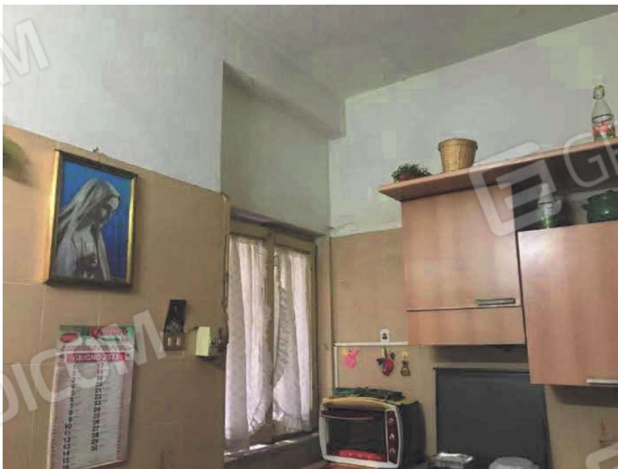
Foto n.18 Particolare ammaloramenti trave e soffitto in cucina