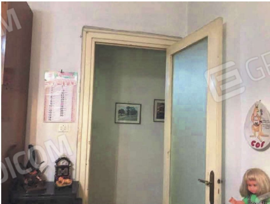
Foto n.10 Particolare impianti a vista in una camera