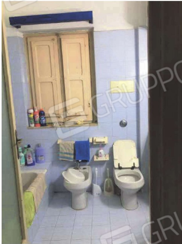
Foto n.19 w.c.