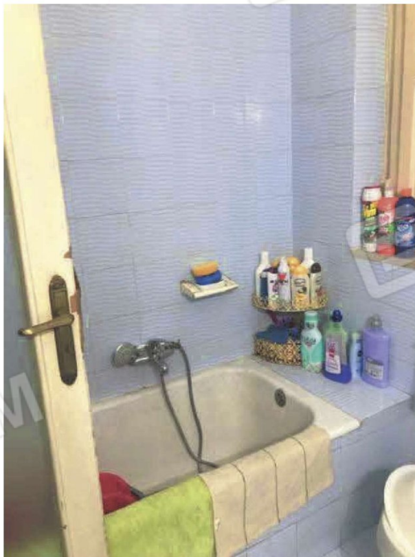
Foto n.20 Particolare w.c.