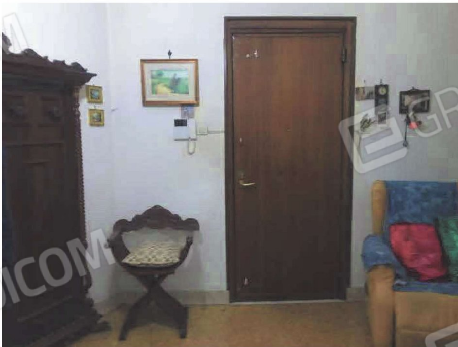
Foto n.6 Ingresso