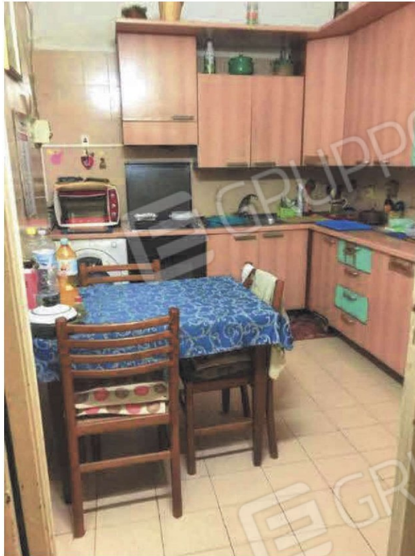
Foto n.17 Cucina