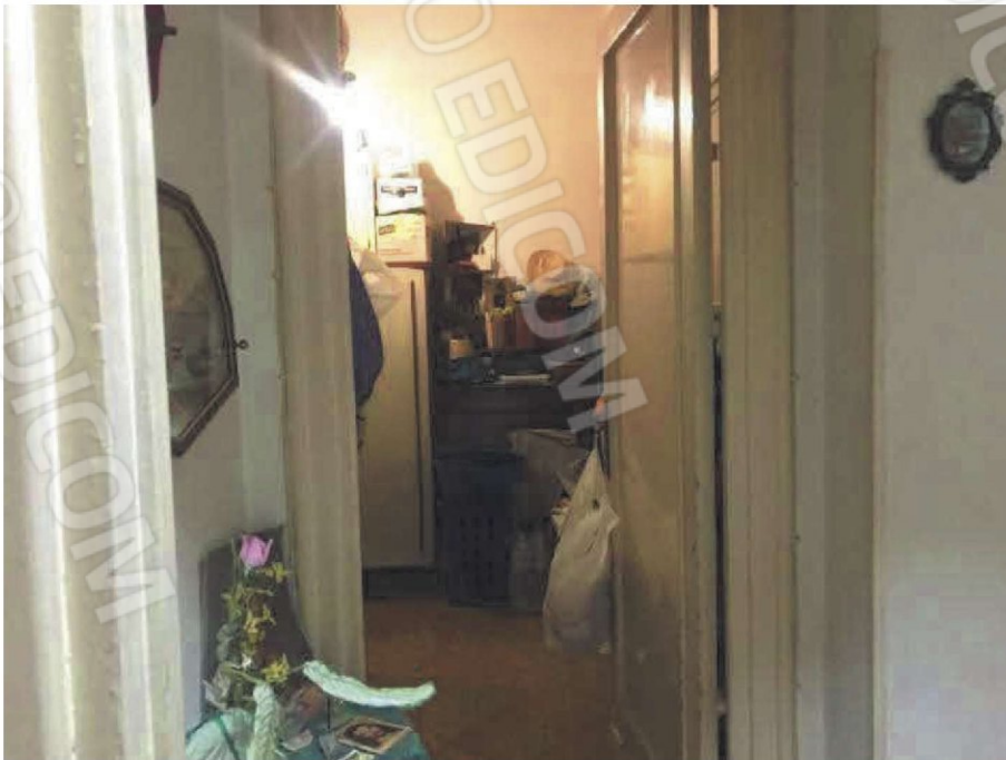
Foto n.13 Ripostiglio