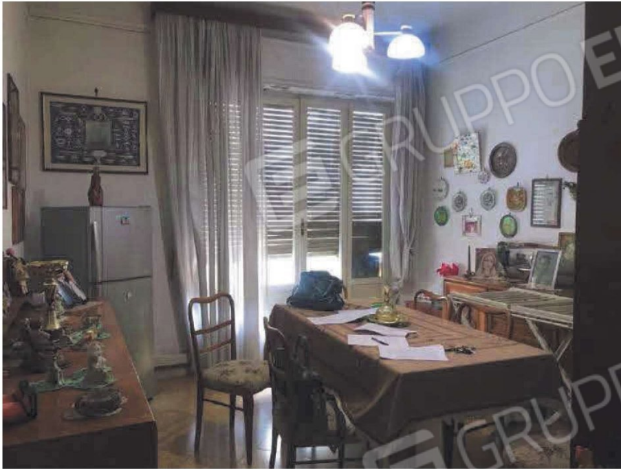
Foto n.9 Una camera