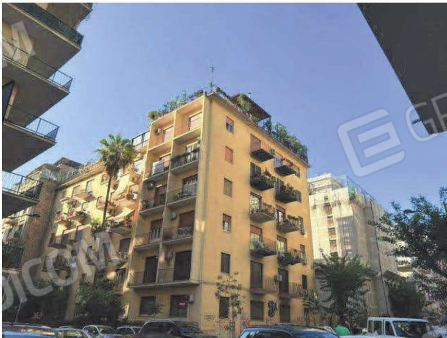
Foto n. 2 Vista dell'edificio da via Simone Cuccia