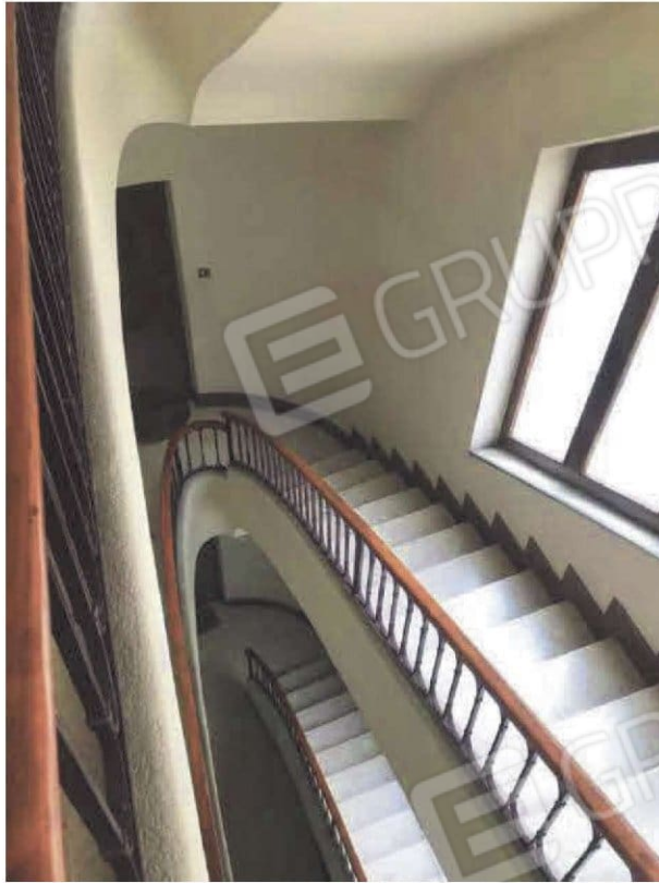
Foto n.7 Vano scala