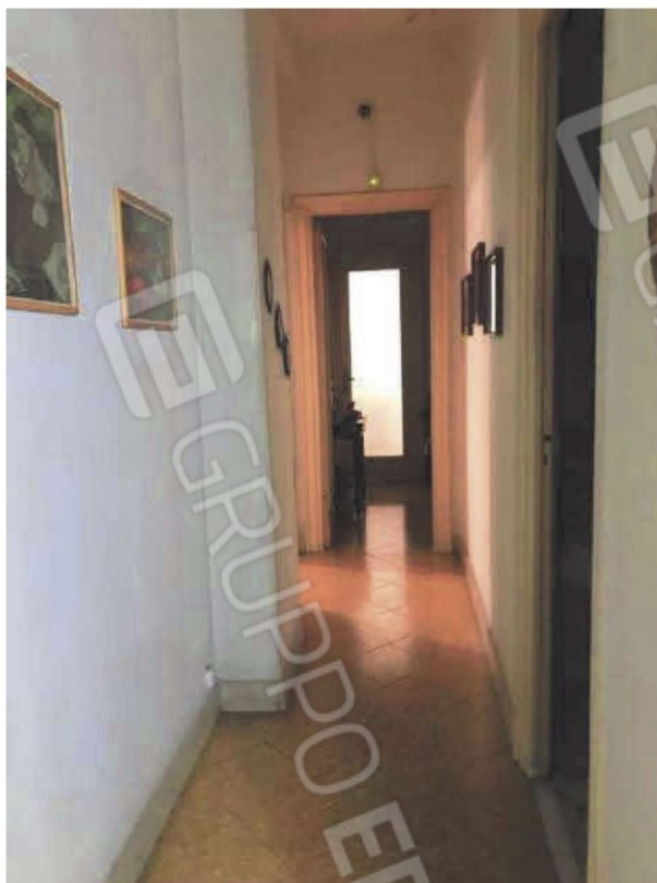
Foto n.14 Corridoio