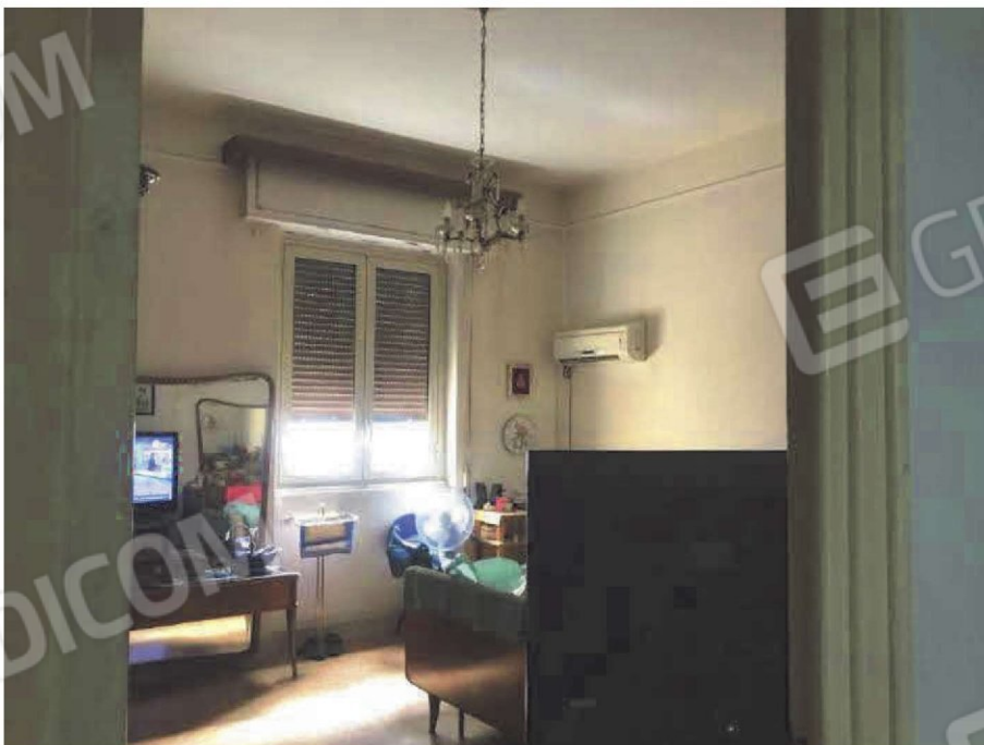
Foto n. 12 Una camera