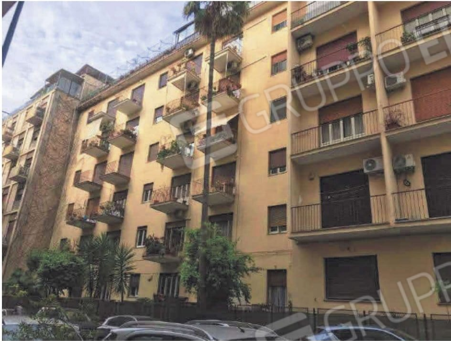
Foto n.1 Vista dell'edificio da via Domenico Di Marco