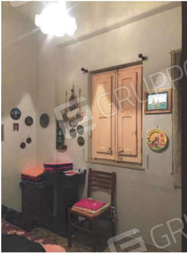
Foto n.15 Ripostiglio