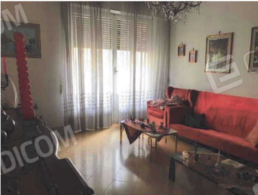
Foto n.8 Una camera