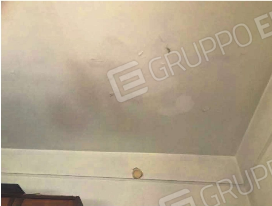
Foto n.11 Particolare ammaloramenti nel soffitto di una camera