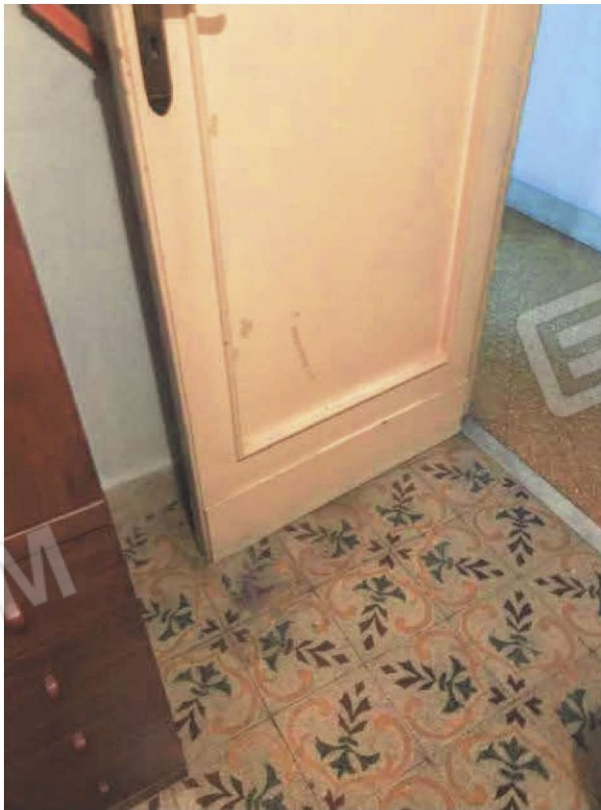
Foto n.16 Particolare pavimentazione e porta del ripostiglio