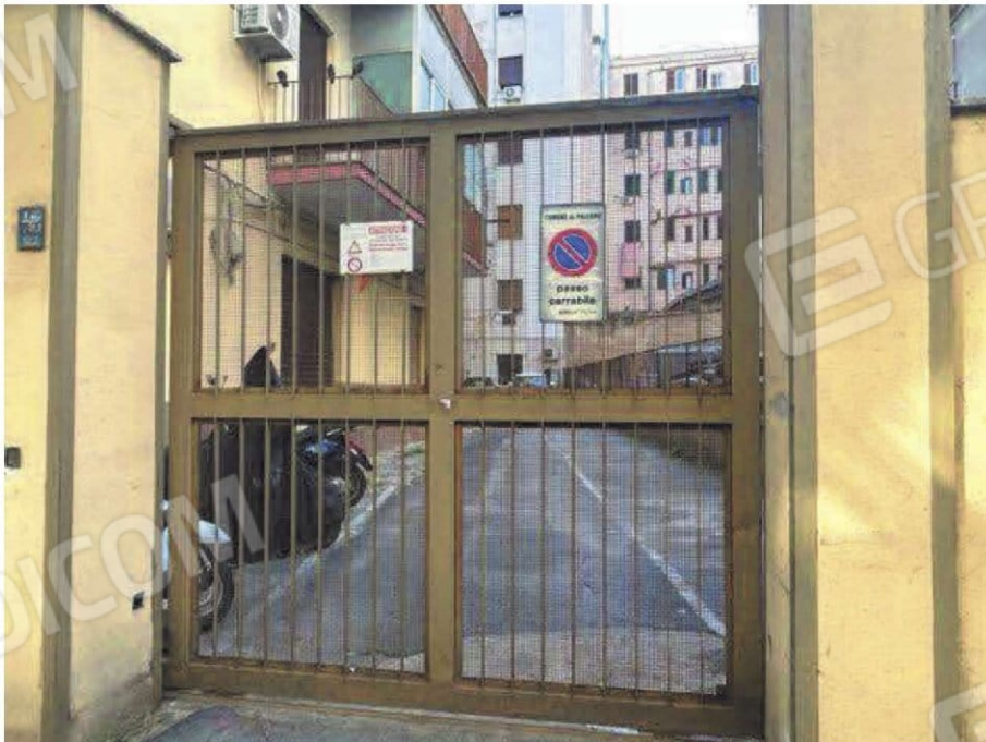
Foto n.4 Area libera condominiale