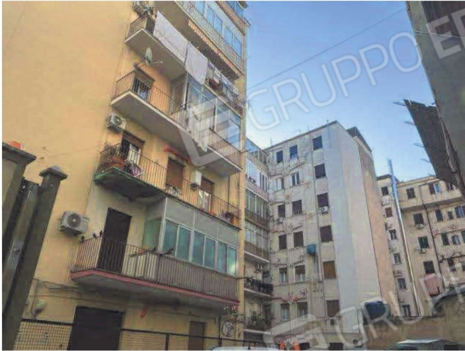
Foto n.3 Vista dell'edificio da via Simone Cuccia