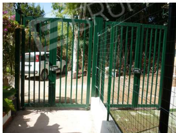
Foto n. 3a– Cannello di accesso diretto all’area di pertinenza all’immobile