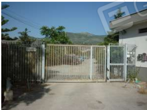
Foto n. 1 – Via Germania n. 19 che costituisce accesso alla porzione di strada privata che conduce all’immobile