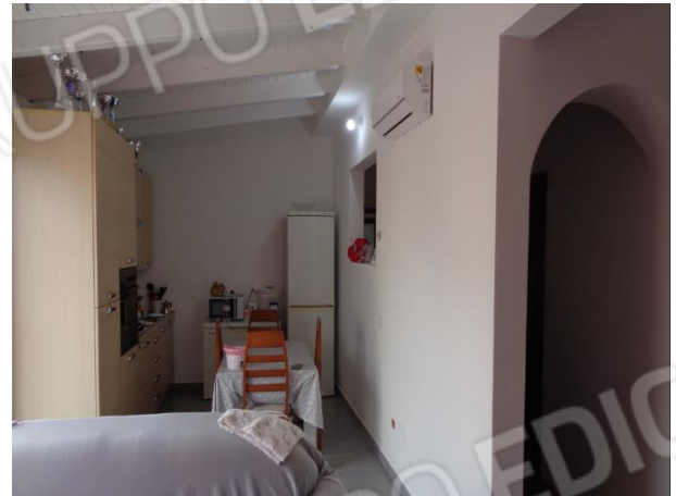
Interni appartamento piano secondo