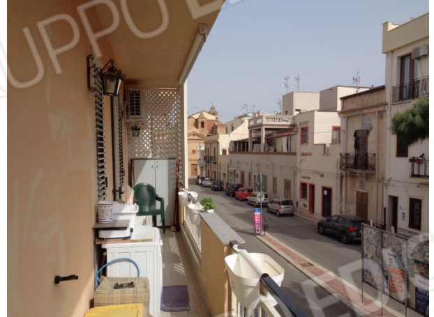
Balcone appartamento piano primo