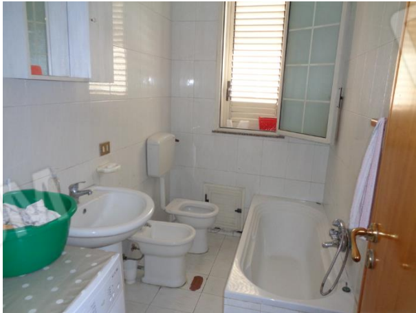
Interni appartamento piano terra