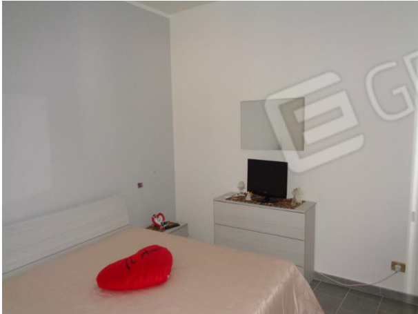
Interni appartamento piano secondo: vano buio