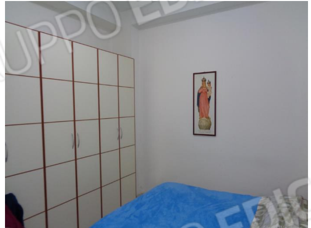
Interni appartamento piano terra: vano buio