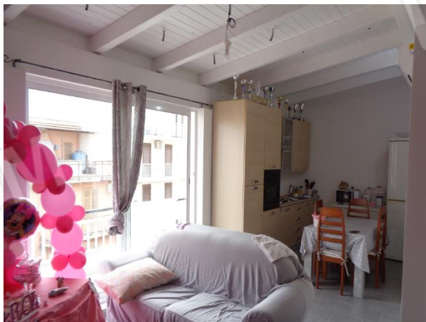
Interni appartamento piano secondo