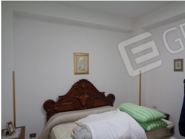
Interni appartamento piano primo: vano buio