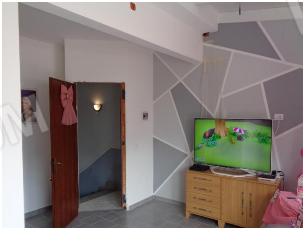
Interni appartamento piano secondo