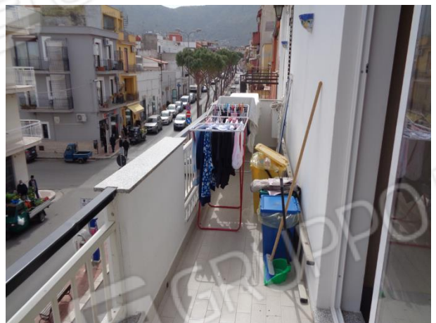
Balcone appartamento piano secondo