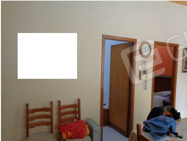
Interni appartamento piano terra