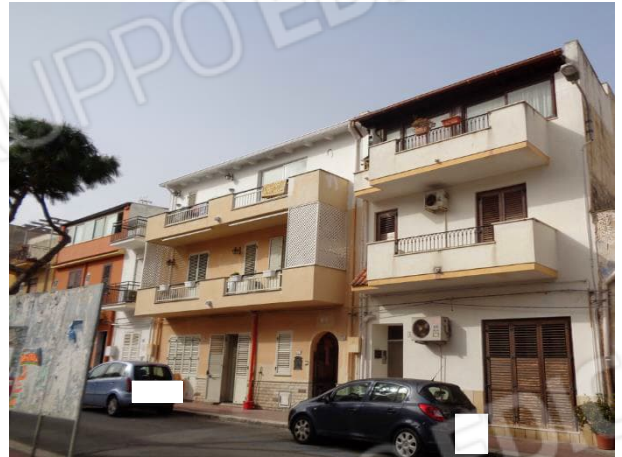
Edificio in oggetto