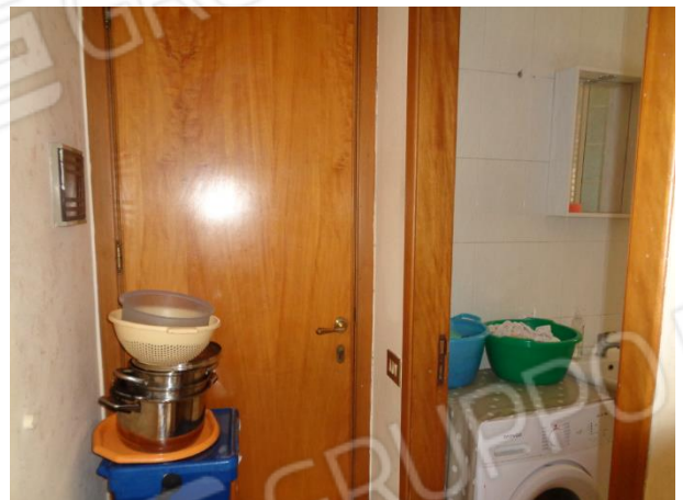
Porta di comunicazione con androne condominiale