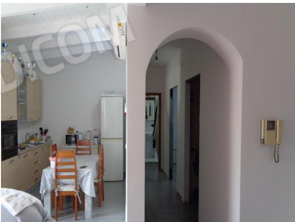
Interni appartamento piano secondo