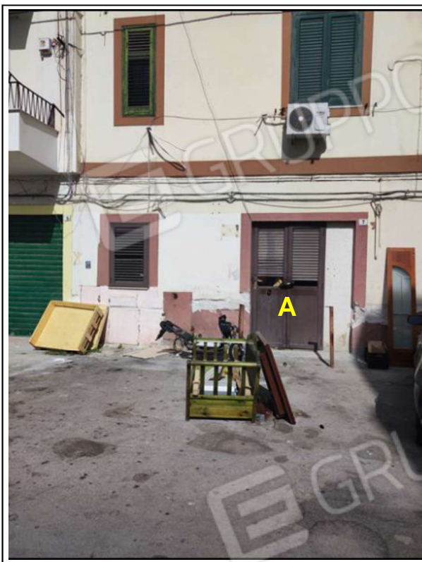
Foto N°4 - Part. accesso da Via Nervesa 7 da serramento in alluminio anodizzato a due battenti dotato di gelosie orientabili (A)