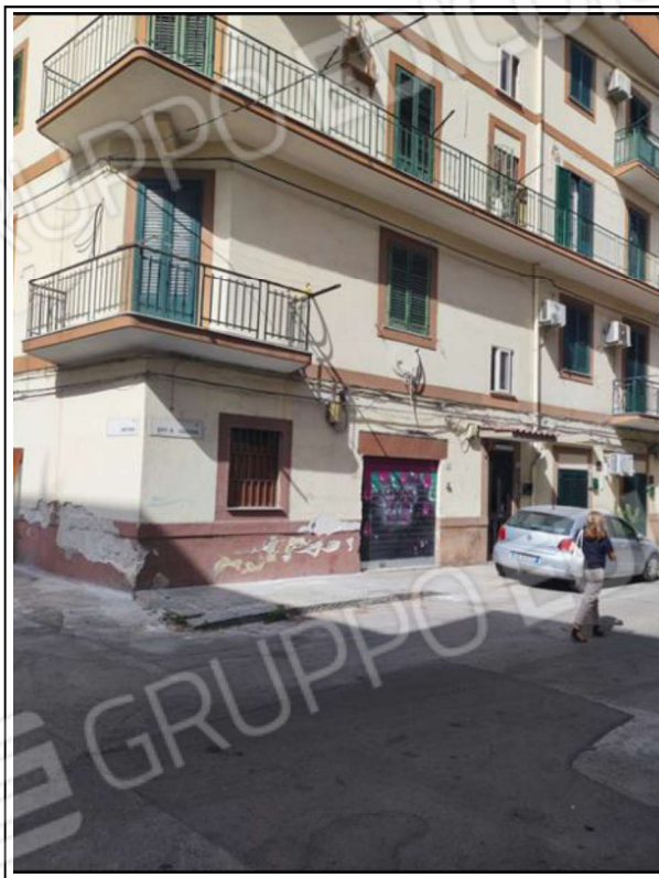
Foto N°2 - Part. dell'organismo edilizio ad angolo con la Via Generale Cascino