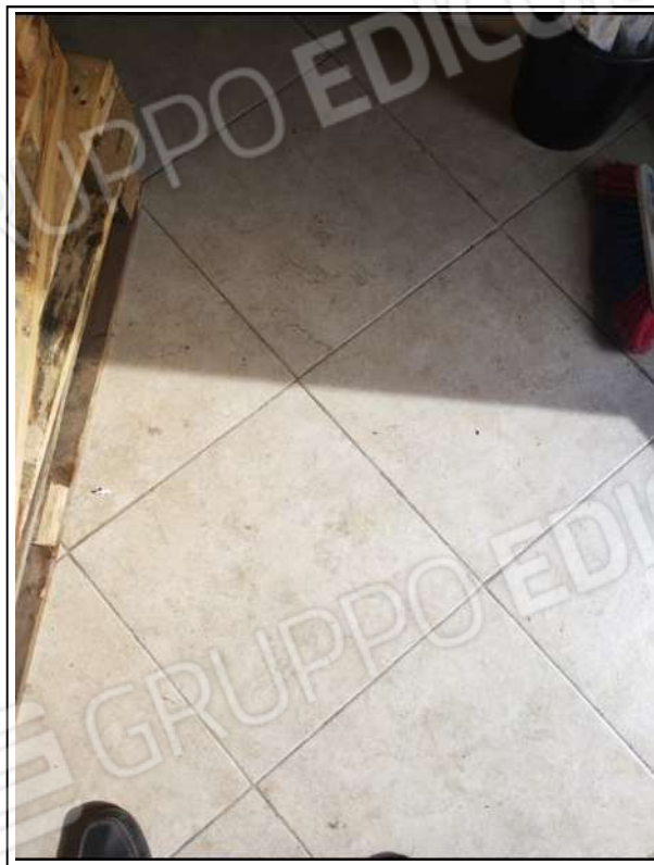
Foto N°6 - Part. pavimento in grès porcellanato (formato cm.45 x 45)