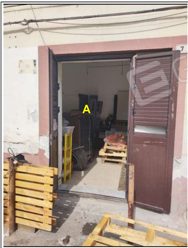
Foto N°5 - Part. accesso all'unità immobiliare: (A) accesso al W.C.