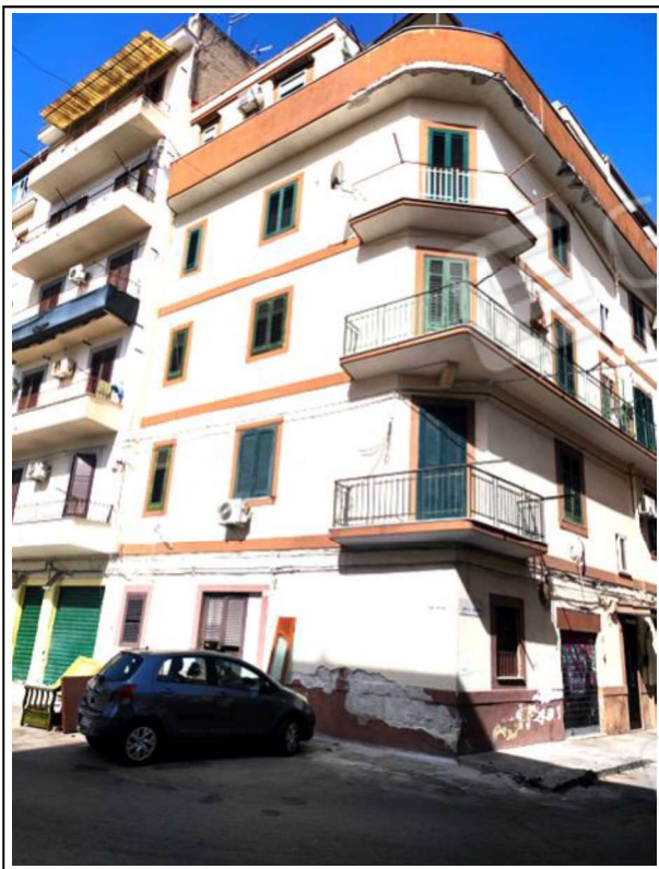
Foto N°1 - Il complesso immobiliare tra la Via Nervesa e la via Generale Cascino