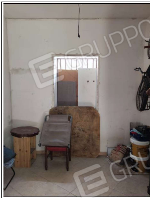
Foto N°12 - Part. vano finestra su Via Generale Antonio Cascino, privo di serramento