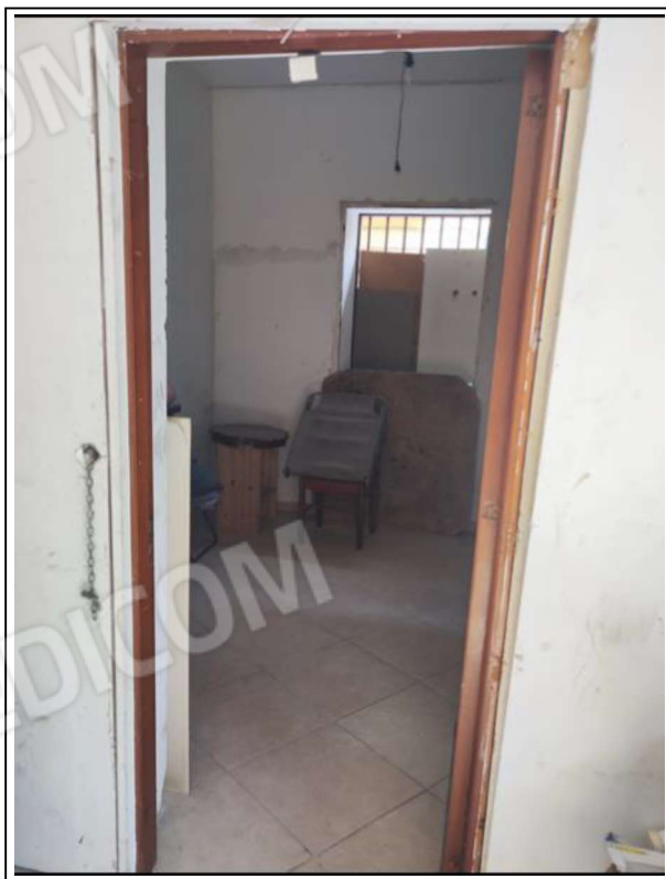
Foto N°11 - Part. accesso alla Camera 2: sullo sfondo vano finestra prospiciente Via Generale Antonio Cascino (A)