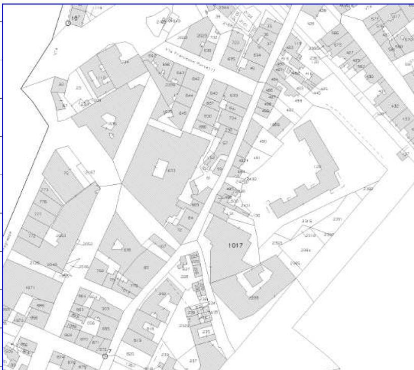
Estratto di Mappa del foglio 61 p.lla 2209