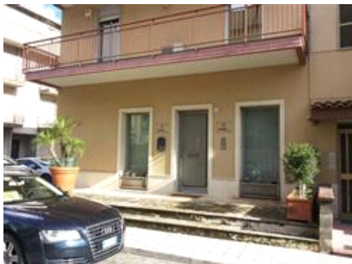
Prospetto principale su via D'Annunzio