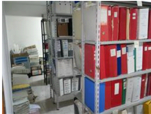
Interni del piano seminterrato