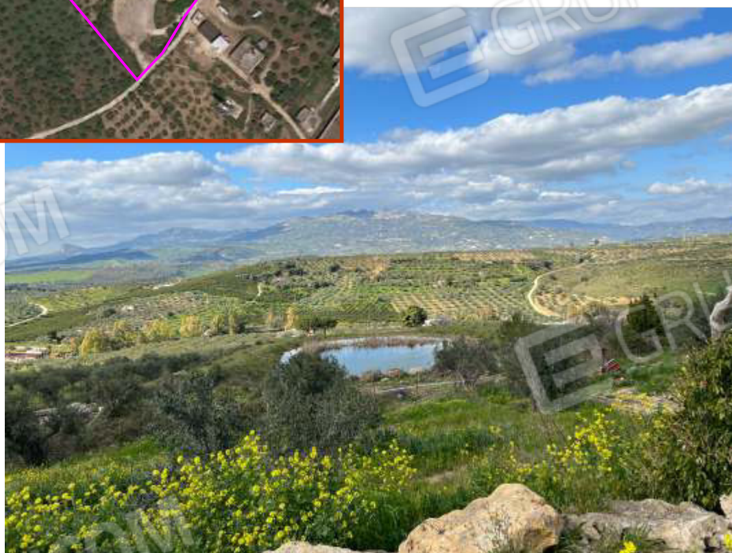
VISTA DEL LOTTO DI TERRENO