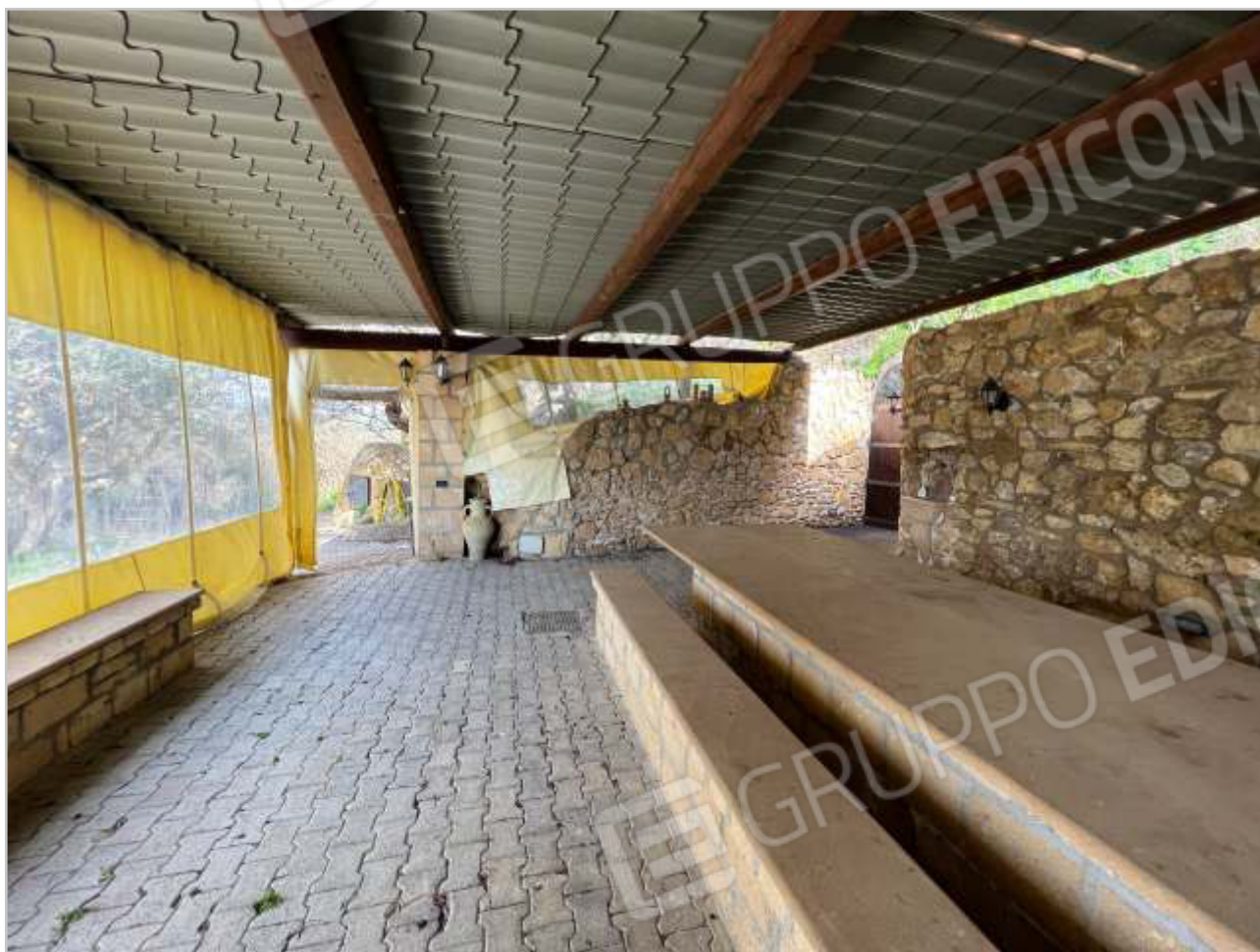
ACCESSO E LATO NORD/EST DELLA TETTOIA