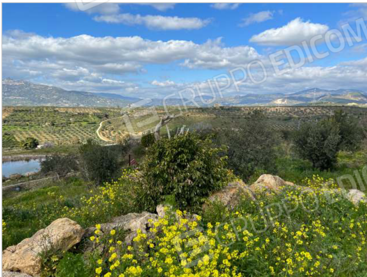
VISTE DEL FONDO E ACCESSO ALL'INVASO ARTIFICIALE