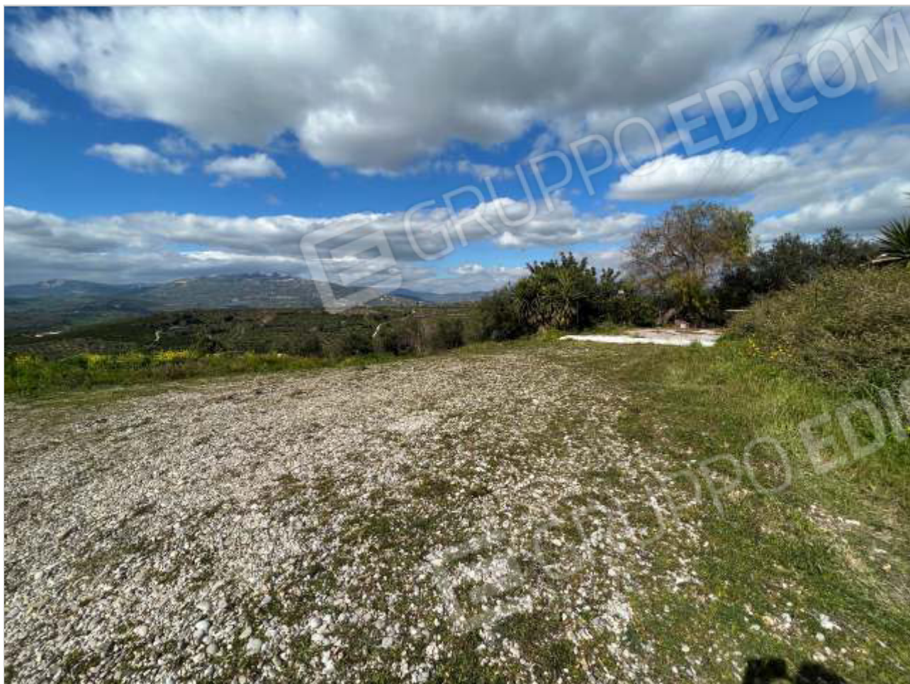
VISTE PIAZZALE D'INGRESSO AL FONDO