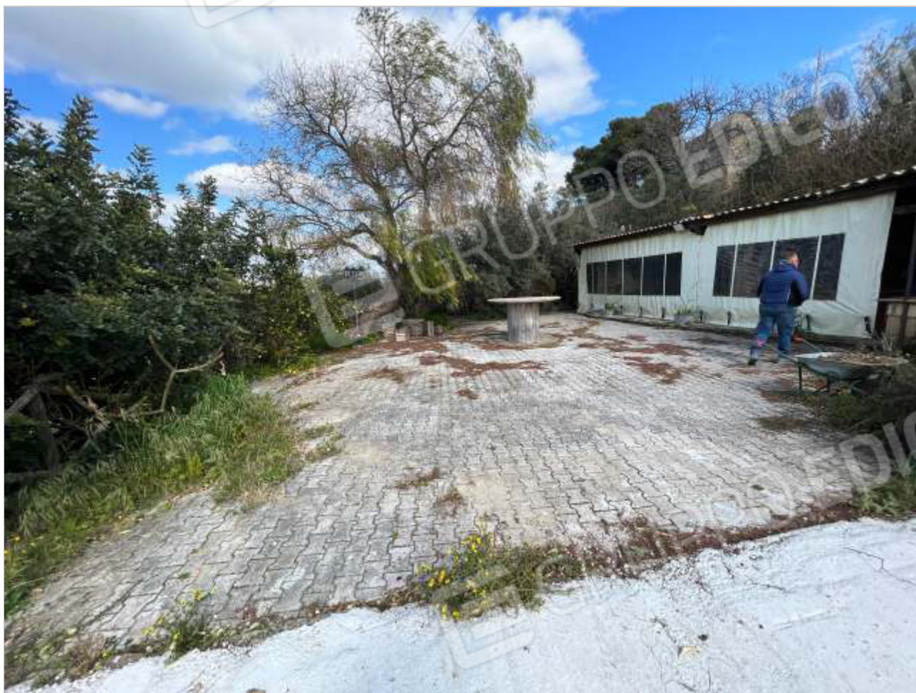
PIAZZALE ANTISTANTE IL MANUFATTO