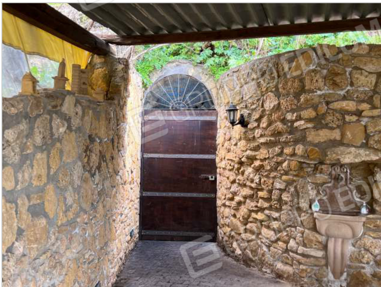
ACCESSO E VANO INTERNO