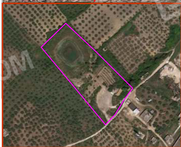
ORTOFOTO INDIVIDUAZIONE LOTTO