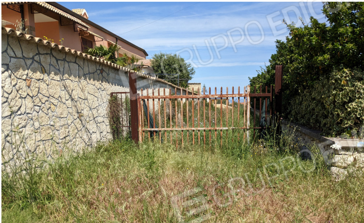
Accesso da Via Mascagni n.36