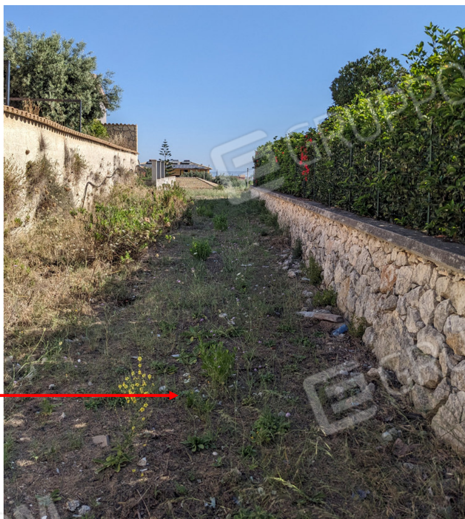
Particella 1070 Stradella di accesso di proprietà comunale