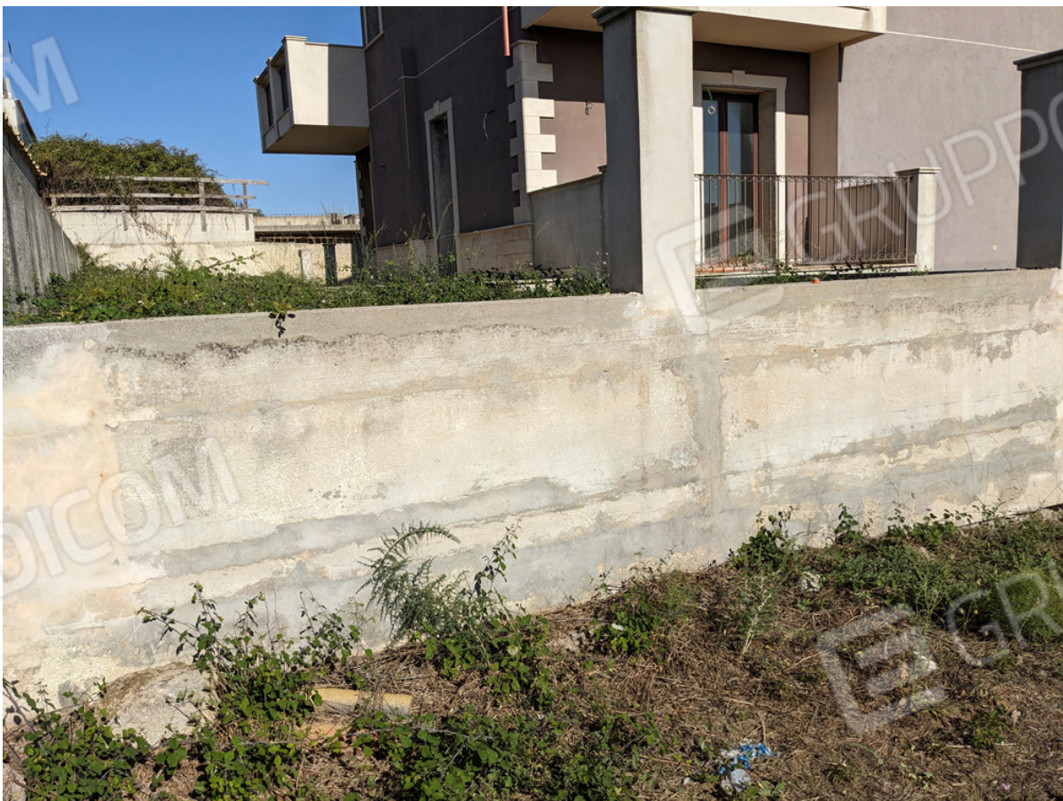
Particella 1683, subalterno 4 – Villino confinante con le particelle 1953 e 1956