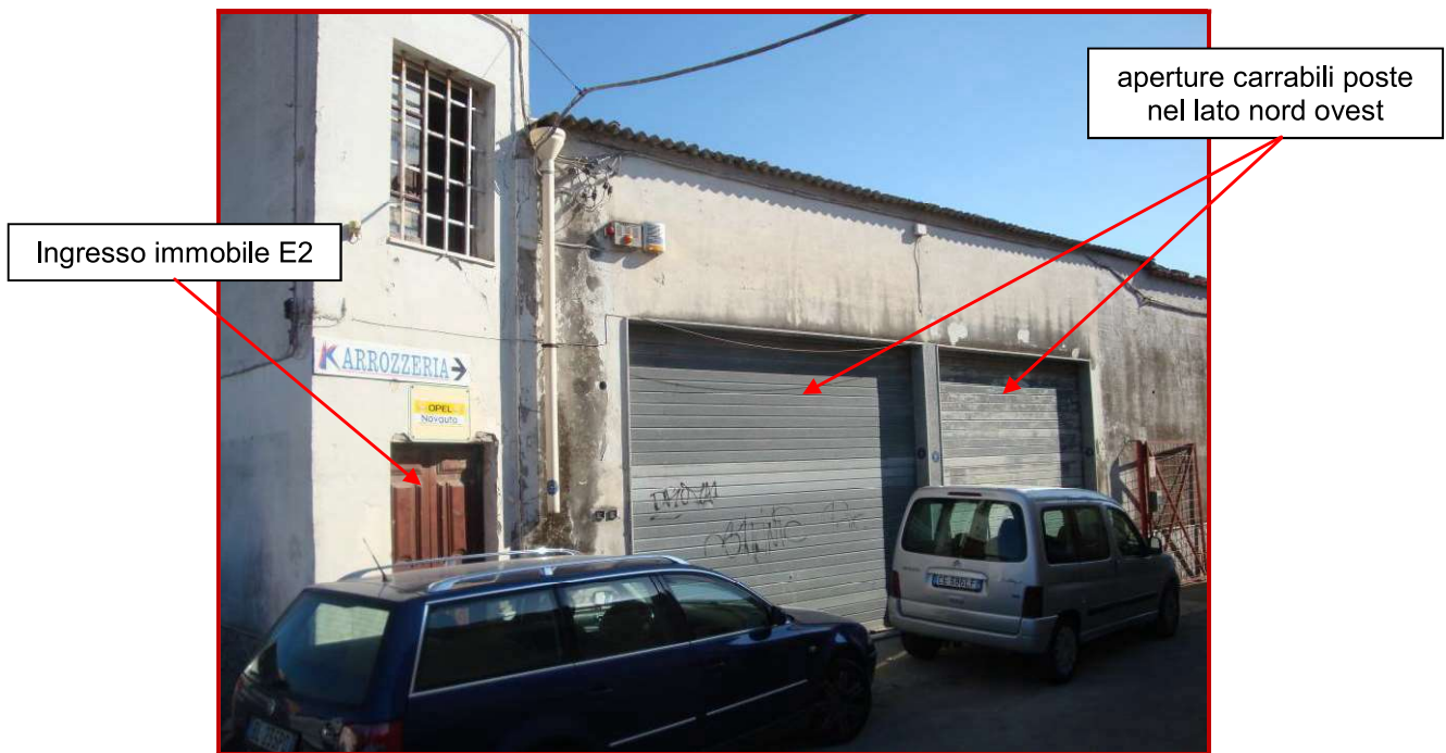
FOTO 2 - Prospetto nord ovest

Ermocrate, nella parte iniziale del tratto a nord ovest del capannone, si trovano due aperture carrabili di altezza m 3,30 e larghezza rispettivamente 3,90 m e 3,30.