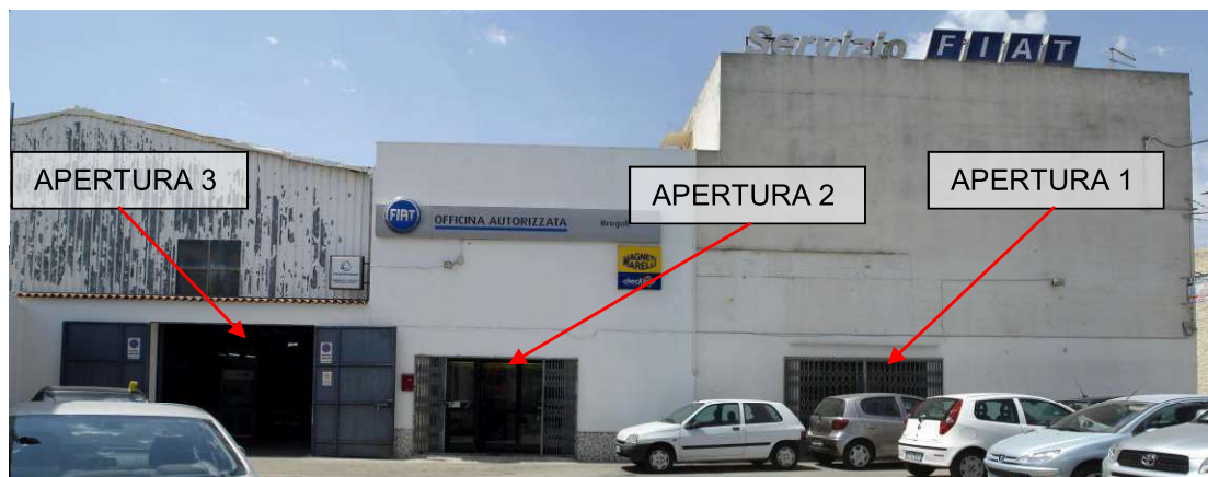
FOTO 1 - Prospetto nord est

A nord ovest e a sud ovest il capannone confina con una stradella e, procedendo da Viale