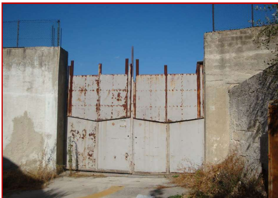
FOTO 3 - Prospetto sud ovest- apertura carrabile

Nel tratto di stradella posto a sud ovest si trova un'apertura carrabile di larghezza m 4.95 e altezza m 3,50.