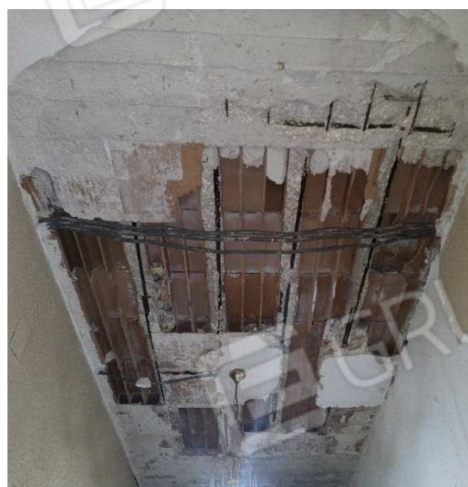
Foto n. 4-5: sfondellamento del solaio in corrispondenza del soprastante bagno