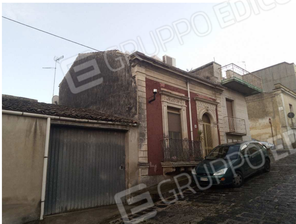
Fono n.1: Vista della Facciata esterna dell'immobile