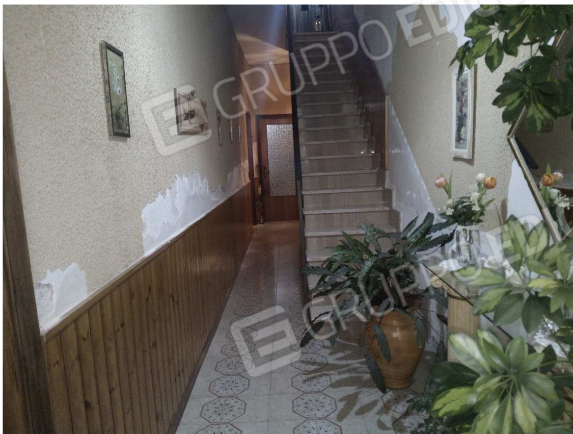
Foto n. 3: Androne d'ingresso (si nota umidità da risalita presente sulla parete a sx)