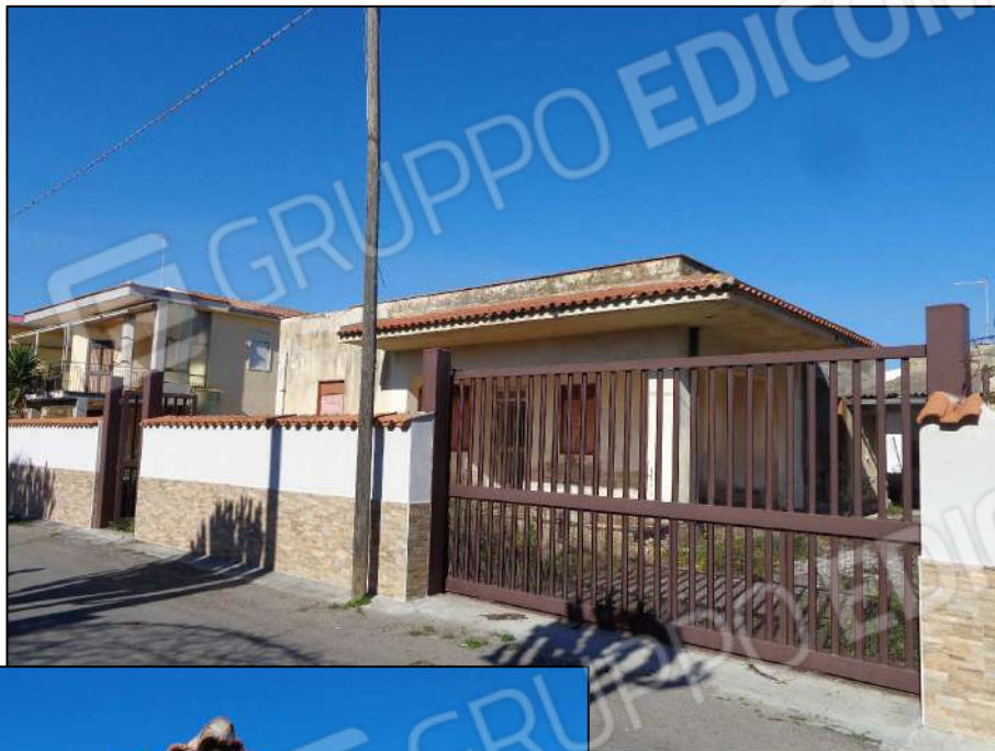
Prospetto dalla strada con cancelli d'ingresso.