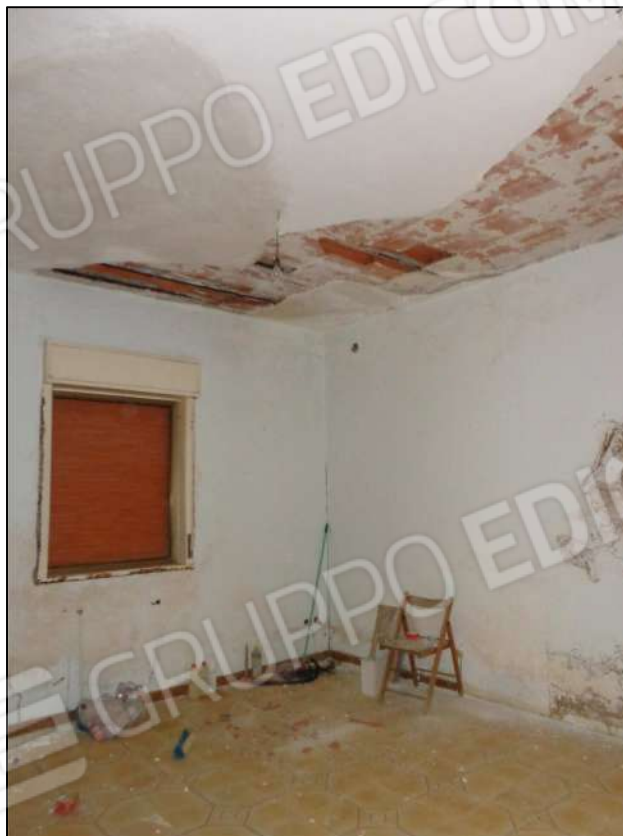
Soggiorno con apertura esterna.