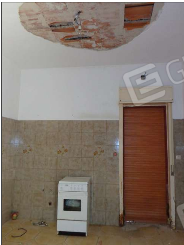
Cucina con apertura esterna.