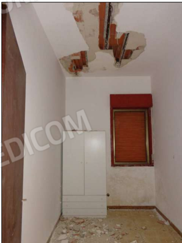
Cameretta nord-ovest con apertura esterna.