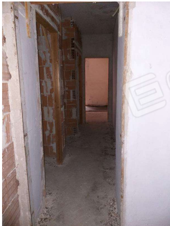
Foto 6_U.I. in ristrutturazione