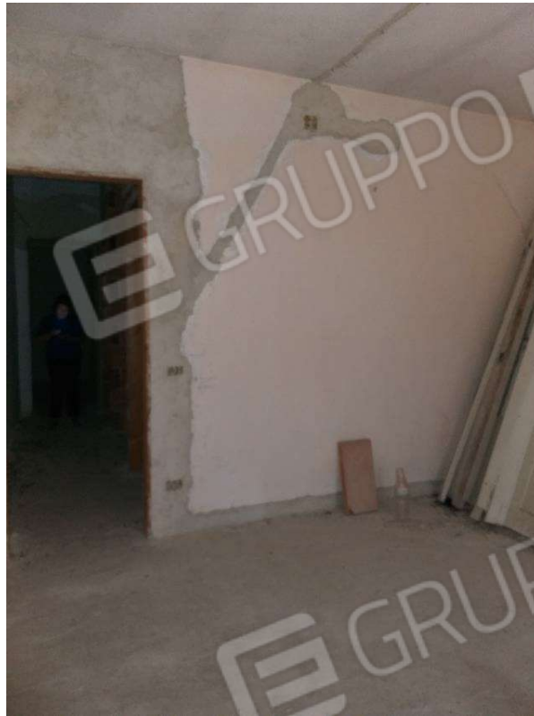
Foto 5_U.I. in ristrutturazione