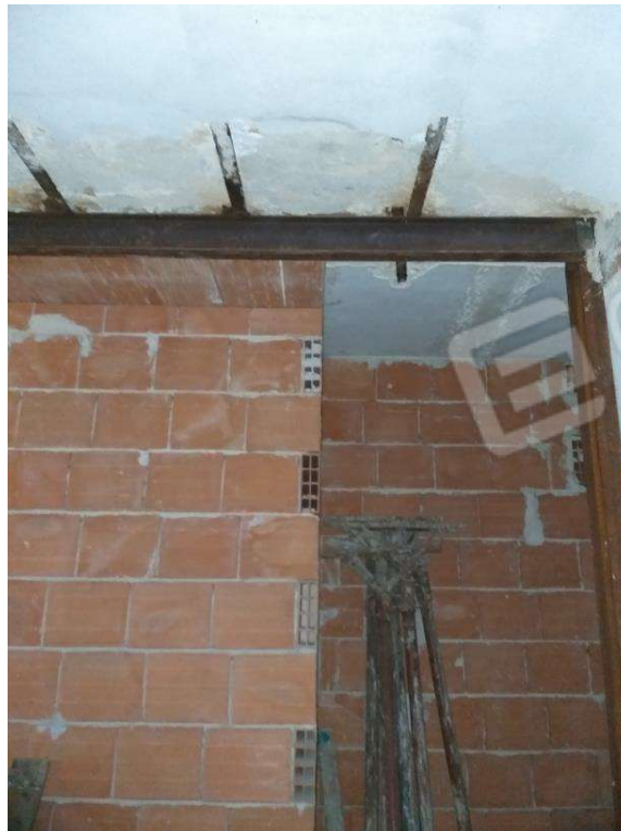
Foto 12_ particolare della trave IPE