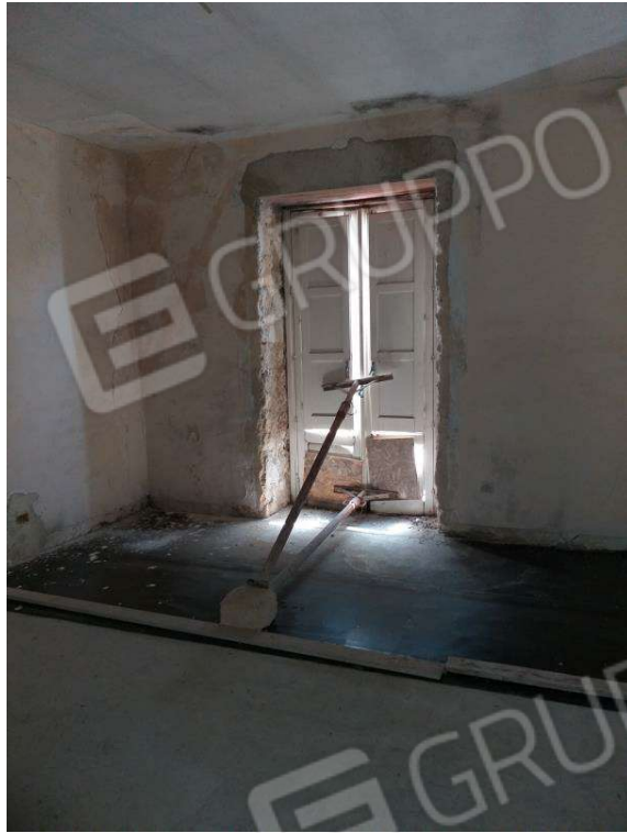
Foto 9_ U.I. in ristrutturazione