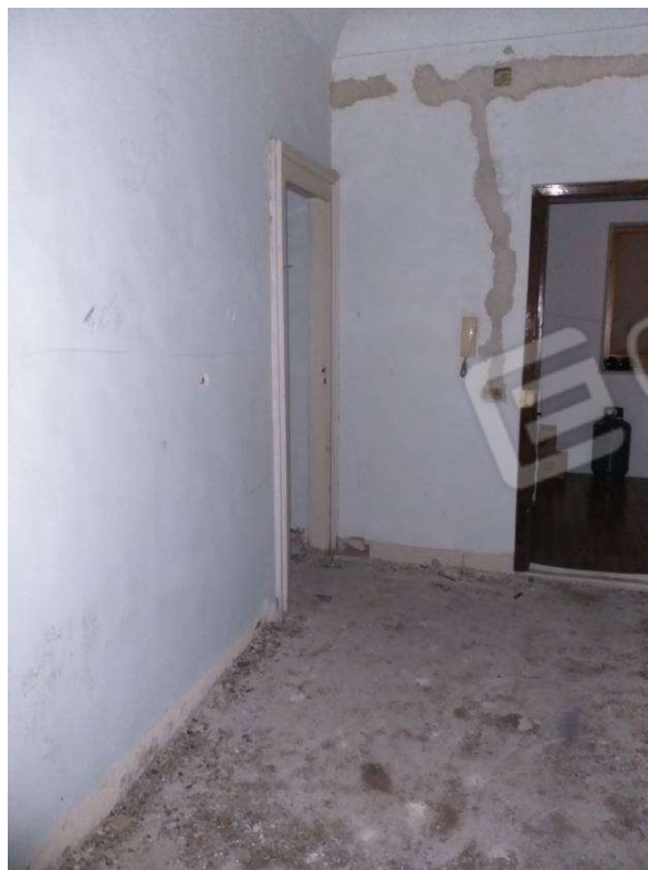
Foto 4_ingresso dell'appartamento