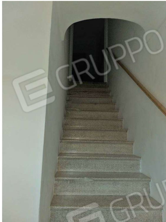
Foto 3_scale d'ingresso al pianerottolo condominiale dove si trova l'appartamento