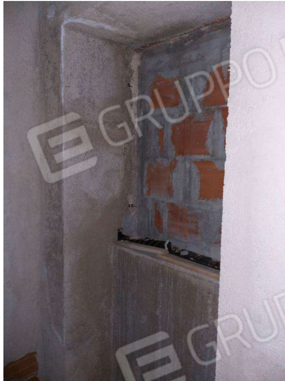
Foto 11_ particolare di una finestra murata