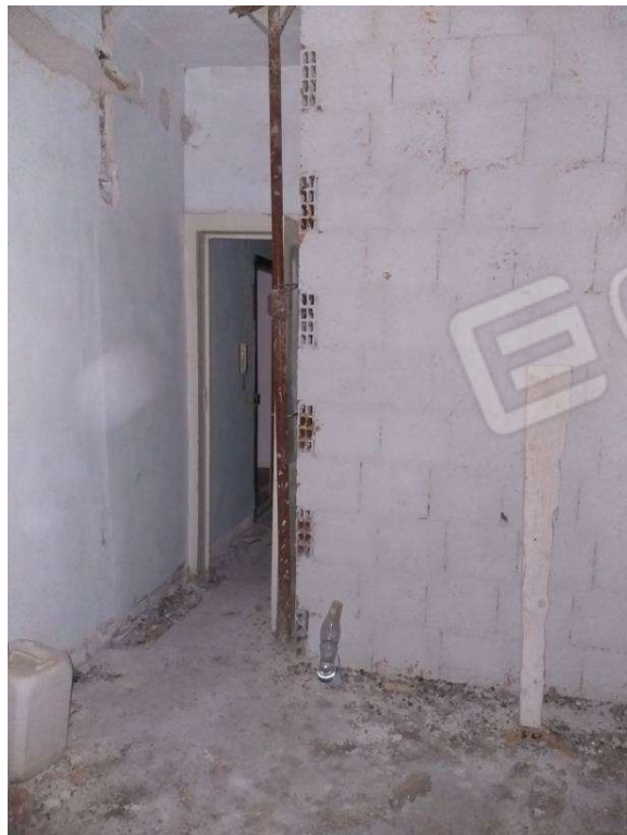
Foto 8_U.I. in ristrutturazione