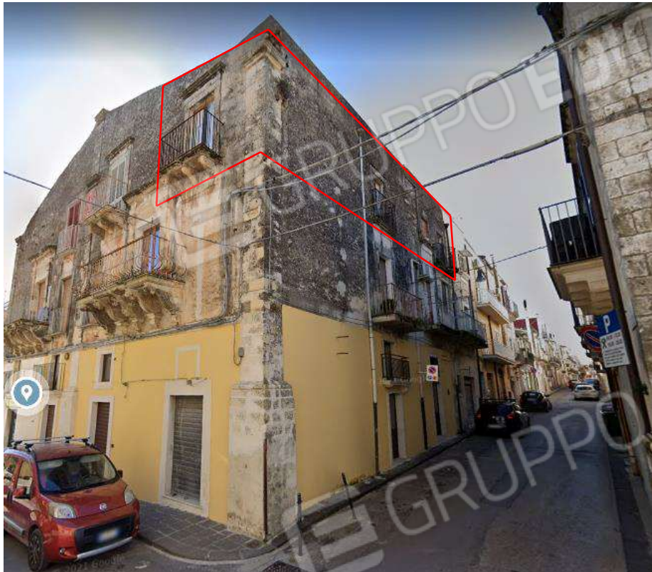
Foto 1 _individuazione dell'edificio dove si trova l'appartamento