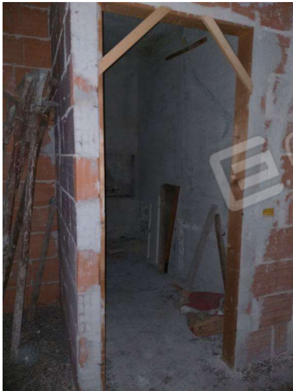
Foto 10_ U.I. in ristrutturazione