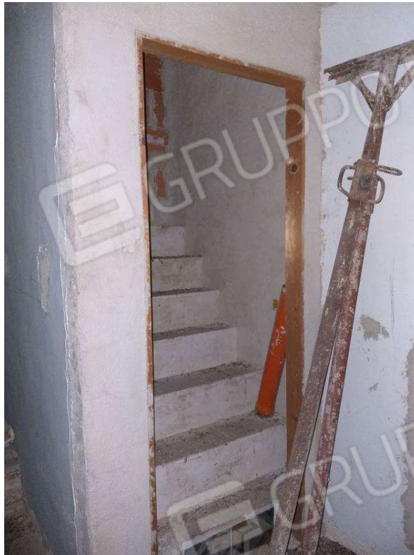
Foto 7_accesso con gradini murato