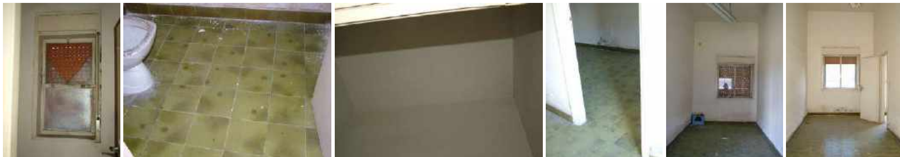
Foto 149,150, 151 vano B11 - bagno