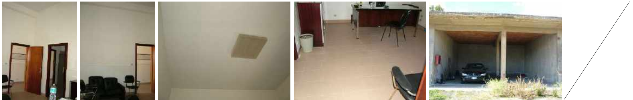
Foto 123,0vano B8 - magazzino