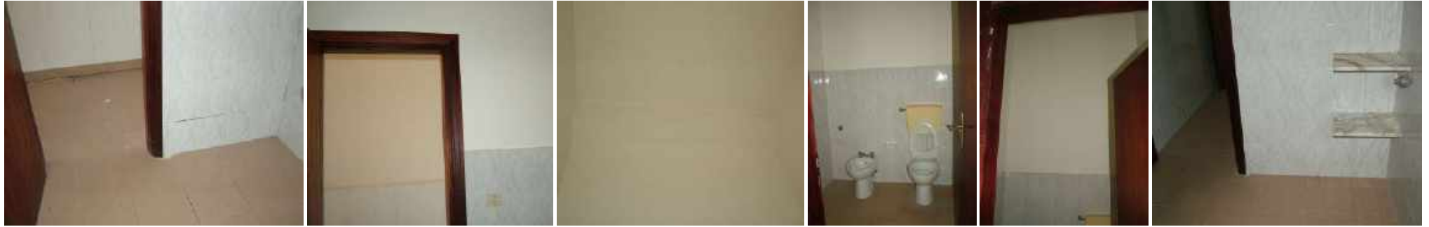
Foto 99,100,101, vano B4 - antibagno