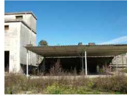
Foto 197-198 Tettoia E1