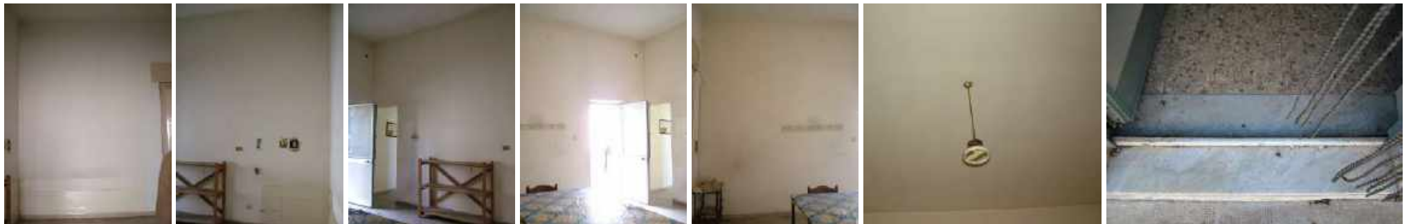
Foto 29-30-31-32-33-34-35-36-37-38-39 vano A1 - cucina