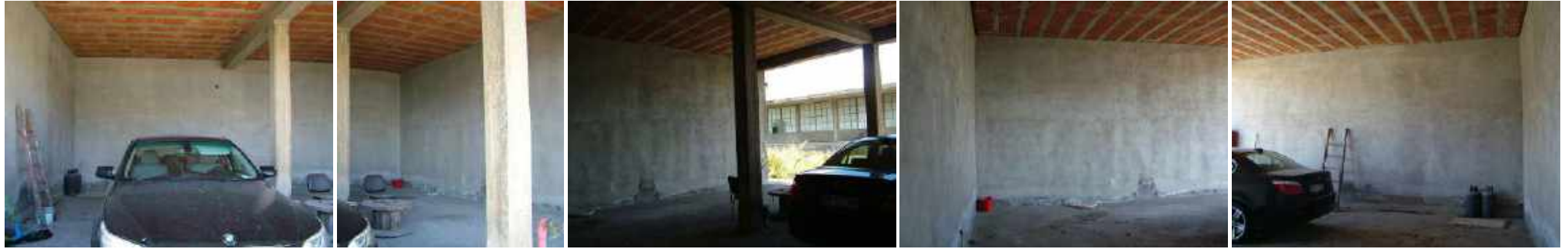
Foto da 124 a131, vano B8 - magazzino