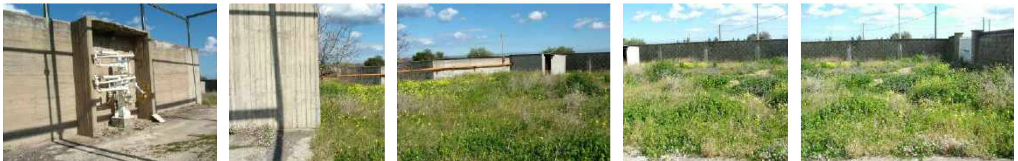
Foto 290-291-292-293 area di pertinenza R