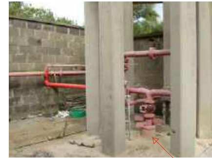
Foto 174-175-176-177 , pozzo trivellato P1e sovrastante serbatoio acqua sospeso Q