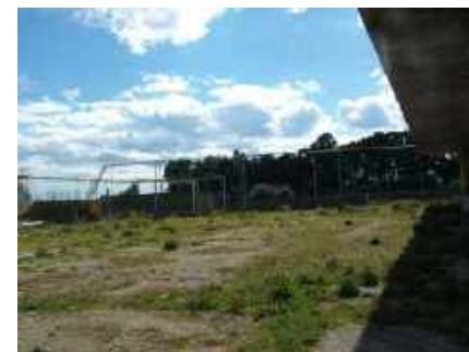
Foto 211, area di pertinenza