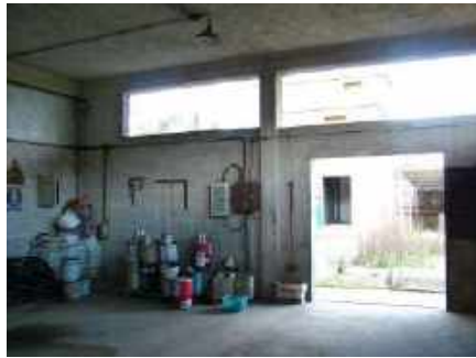
Foto 171 vano B15 - officina