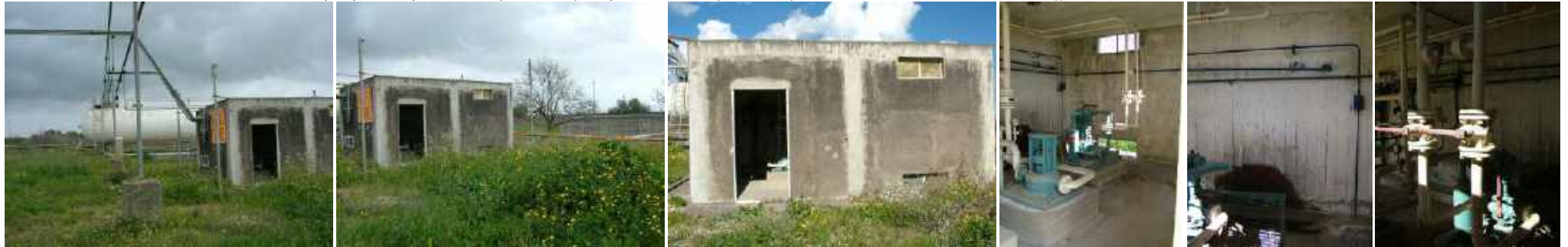
Foto da 277 a 283, Vano M1 - locale tecnico (sala pompe e compressori GPL)