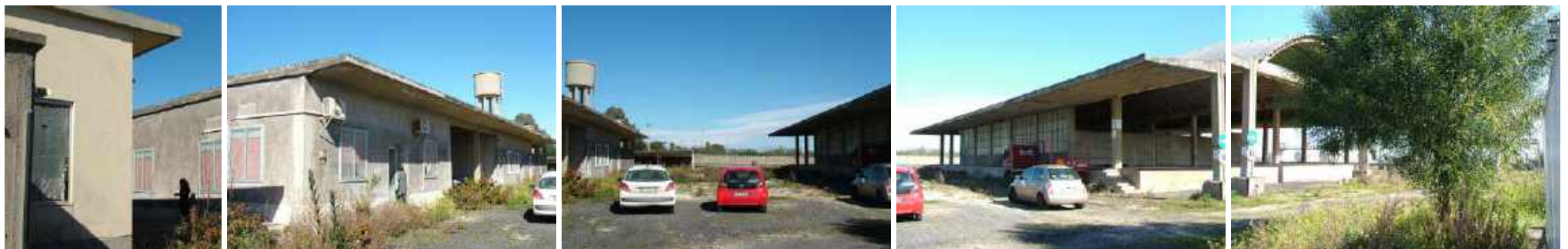
Foto 16-17-18-19-20 - area di pertinenza R, zona ingresso dal punto geografico 1