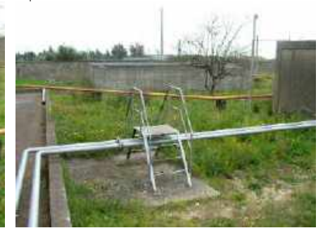
Foto 259-260, vasca di riserva idrica antincendio I