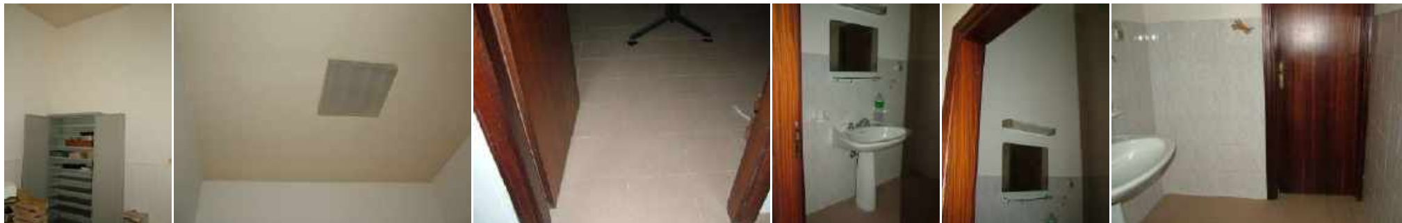
Foto da 91 a 98, vano B4 - antibagno