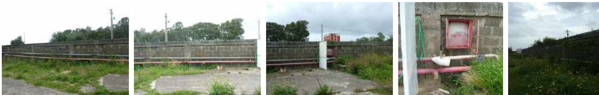
fossa imhoff (fi)