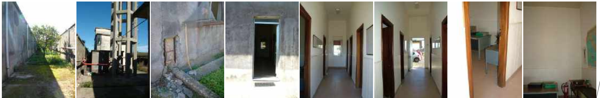
Foto 65, pozzo trivellato P