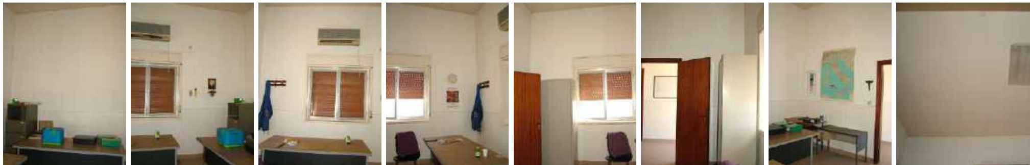
Foto da 72 a 80, vano B2 - ufficio