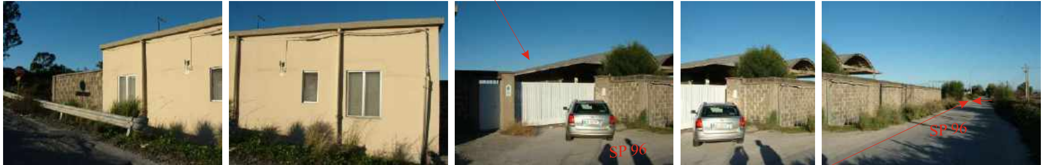
Foto 6-7-8-9-10 Cancelli di accesso - confine sud