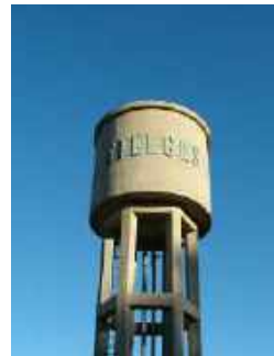
serbatoio sospeso Q