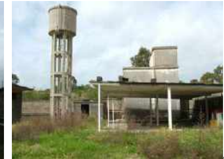
Foto 203 tettoia E1