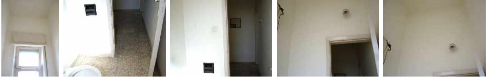
Foto da 48 a 52, vano A3 - bagno