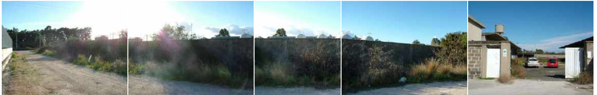
Foto 11-12-13-14 Confine est