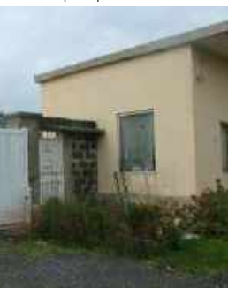
Foto 321-322, confine sud - ingresso principale al lotto (cancello carrabile e pedonale)