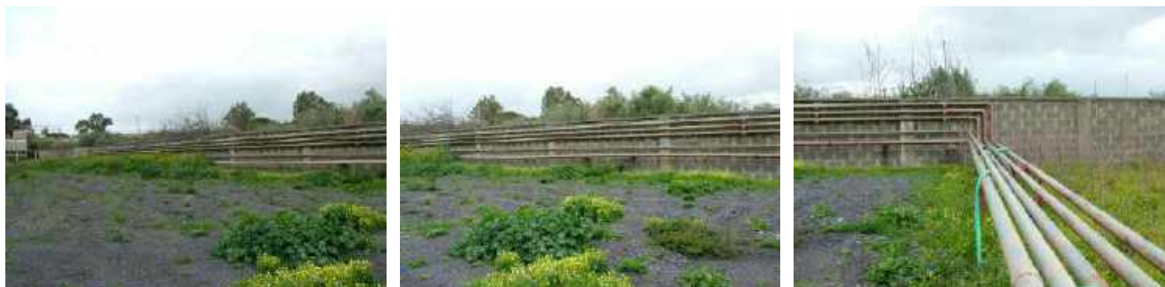
Foto 248-249-250, confine nord del cespite