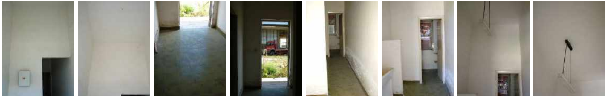
Foto da 138 a 145, vano B10 - antibagno