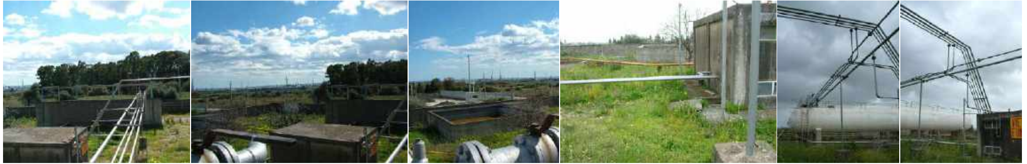
Foto 271-272-273-274, vista dai serbatoi della sala pompe e compressori GPL (immobile M), del punto di travaso (immobile N), della vasca di riserva idrica antincendio (I)