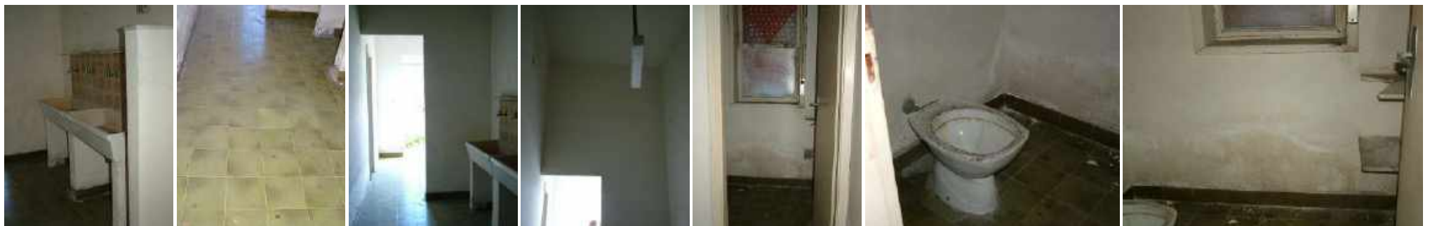
Foto 146-147-148, vano B11 - bagno