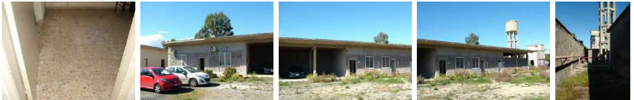
Foto da 60 a 64, immobile B