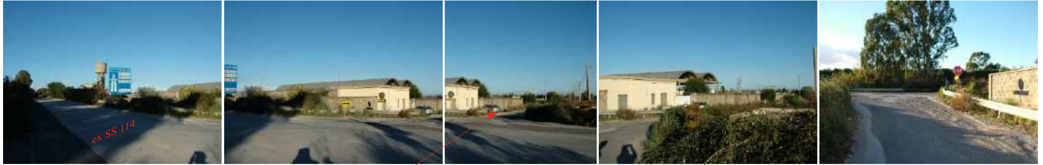
Foto 1-2-3-4-5 ex SS 114, km 132, confine ovest