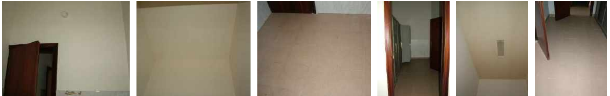
Foto 108,109,110,111,112, vano B6 - archivio