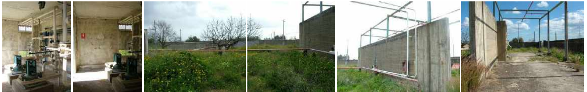
Foto 284-285, area di pertinenza R