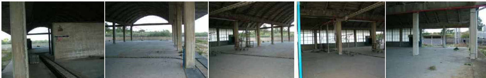
Foto da 233 a 247, vano F1 - capannone