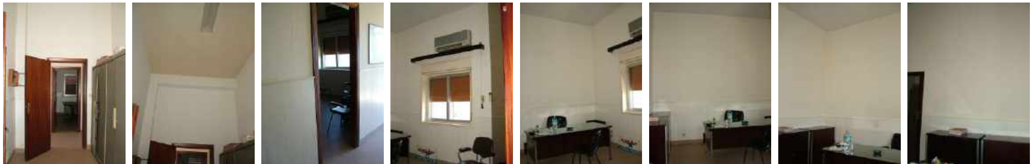
Foto da 133 a 122, vano B7 - ufficio