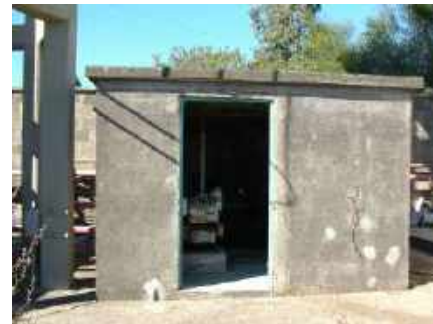
Foto 178-179-180-181-182 vano C1 - locale tecnico (pompe antincendio)