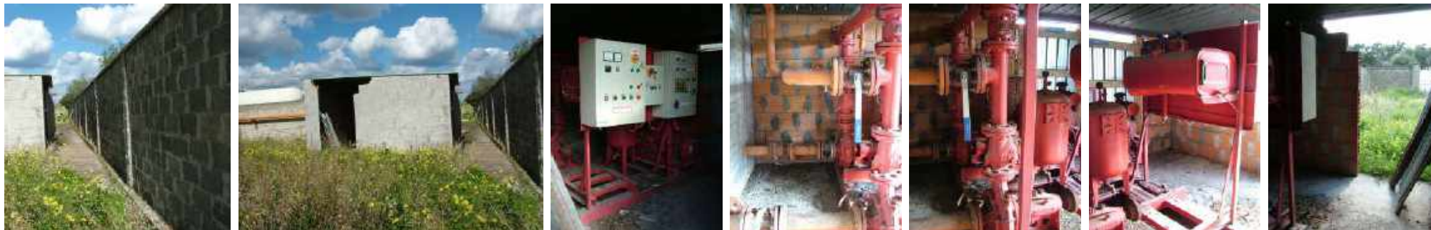
Foto 294 confine est del cespite Foto 295-296-297-298-299-300 vano L1 - locale tecnico (locale pompe antincendio)