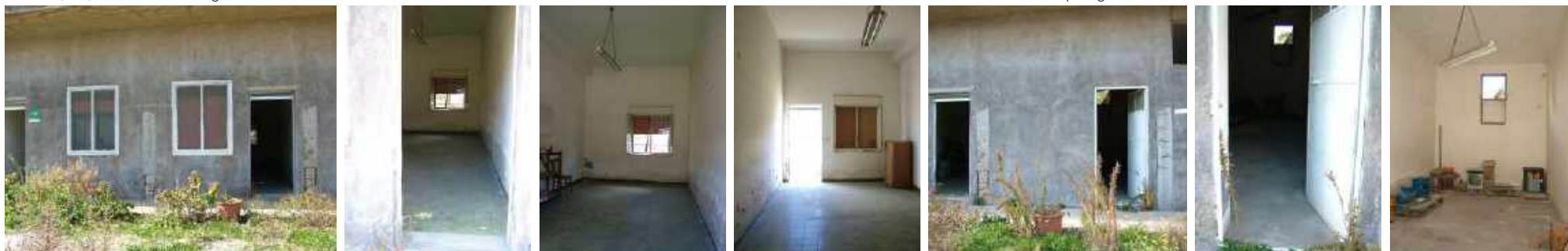
Foto 155-156-157-158, vano B13 - mensa