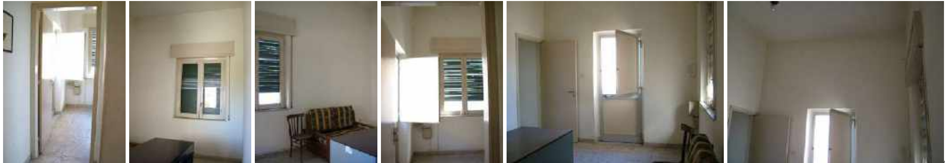
Foto da 53 a 59, vano A4 - ufficio