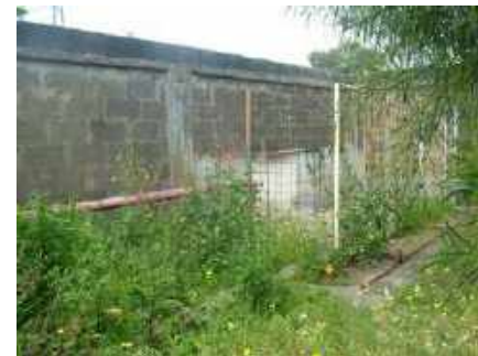
Foto 317-318-319-320, confine sud - punto O di attacco motopompa W FF