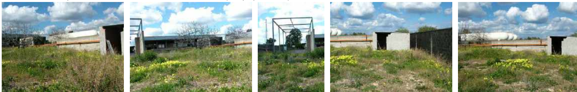
Foto da 301 a 306 area di pertinenza