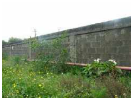
Foto 314-315-316, confine sud del cespite