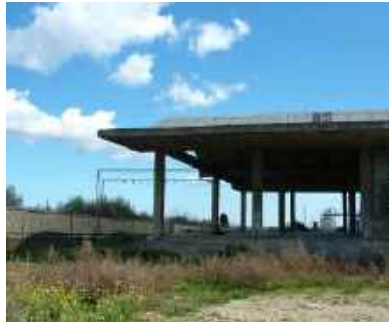
Foto 199-200-201 immobile F (capannone a ribalta)