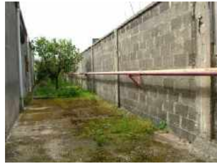
Foto 172-173 confine ovest