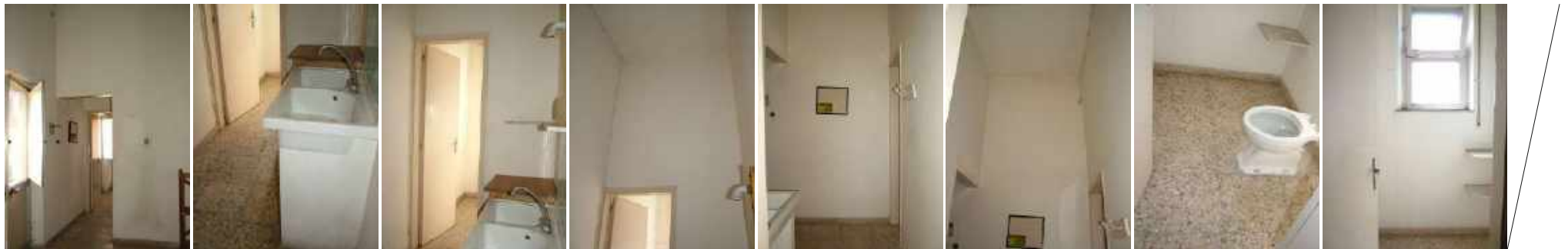
Foto da 40 a 45, vano A2 - disimpegno