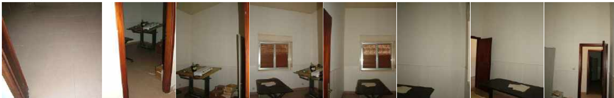
Foto da 81 a 90, vano B3 - ufficio