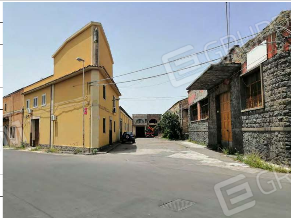
Foto n.2: immagine esterna dell'edificio angolo tra via Degli Esportatori e via Puglia a Lentini.