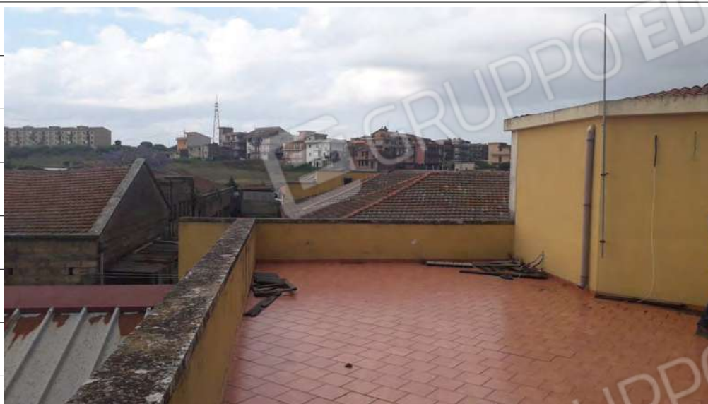
Foto n.31: immagine esterna della terrazza ubicata al piano secondo e raggiungibile dal corpo scala.