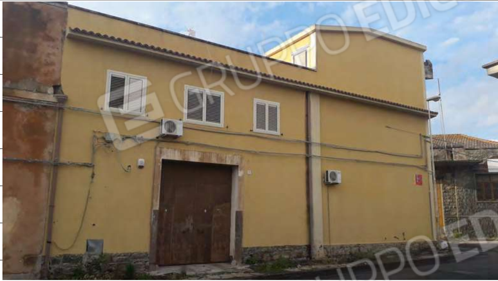
Foto n.1: immagine esterna dell'ingresso dell'edificio da via Degli Esportatori n.11 a Lentini.