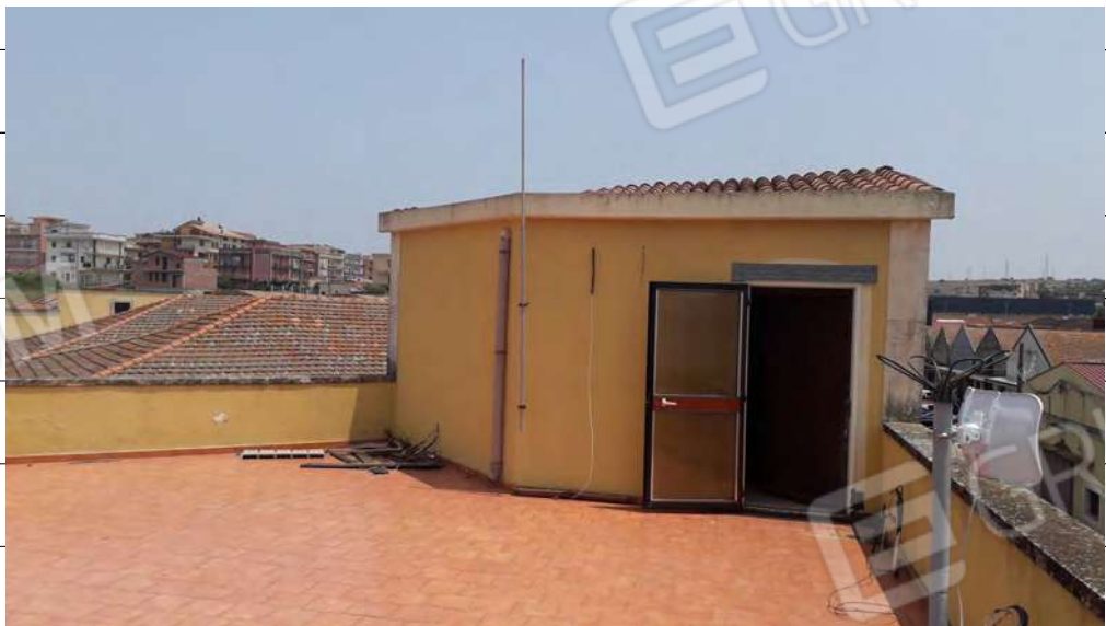
Foto n.34: immagine esterna del torrino scala ubicato al piano secondo dell'edificio.