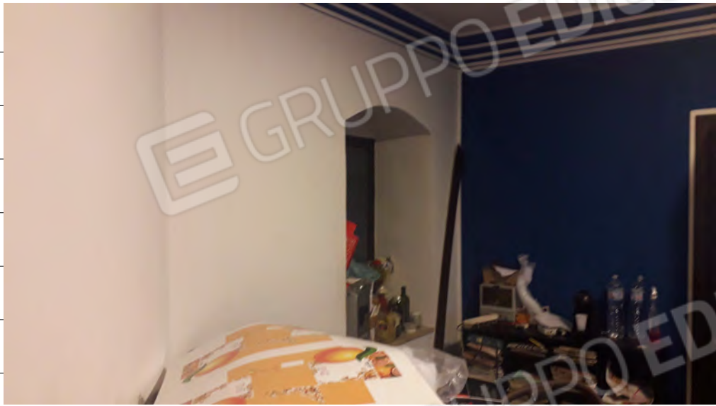
Foto n.25: immagine interna del locale adibito a camera (1) ubicato al primo piano dell'edificio ed attualmente usato come ufficio.