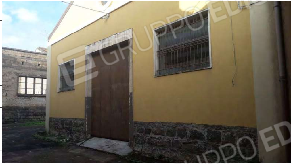
Foto n.5: immagine esterna dell'ingresso dell'edificio da via Atri s.n.c. a Lentini.