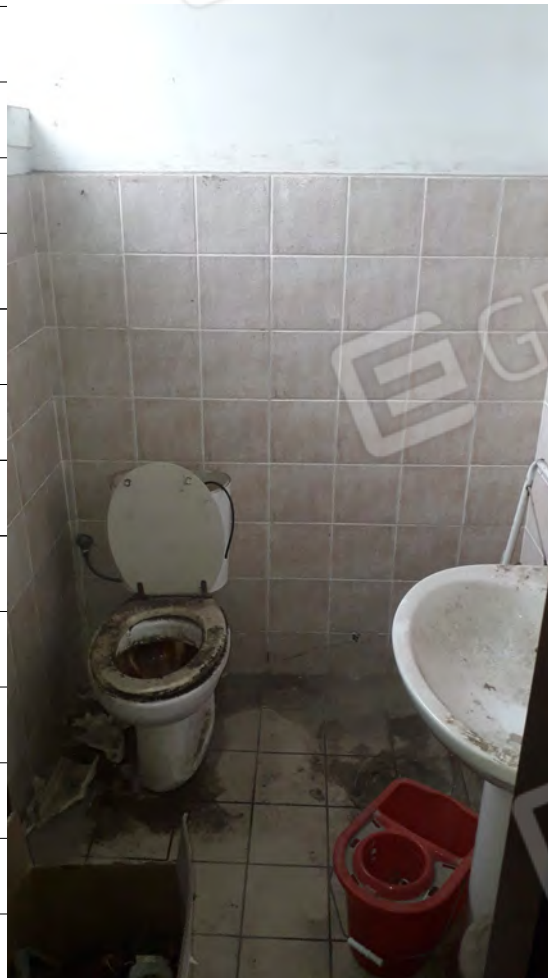
Foto n.14: immagine interna del wc ubicato al piano terra dell'edificio.