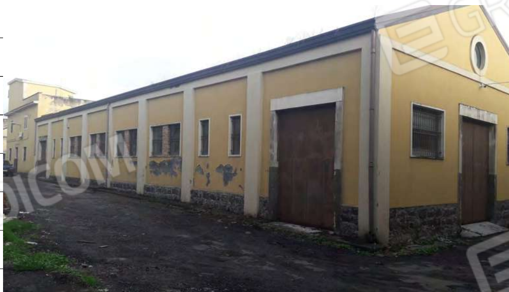
Foto n.4: immagine esterna dell'edificio angolo tra via Puglia e via Atri con relativi ingressi a Lentini.