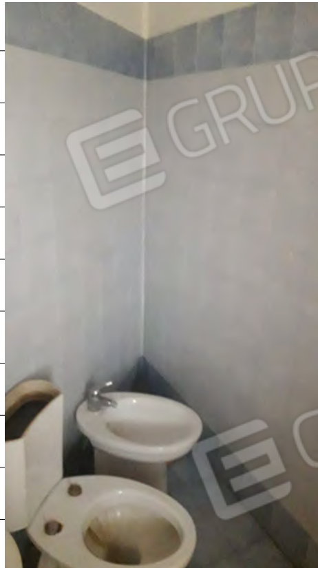
Foto n.27: immagine interna del locale adibito a wc ubicato al primo piano dell'edificio.