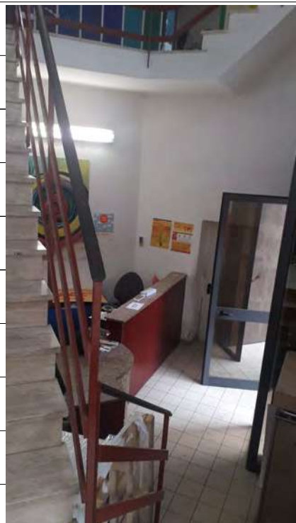
Foto n.20: immagine interna del corpo scala di collegamento tra i piani terra, primo e secondo.