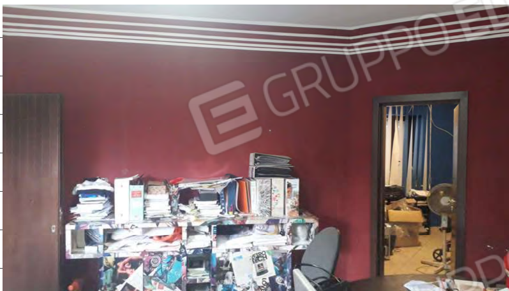
Foto n.23: immagine interna dell'ambiente soggiorno-cucina ubicato al primo piano dell'edificio ed attualmente usato come ufficio.