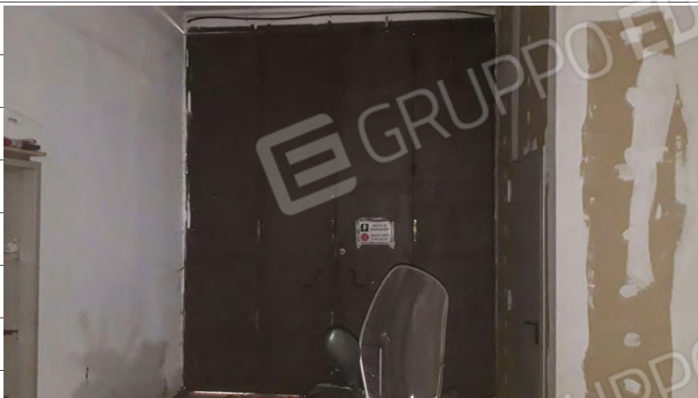
Foto n.11: immagine interna della zona adibita a tipografia ubicata al piano terra.