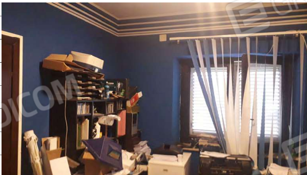
Foto n.24: immagine interna del locale adibito a camera (1) ubicato al primo piano dell'edificio ed attualmente usato come ufficio.