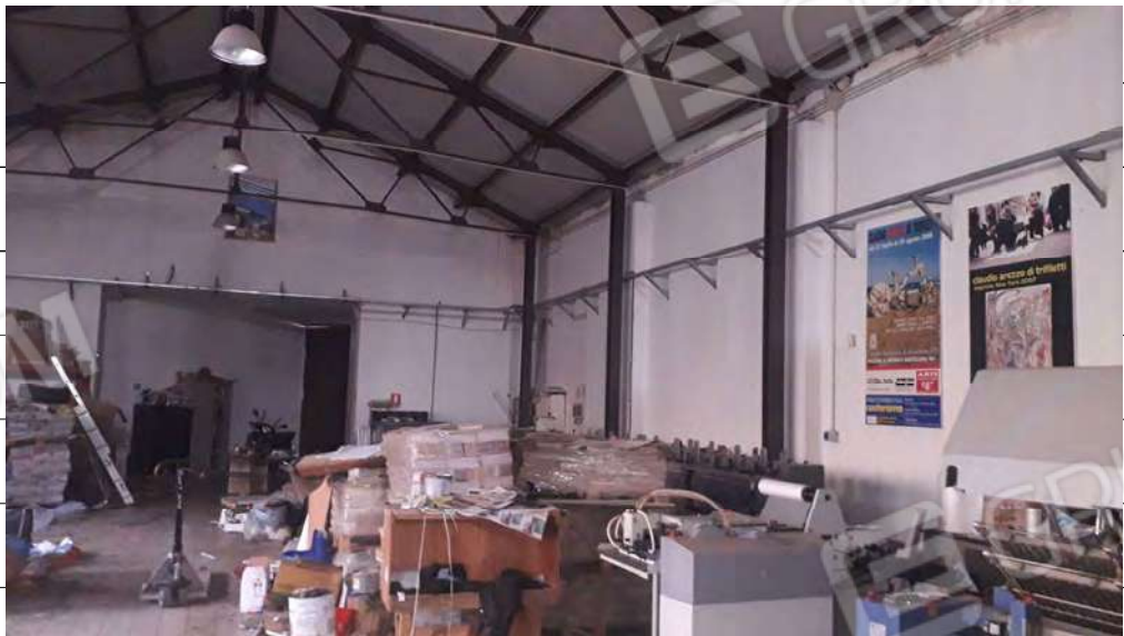
Foto n.10: immagine interna della zona adibita a tipografia ubicata al piano terra.