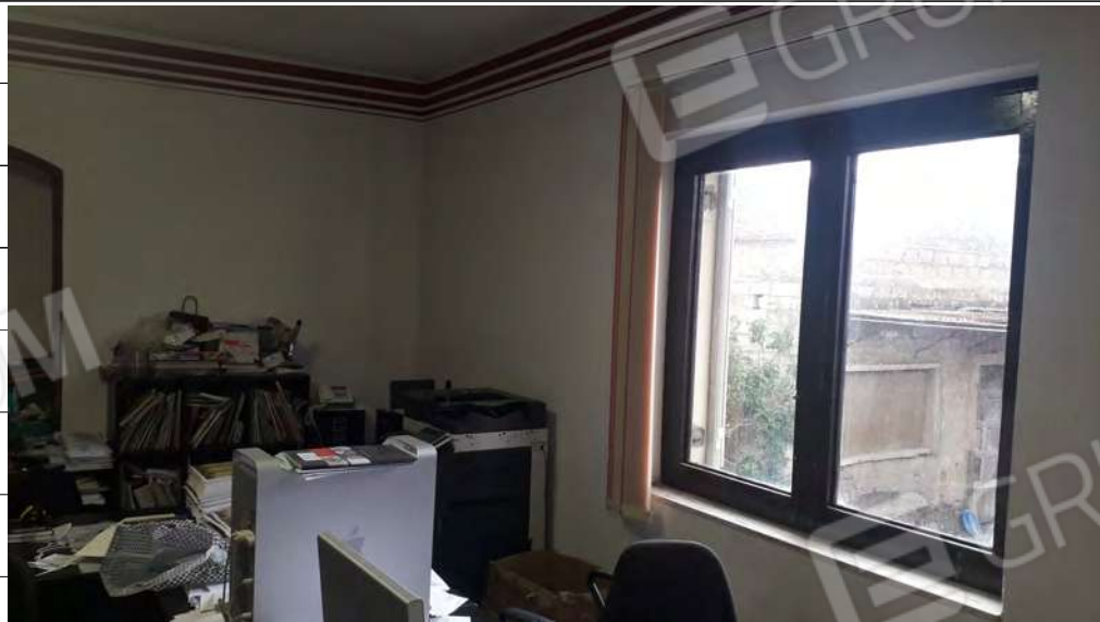
Foto n.22: immagine interna dell'ambiente soggiorno-cucina ubicato al primo piano dell'edificio ed attualmente usato come ufficio.