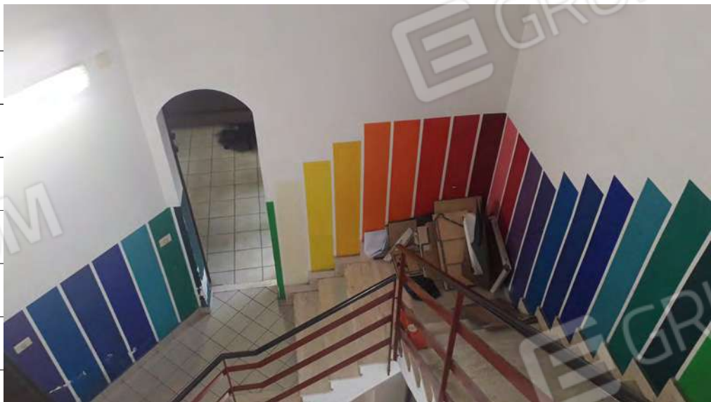
Foto n.30: immagine interna del corpo scala di collegamento tra i piani terra, primo e secondo.