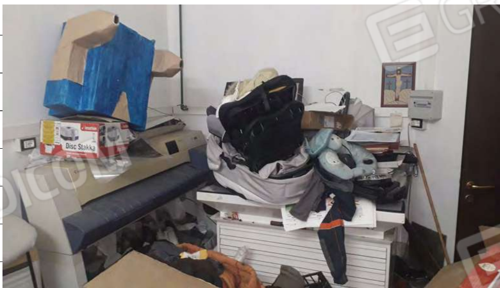
Foto n.16: immagine interna della zona adibita a sala stampa ubicata al piano terra.