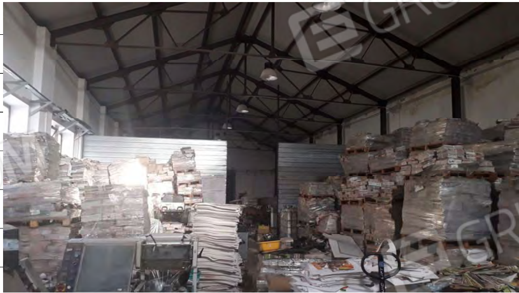
Foto n.6: immagine interna della zona adibita a confezionamento ubicata al piano terra.