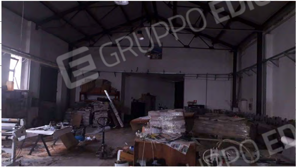
Foto n.9: immagine interna della zona adibita a tipografia ubicata al piano terra.