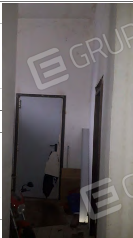
Foto n.15: immagine interna dell'ingresso al corpo scala ubicato al piano terra.