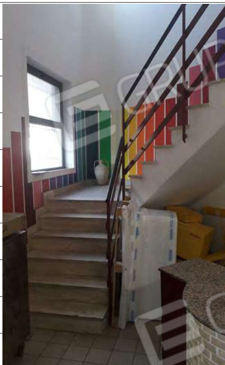
Foto n.19: immagine interna del corpo scala di collegamento tra i piani terra, primo e secondo.