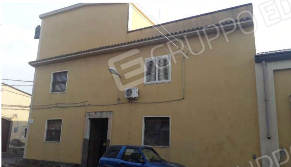
Foto n.3: immagine esterna dell'ingresso dell'edificio da via Puglia n.1 a Lentini.