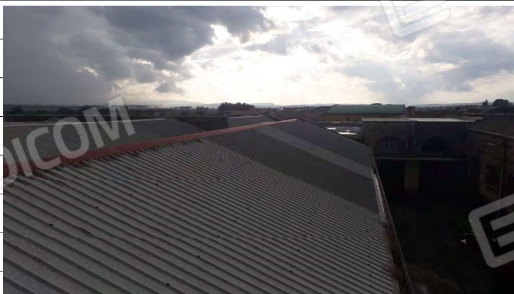
Foto n.32: immagine esterna della copertura a falde della tipografia.