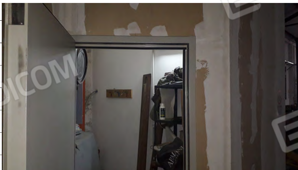
Foto n.12: immagine interna del ripostiglio ubicato al piano terra.