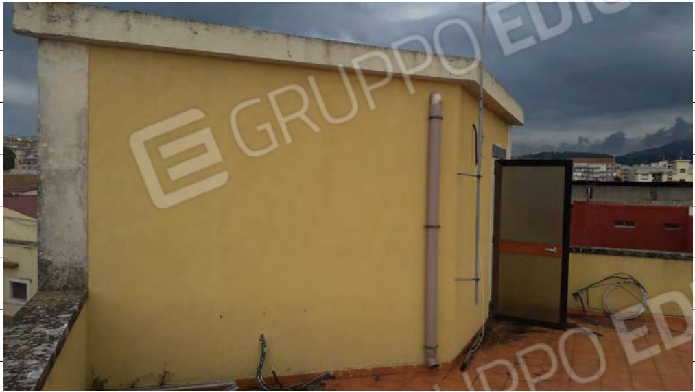
Foto n.33: immagine esterna del torrino scala ubicato al piano secondo dell'edificio.