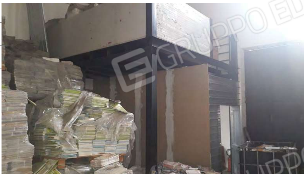
Foto n.7: immagine del ripostiglio presente all'interno della zona di confezionamento.