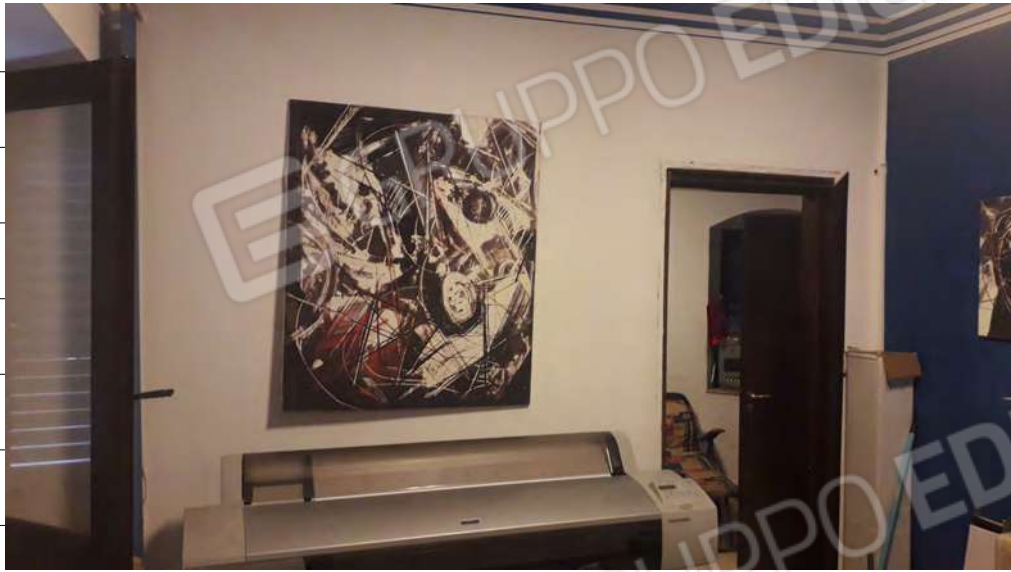
Foto n.29: immagine interna del locale adibito a camera (2) ubicato al primo piano dell'edificio ed attualmente usato come ufficio.