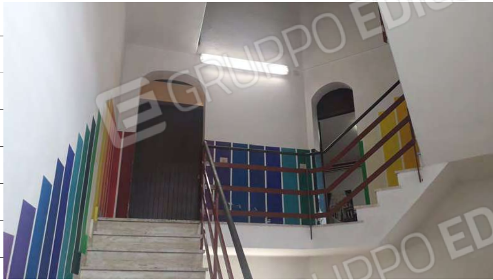
Foto n.21: immagine interna del corpo scala di collegamento tra i piani terra, primo e secondo.