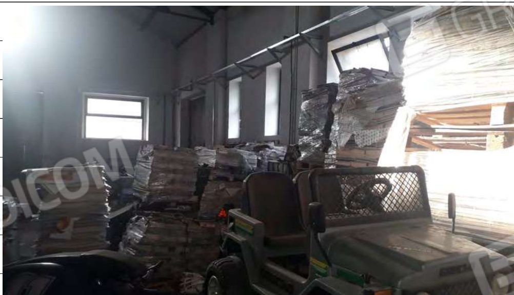
Foto n.8: immagine interna della zona adibita a confezionamento ubicata al piano terra.