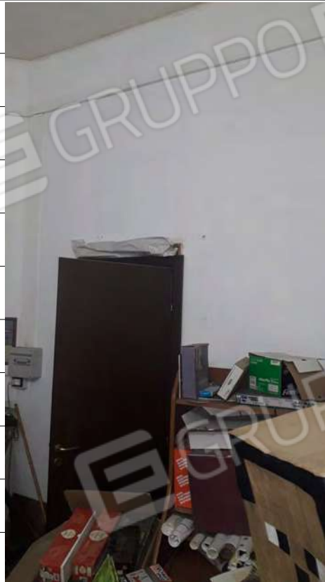
Foto n.17: immagine interna della zona adibita a sala stampa ubicata al piano terra.