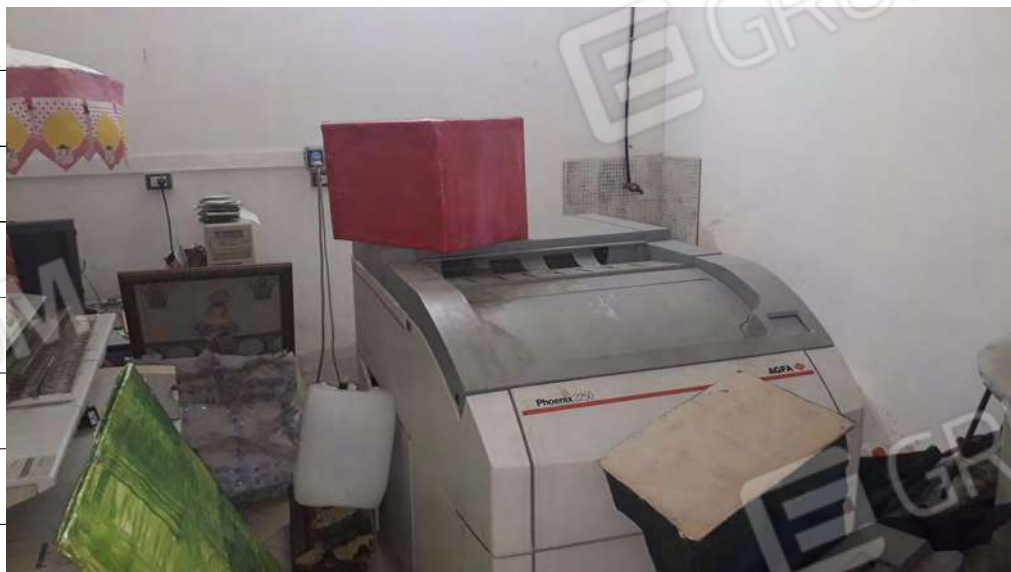
Foto n.18: immagine interna della zona adibita a sala stampa ubicata al piano terra.