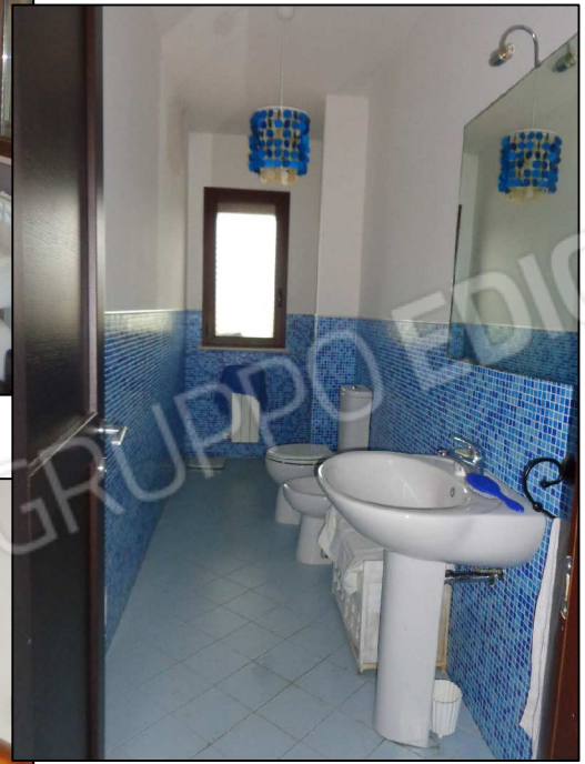
Servizio igienico P.T. con infissi int. ed est.