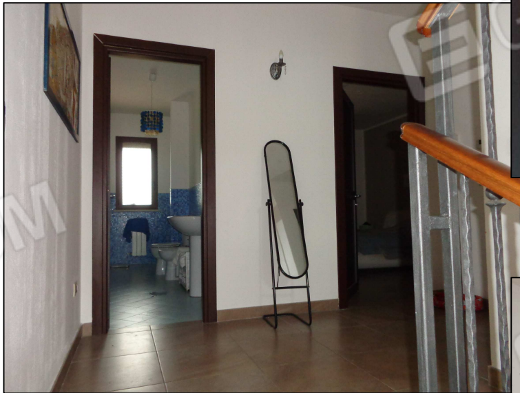
Disimpegno P. 1°.