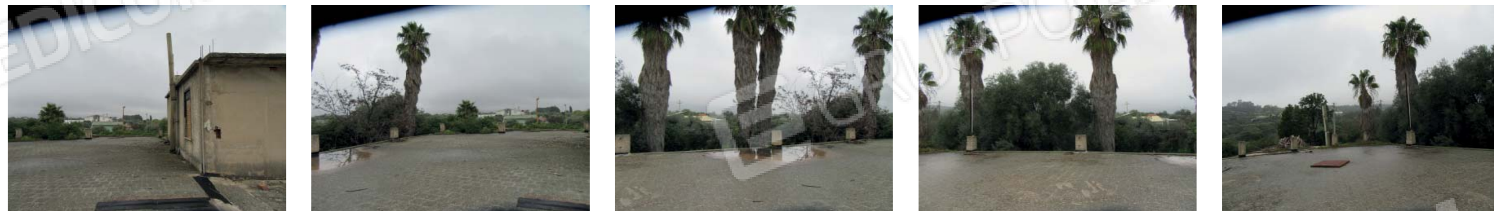
Foto da 61 a 75_ terrazza di pertinenza esclusiva del bene