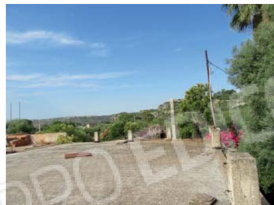
Rilievo fotografico 10 del 06/07/2020

Lotto n. 1 - abitazione a piano primo con terrazzi di pertinenza esclusivi, sito in Floridia, Contrada Fegotto, facente parte di un insediamento a prevalente destinazione commerciale, composto da una costruzione comprendente due unità immobiliari, edificata su un lotto di terreno esteso catastalmente 57.95are, con ingressi non autonomi da traversa alla SP 74, denominata Strada Scala di Gemmazza, al punto geografico 37°04'20.0"N 15°07'45.1"E e al punto geografico 37°04'21.4"N 15°07'43.7"E censita nel NCEU del Comune di Floridia (SR) al F. 10 P.lla 248 sub 2. L'area di pertinenza scoperta dell'insediamento è censita nel NCT di Floridia al F. 10 P.lla 139, qualità seminativo arborato, di 4.924mq.