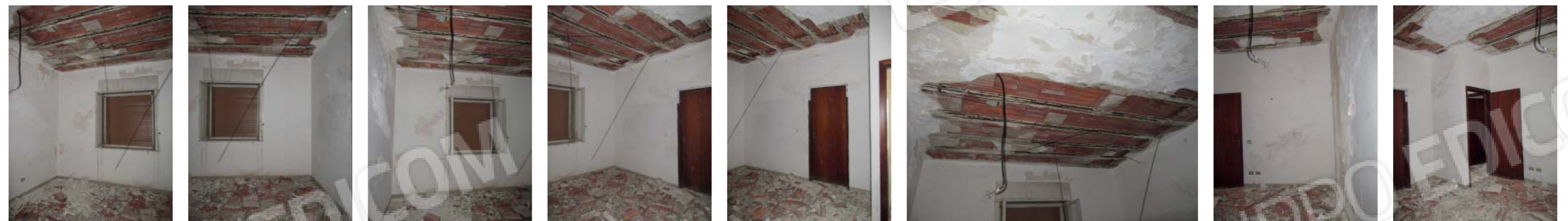
Foto da 141 a 148 , vano A7