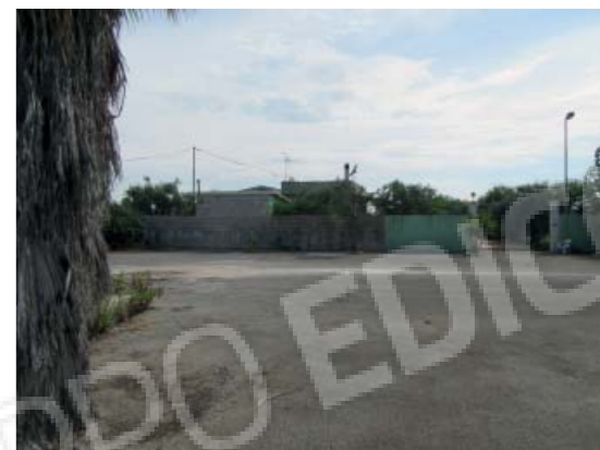
Rilievo fotografico 4 del 06/07/2020

Lotto n. 1 - abitazione a piano primo con terrazzi di pertinenza esclusivi, sito in Floridaia, Contrada Fegotto, facente parte di un insediamento a prevalente destinazione commerciale, composto da una costruzione comprendente due unità immobiliari, edificata su un lotto di terreno esteso catastalmente 57.95are, con ingressi non autonomi da traversa alla SP 74, denominata Strada Scala di Gemmazza, al punto geografico 37°04'20.0"N 15°07'45.1"E e al punto geografico 37°04'21.4"N 15°07'43.7"E censita nel NCEU del Comune di Floridaia (SR) al F. 10 P.lla 248 sub 2. L'area di pertinenza scoperta dell'insediamento è censita nel NCT di Floridaia al F. 10 P.lla 139, qualità seminativo arborato, di 4.924mq.