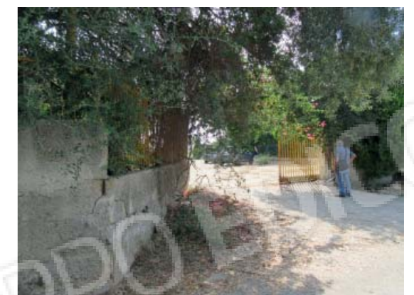
Rilievo fotografico 1 del 06/07/2020

Lotto n. 1 - abitazione a piano primo con terrazzi di pertinenza esclusivi, sito in Floridaia, Contrada Fegotto, facente parte di un insediamento a prevalente destinazione commerciale, composto da una costruzione comprendente due unità immobiliari, edificata su un lotto di terreno esteso catastalmente 57.95are, con ingressi non autonomi da traversa alla SP 74, denominata Strada Scala di Gemmazza, al punto geografico 37°04'20.0"N 15°07'45.1"E e al punto geografico 37°04'21.4"N 15°07'43.7"E censita nel NCEU del Comune di Floridaia (SR) al F. 10 P.lla 248 sub 2. L'area di pertinenza scoperta dell'insediamento è censita nel NCT di Floridaia al F. 10 P.lla 139, qualità seminativo arborato, di 4.924mq.