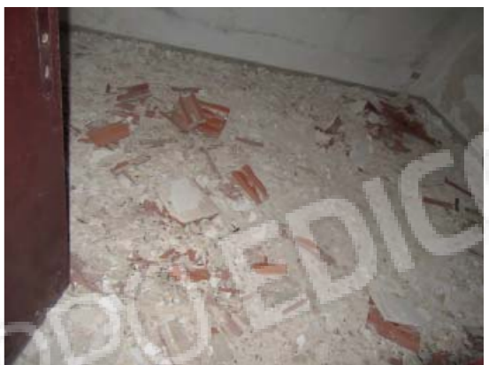
Rilievo fotografico 8 del 06/07/2020

Lotto n. 1 - abitazione a piano primo con terrazzi di pertinenza esclusivi, sito in Florida, Contrada Fegotto, facente parte di un insediamento a prevalente destinazione commerciale, composto da una costruzione comprendente due unità immobiliari, edificata su un lotto di terreno esteso catastalmente 57.95are, con ingressi non autonomi da traversa alla SP 74, denominata Strada Scala di Gemmazza, al punto geografico 37°04'20.0"N 15°07'45.1"E e al punto geografico 37°04'21.4"N 15°07'43.7"E censita nel NCEU del Comune di Florida (SR) al F. 10 P.lla 248 sub 2. L'area di pertinenza scoperta dell'insediamento è censita nel NCT di Florida al F. 10 P.lla 139, qualità seminativo arborato, di 4.924mq.