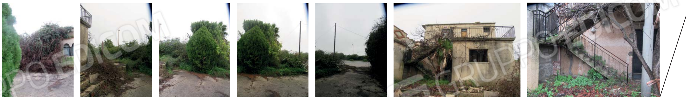
Foto da 21 a 28 - scala di accesso al bene