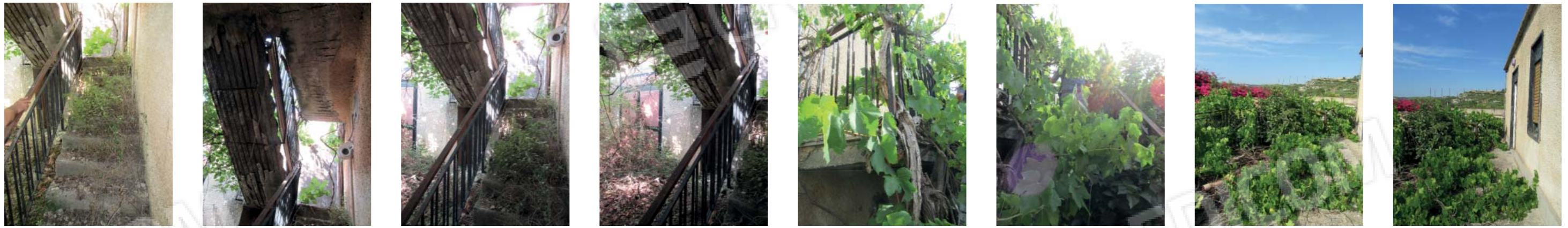
Foto da 119 a 126- rampe di accesso al bene in oggetto