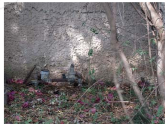
Foto da 115 a 118 - allaccio rete idrica