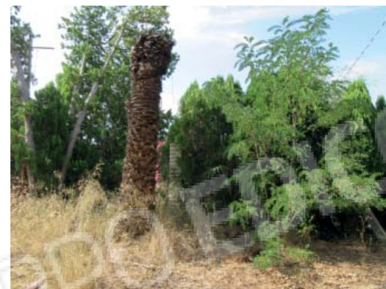
Rilievo fotografico 3 del 06/07/2020

Lotto n. 1 - abitazione a piano primo con terrazzi di pertinenza esclusivi, sito in Florida, Contrada Fegotto, facente parte di un insediamento a prevalente destinazione commerciale, composto da una costruzione comprendente due unità immobiliari, edificata su un lotto di terreno esteso catastalmente 57.95are, con ingressi non autonomi da traversa alla SP 74, denominata Strada Scala di Gemmazza, al punto geografico 37°04'20.0"N 15°07'45.1"E e al punto geografico 37°04'21.4"N 15°07'43.7"E censita nel NCEU del Comune di Florida (SR) al F. 10 P.lla 248 sub 2. L'area di pertinenza scoperta dell'insediamento è censita nel NCT di Florida al F. 10 P.lla 139, qualità seminativo arborato, di 4.924mq.