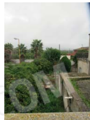
Foto da 76 a 88_ terrazza di pertinenza esclusiva del bene