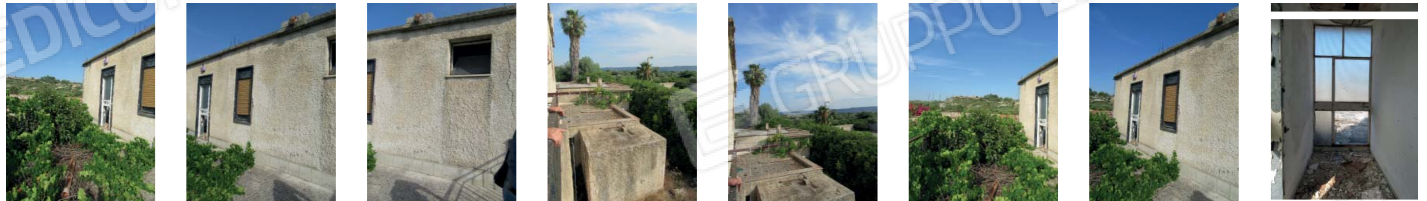
Foto da 127 a 132 - facciata immobile a sud-est