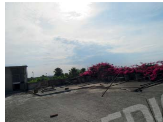
Foto da 217 a 220, terrazzo