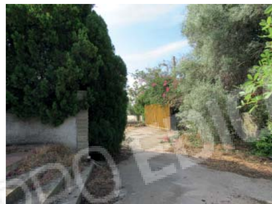
Rilievo fotografico 2 del 06/07/2020

Lotto n. 1 - abitazione a piano primo con terrazzi di pertinenza esclusivi, sito in Floridaia, Contrada Fegotto, facente parte di un insediamento a prevalente destinazione commerciale, composto da una costruzione comprendente due unità immobiliari, edificata su un lotto di terreno esteso catastalmente 57.95are, con ingressi non autonomi da traversa alla SP 74, denominata Strada Scala di Gemmazza, al punto geografico 37°04'20.0"N 15°07'45.1"E e al punto geografico 37°04'21.4"N 15°07'43.7"E censita nel NCEU del Comune di Floridaia (SR) al F. 10 P.lla 248 sub 2. L'area di pertinenza scoperta dell'insediamento è censita nel NCT di Floridaia al F. 10 P.lla 139, qualità seminativo arborato, di 4.924mq.