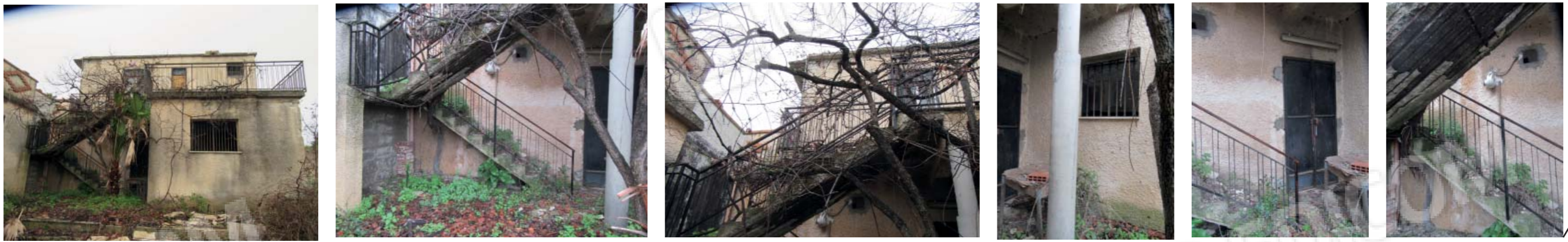
Foto da 29 a 42_ area e scala di accesso al bene