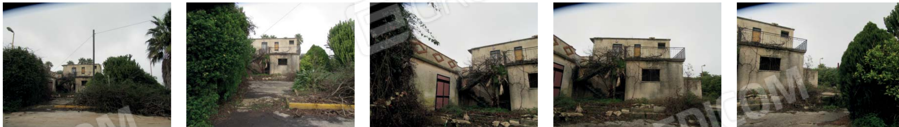
Foto da 1 a 20_ area di accesso al bene