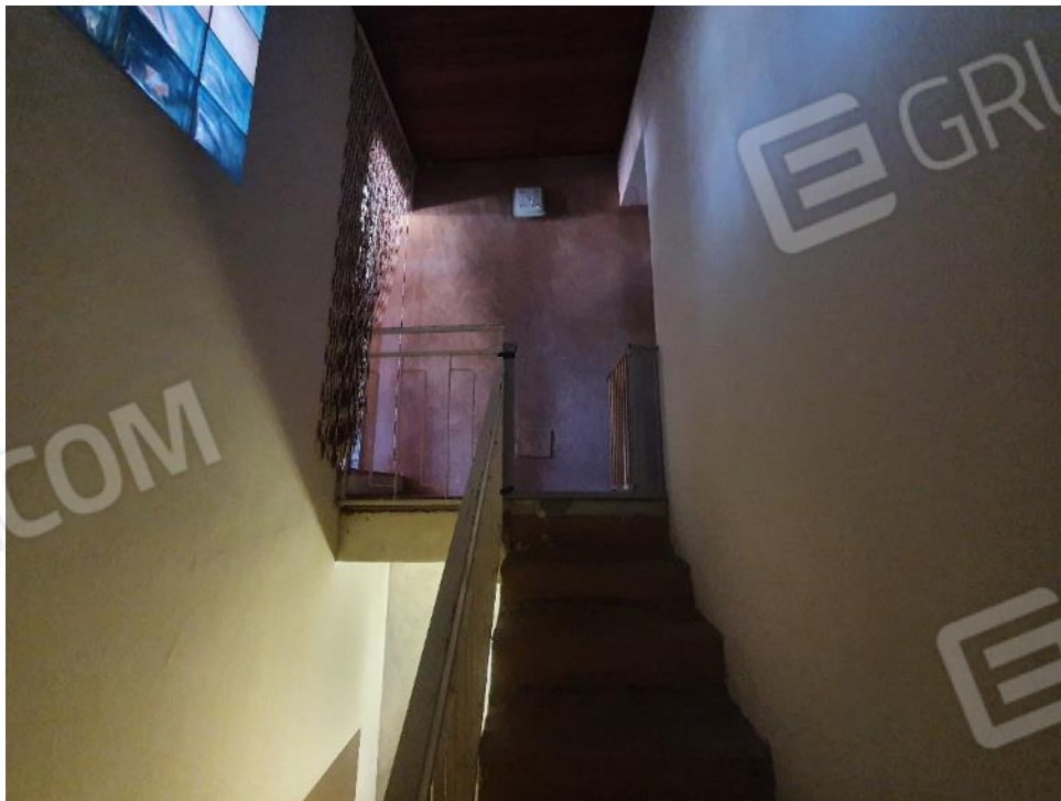
Foto n.10 - Scala