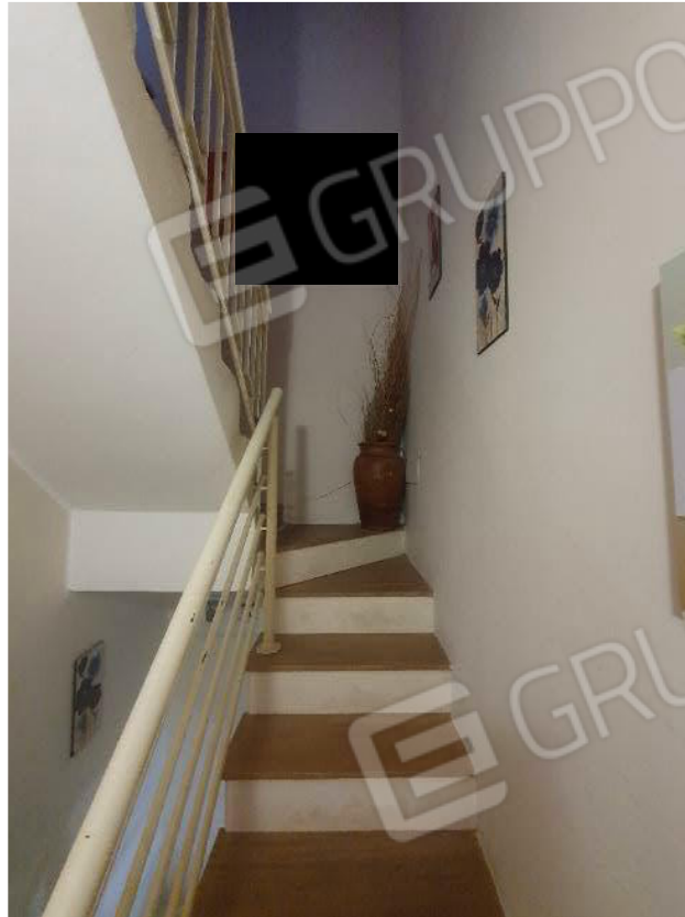
Foto n.9 - Scala