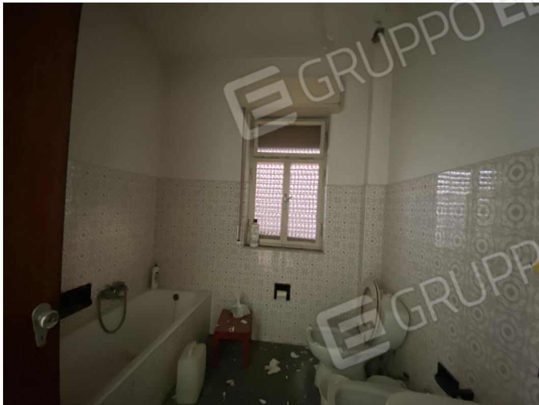
Servizio igienico n.2