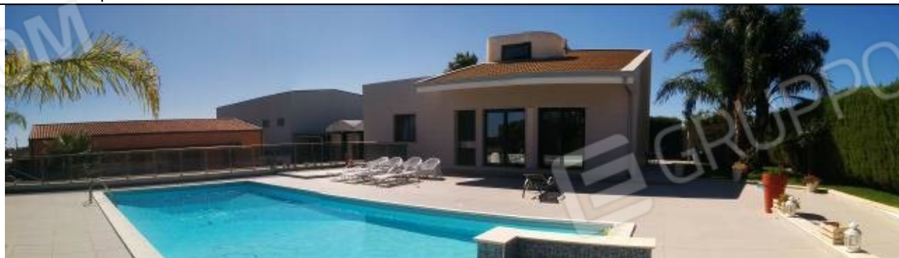
Foto 2 - Esterni