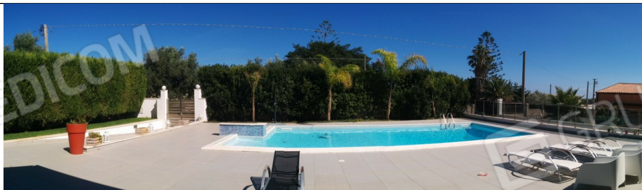
Foto 3 - Esterni