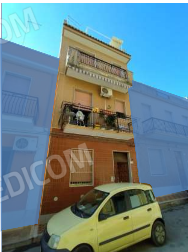
Fot. 14: prospetto su Via Sempione, vista frontale