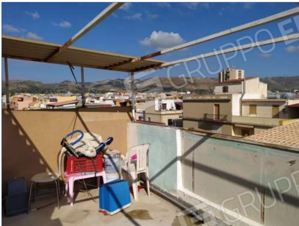
Fot. 9: piano terzo, terrazza esterna