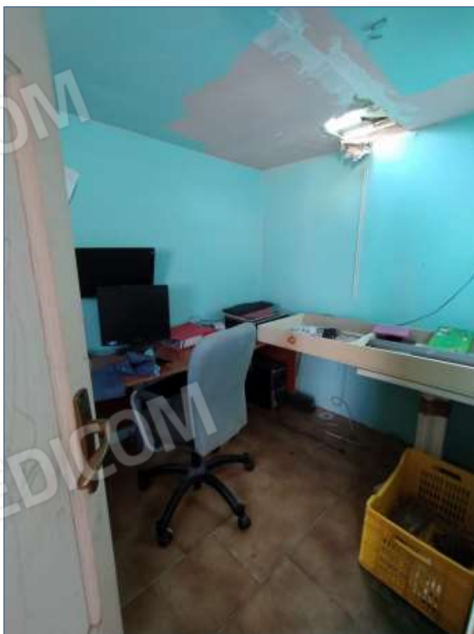
Fot. 8: piano terzo, vano ripostiglio