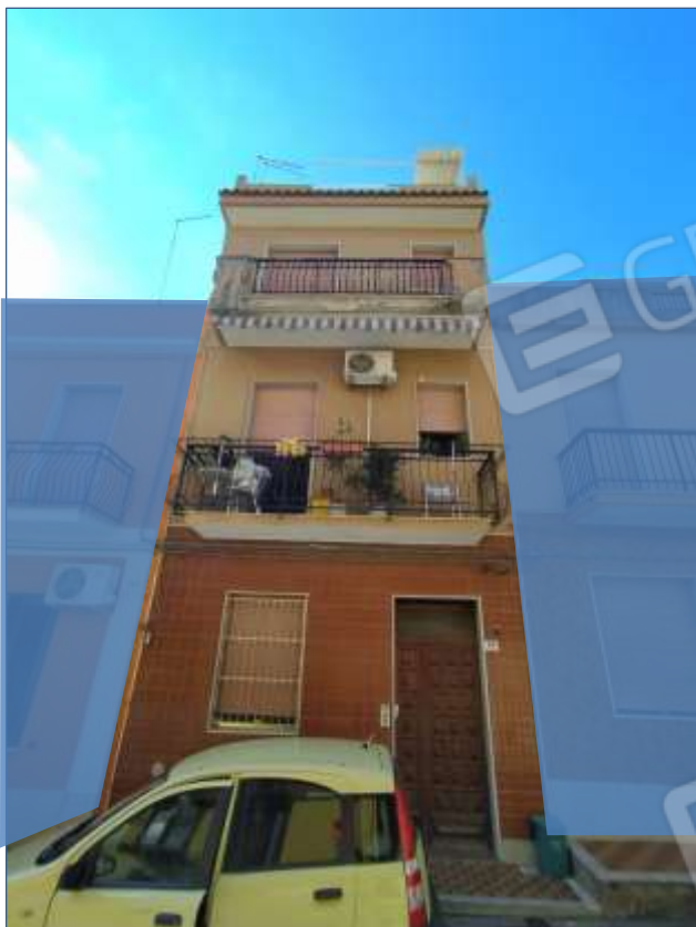
Fot. 13: prospetto su Via Sempione, vista frontale