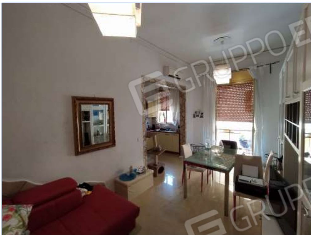
Fot. 3: piano primo, sala da pranzo