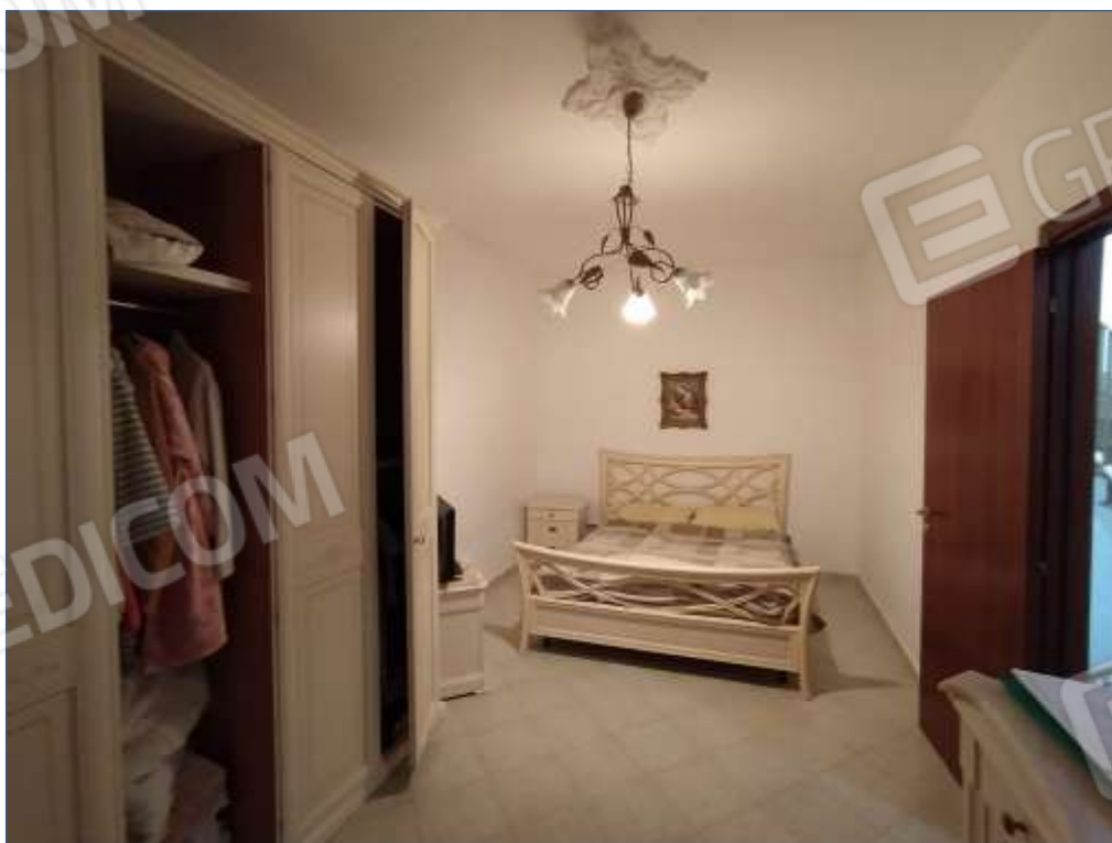
Fot. 6: piano secondo, camera matrimoniale