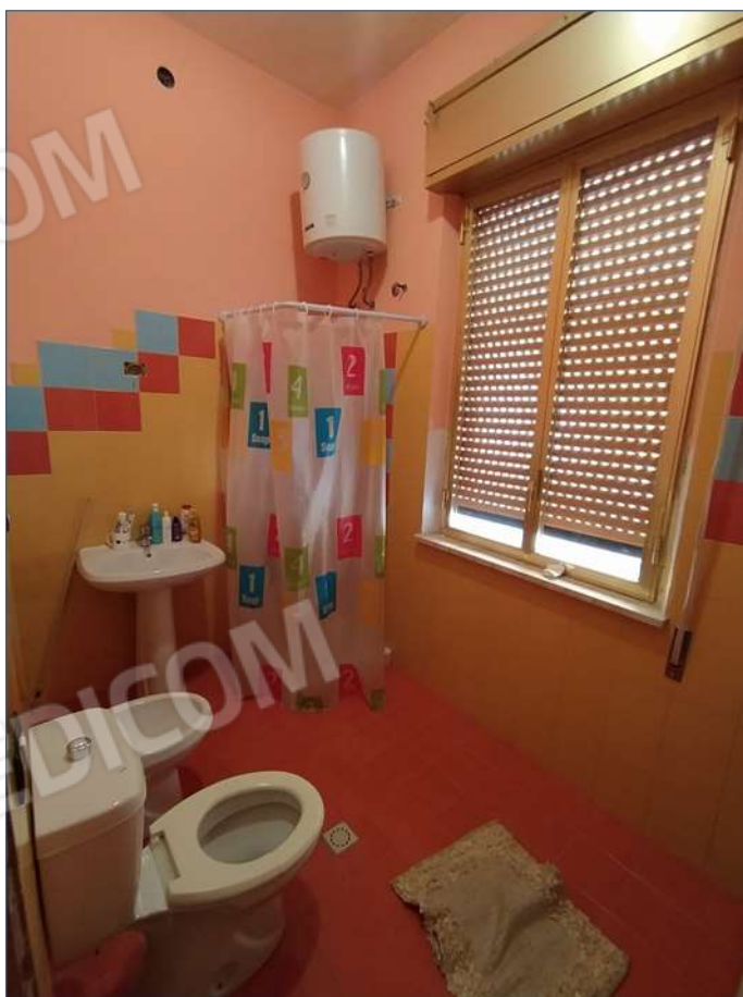
Fot. 2: piano terra, bagno