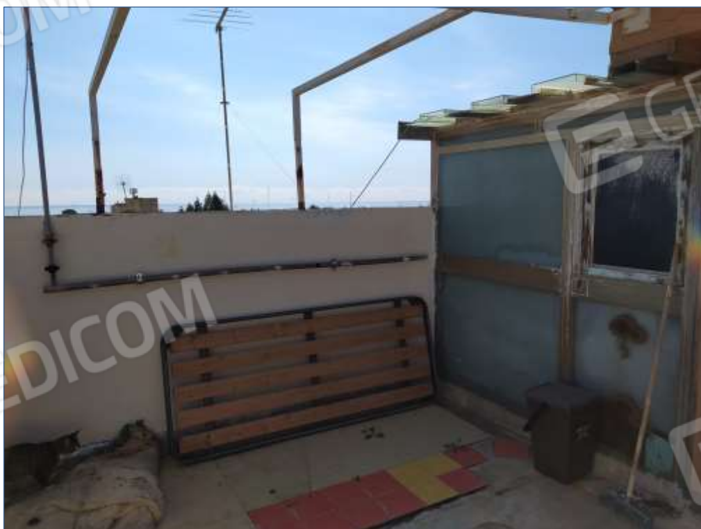
Fot. 10: piano terzo, terrazza esterna