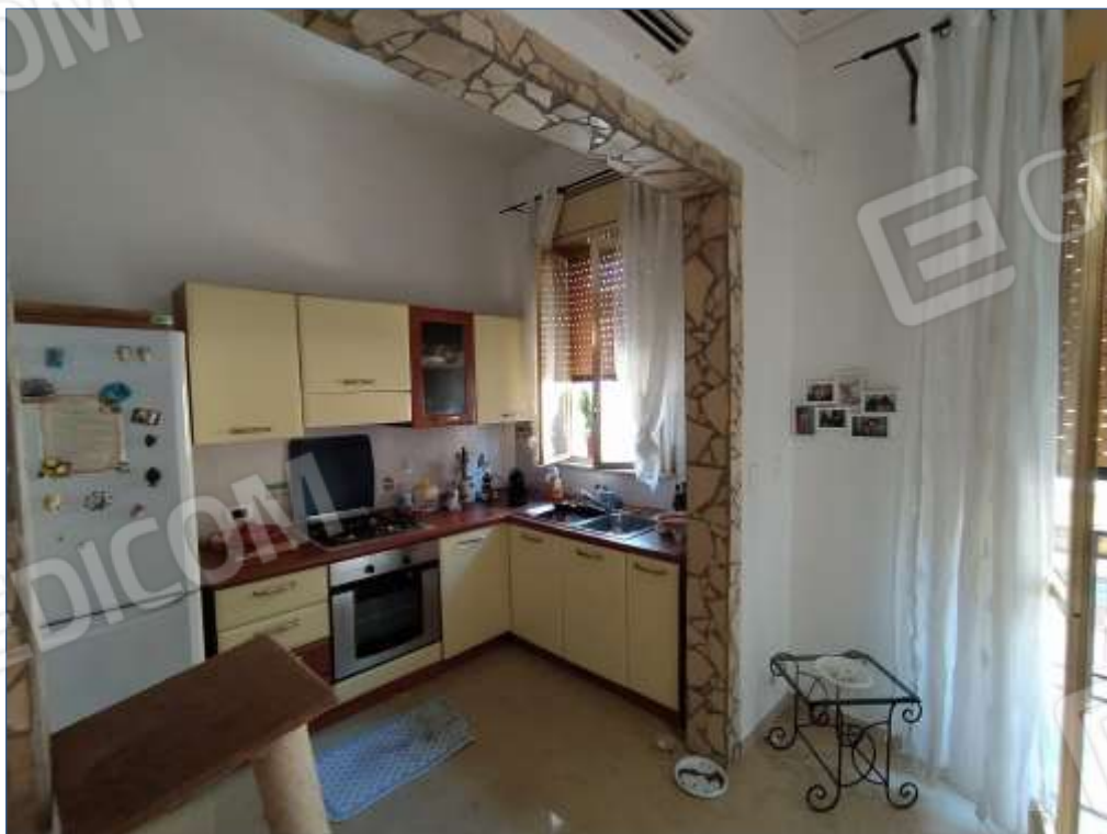
Fot. 4: piano primo, zona cottura