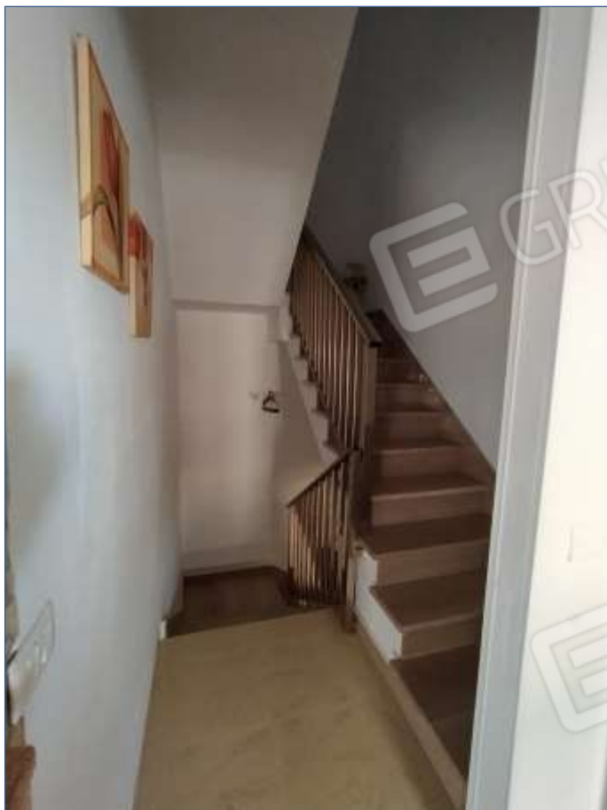
Fot. 5: rampa scale piano primo-piano secondo