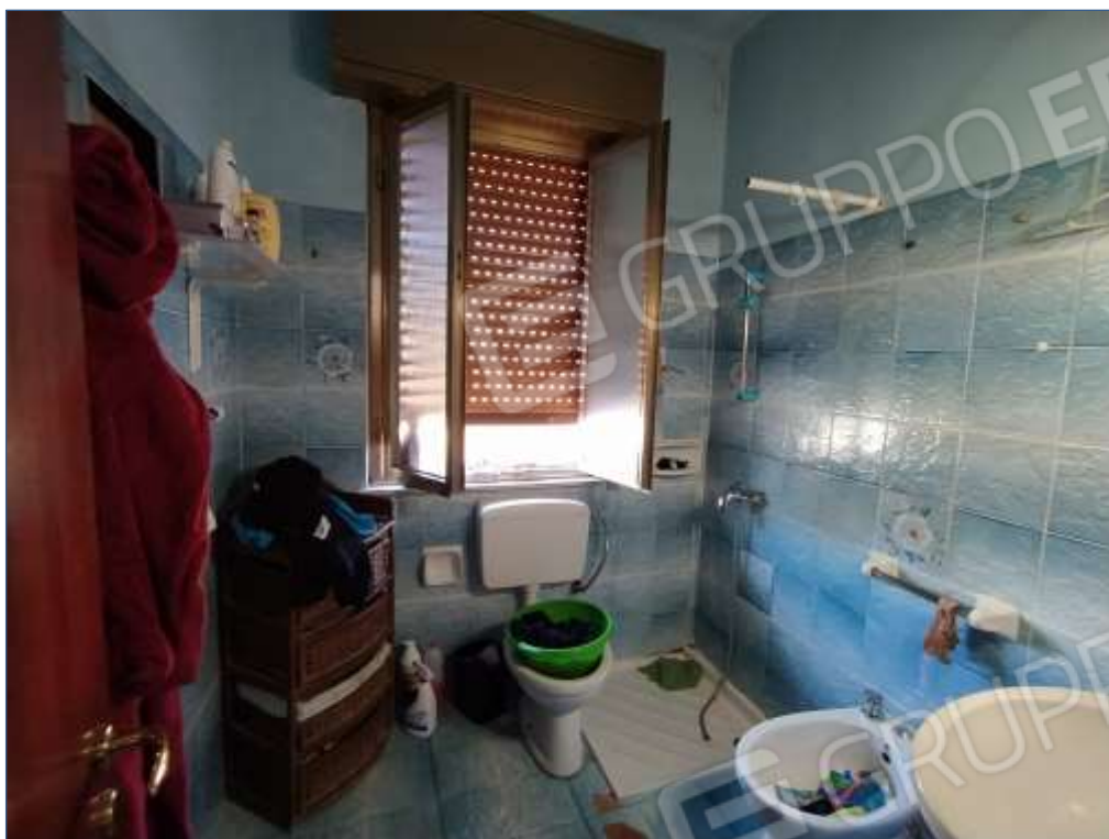
Fot. 7: piano secondo, bagno