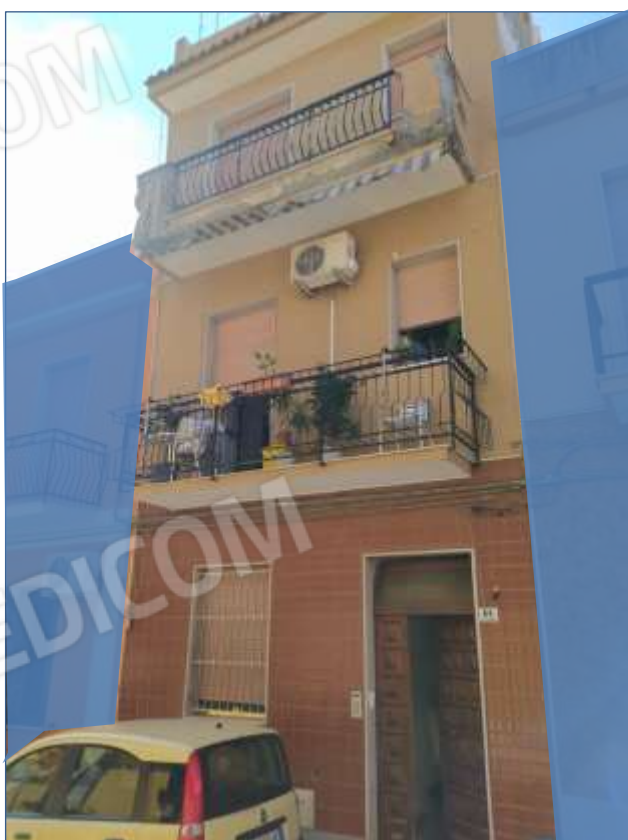
Fot. 12: prospetto su Via Sempione, vista da nord-ovest