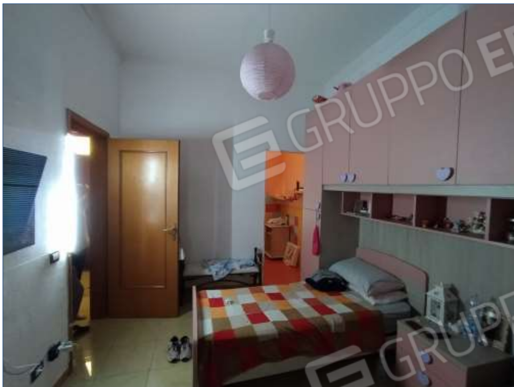
Fot. 1: piano terra, camera da letto singola