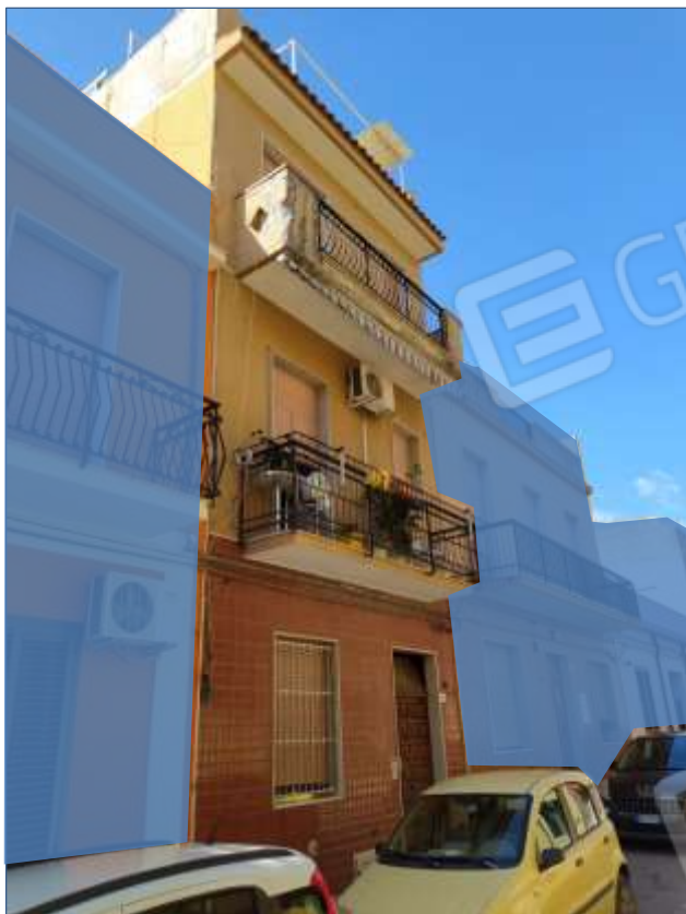
Fot. 11: prospetto su Via Sempione, vista da nord-est