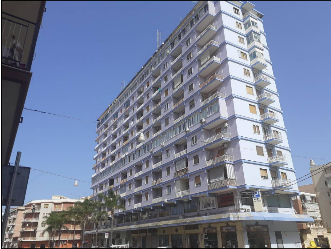
Foto 1: Vista dello stabile nel quale si inserisce l'immobile oggetto della presente procedura