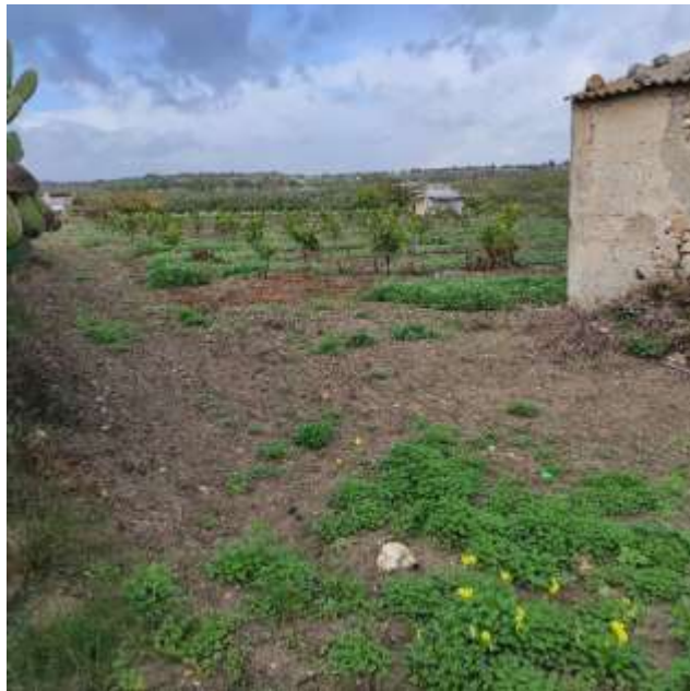
LOTTO 1 FABBRICATO E PARTE DI AGRUMETO FOGLIO 341