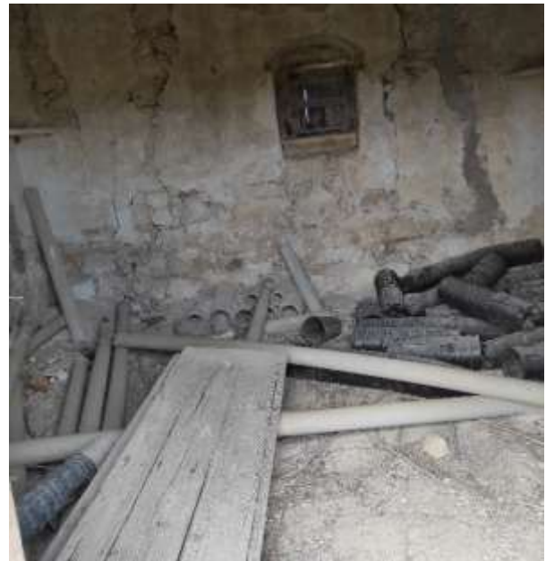
LOTTO 1 INTERNO FABBRICATO FOGLIO 341