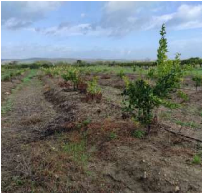
LOTTO 1 VEDUTA AGRUMETO FOGLIO 341