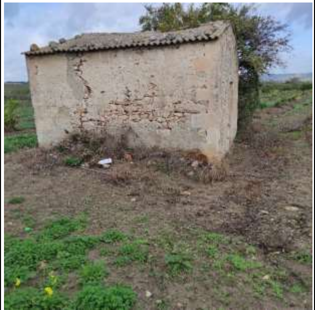
LOTTO 1 FABBRICATO FOGLIO 341