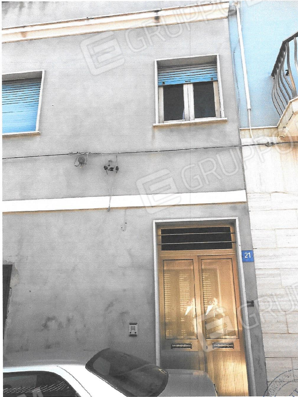
Foto 2 esterno portone