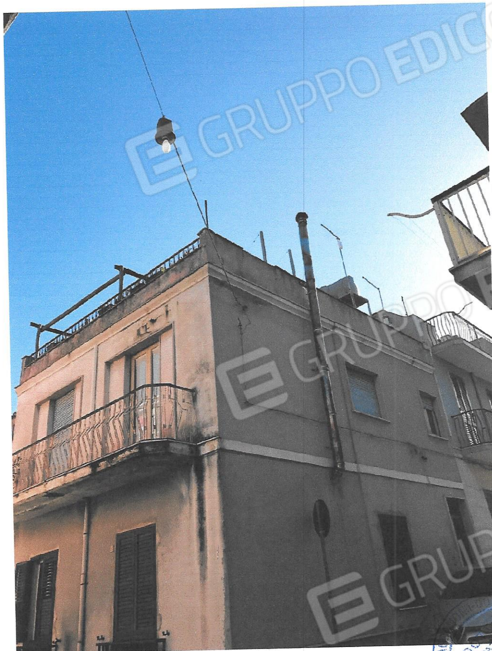
Foto 3 Angolo via M. Mallia e Via La Marmora