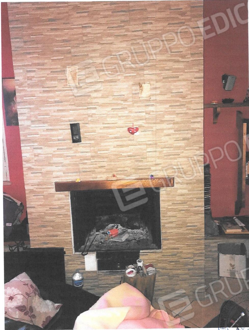
Foto 7 termocamino piano T