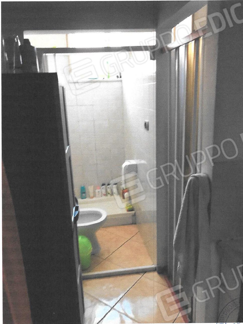
Foto 6 WC piano T

ARUBA P.E.C. S.P.A. - VIA S. PIETRO 10 - 20121 MILANO - ITALIA Firma