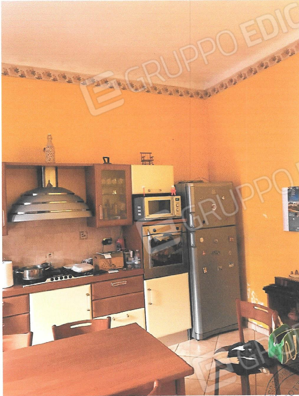
Foto 5 cucina piano T