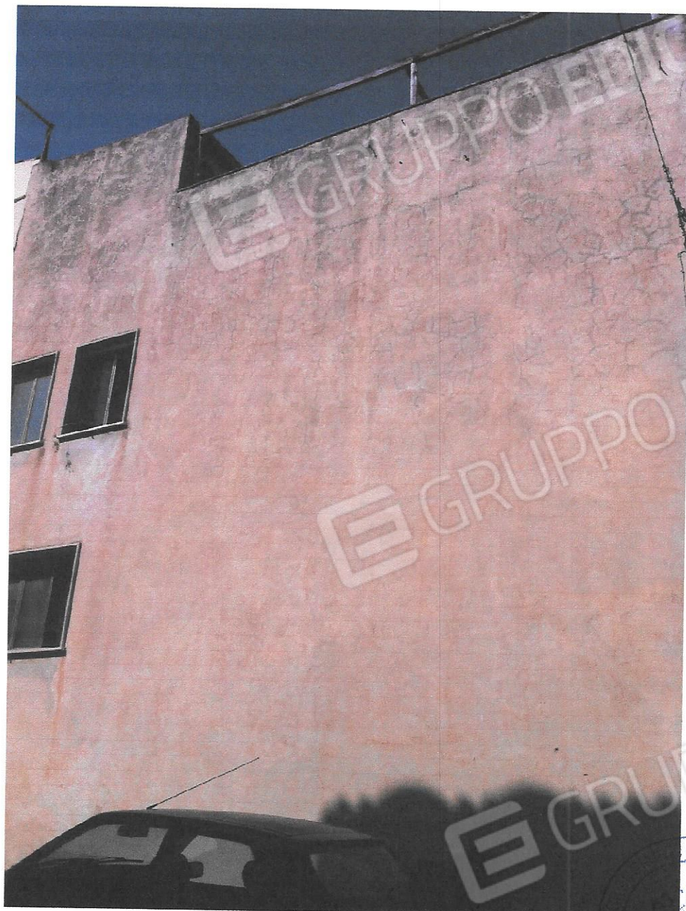
Foto 4 retro esterno

Stampa circolare con firma e testo illeggibile.