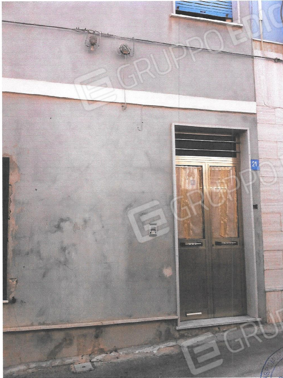
Foto 1 esterno