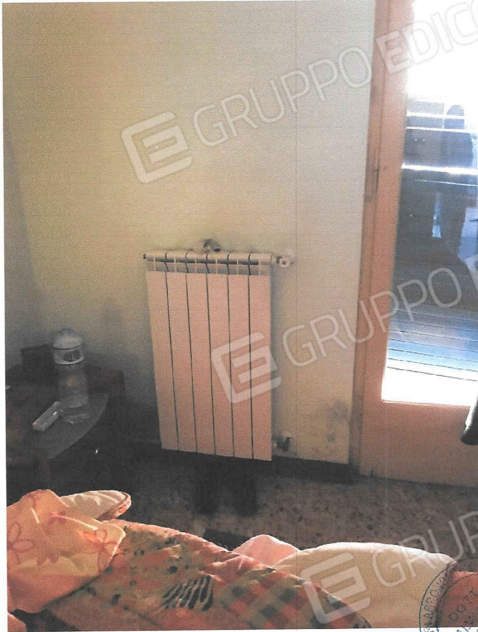
Foto 9 camera