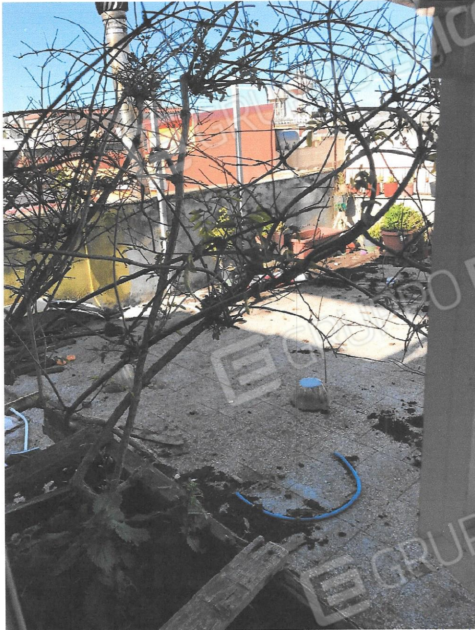
Foto 12 terrazzo