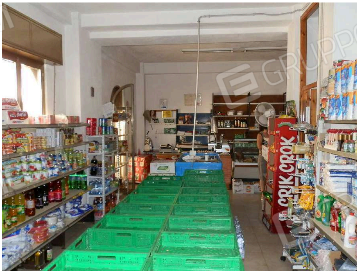
LOCALE COMMERCIALE "J 1 "