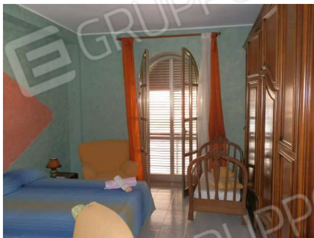
CAMERA DA LETTO "X 9 "