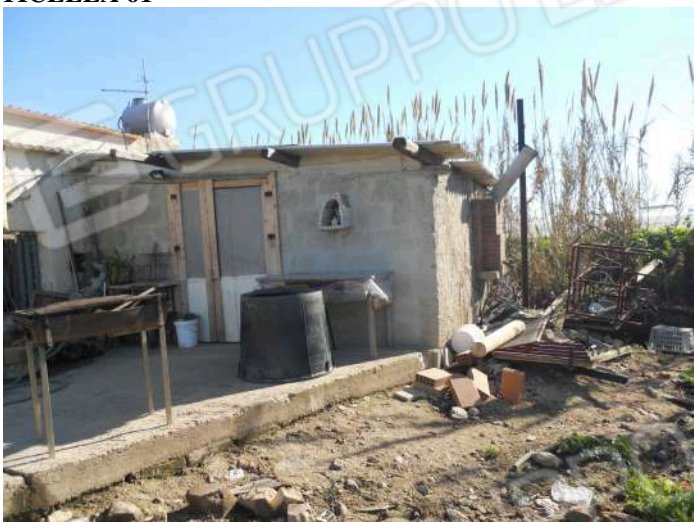
IMMOBILE IDENTIFICATO CON P.LLA 406 E POZZO