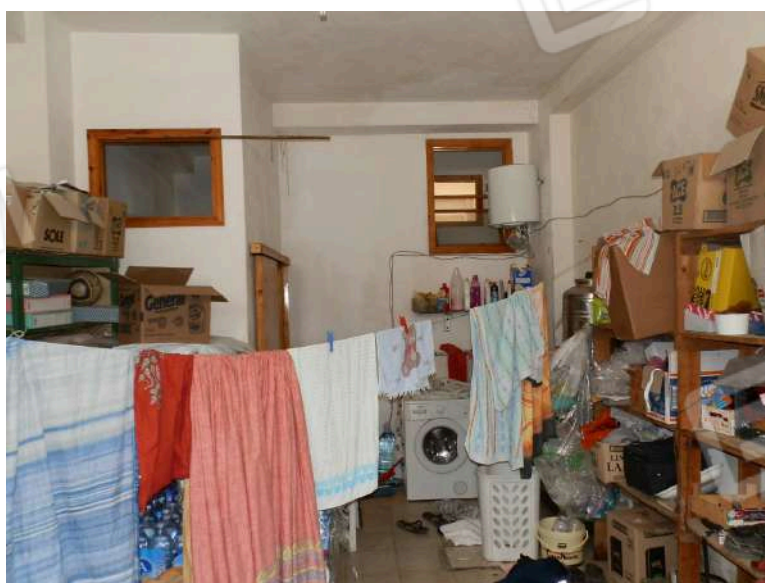
INTERNO GARAGE "Y 1 "