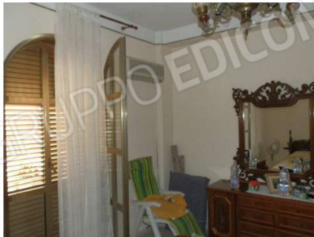
CAMERA DA LETTO "X 1 "