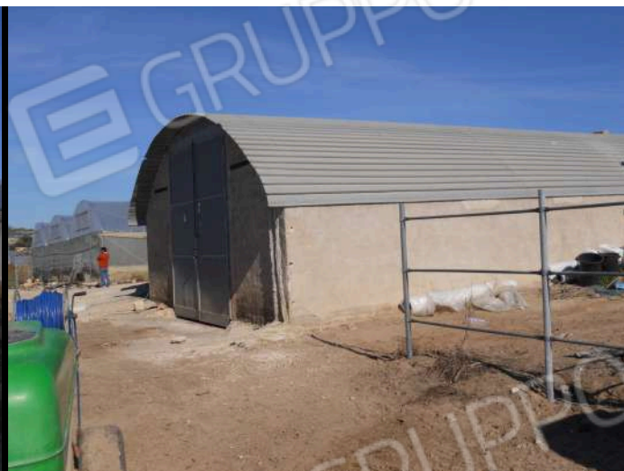
IMMOBILE IDENTIFICATO CON LA P.LLA 405 SUB 2