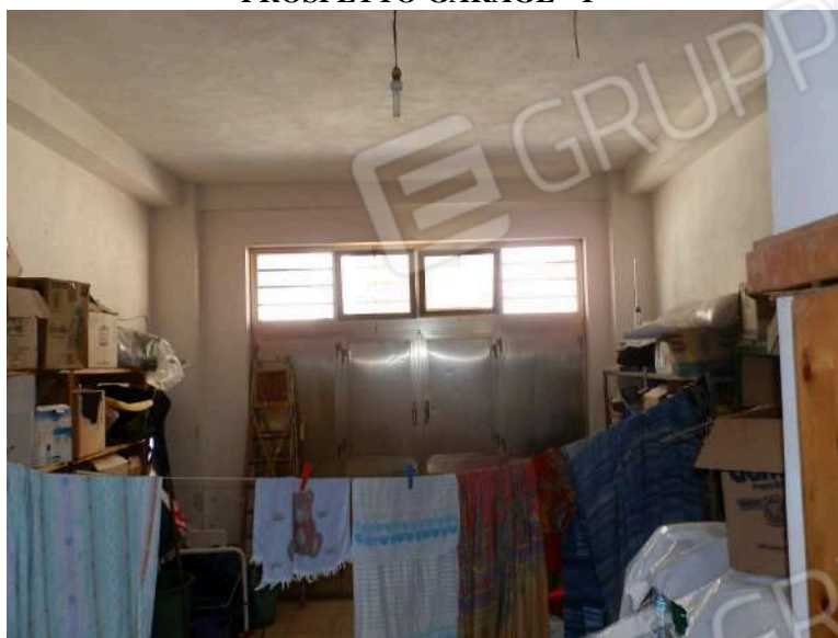
INTERNO GARAGE "Y 1 "