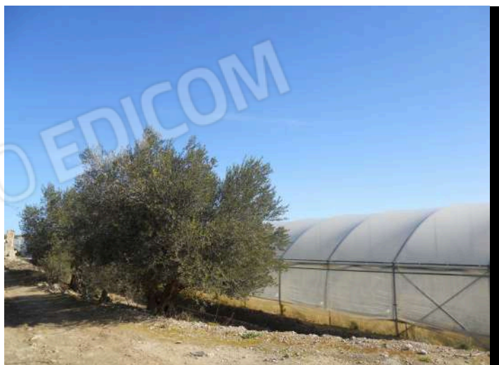
PARTICELLA 407 CONFINE OVEST