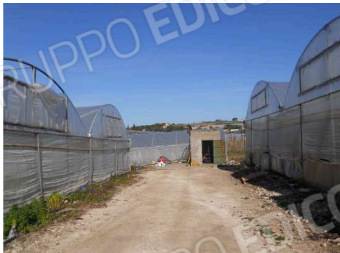
SERRE PRESENTI NELLA P.LLA 191 CON POZZO