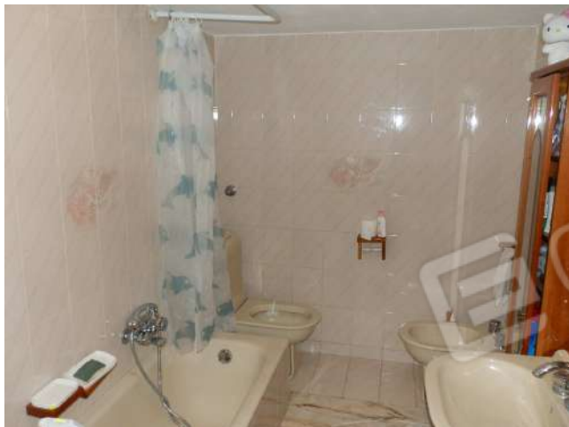
BAGNO "X 3 "