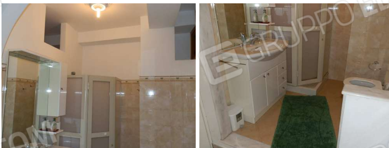
BAGNO "X 5 "