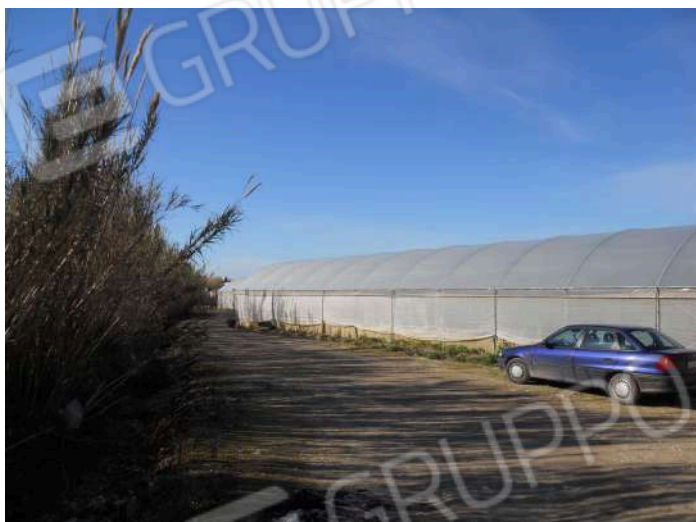
CONFINE TRA LA P.LLA 404 E LA 233