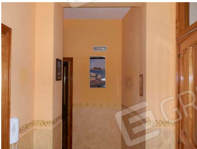
CORRIDOIO "X 4 "