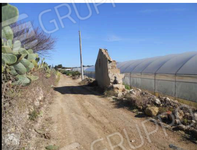
CONFINE OVEST DELLA P.LLA 42