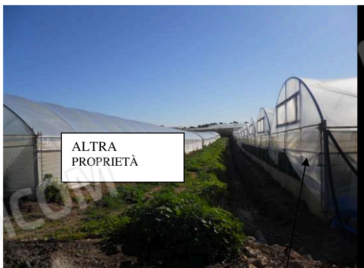
CONFINE NORD DELLE P.LLE 42-43 (SOLCO)