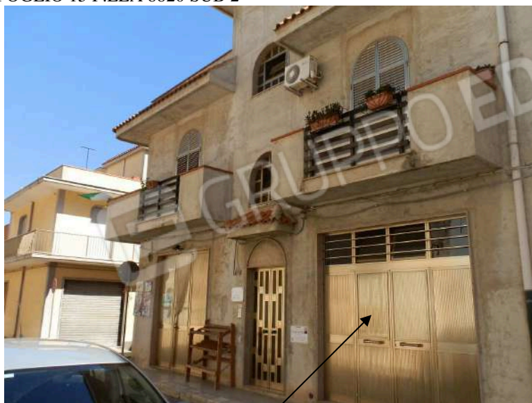
PROSPETTO GARAGE "Y"

ALLEGATO FOTOGRAFICO IMMOBILE "J" SITO IN PACHINO, VIA CARACCIOLO N 5, CENSITO AL N.C.E.U. DEL COMUNE DI PACHINO AL FOGLIO 15 P.LLA 8820 SUB 2