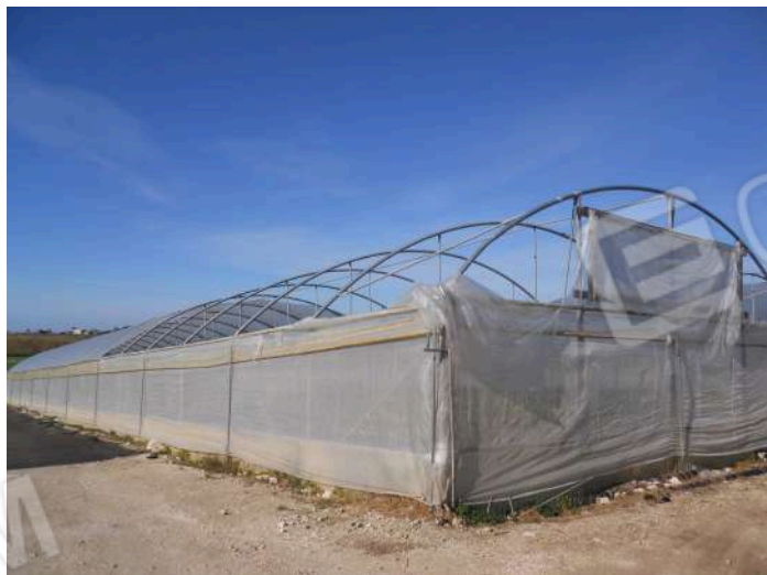
SERRE PRESENTI IN PARTE DELLA P.LLA 404