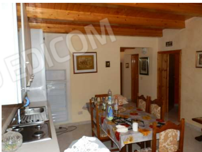
CUCINA "XX 2 "