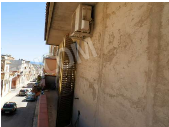
BALCONE "X 10 "