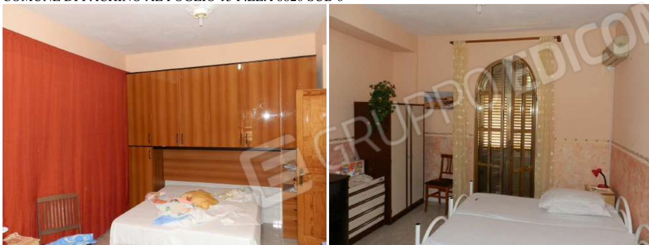
CAMERA DA LETTO "X 8 "

ALLEGATO FOTOGRAFICO IMMOBILE "X" SITO IN PACHINO, VIA CARACCIOLO, CENSITO AL N.C.E.U. DEL COMUNE DI PACHINO AL FOGLIO 15 P.LLA 8820 SUB 6