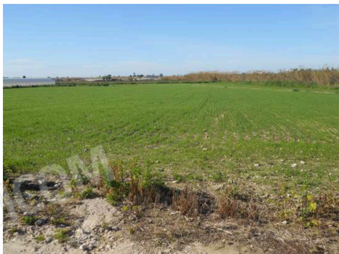
PORTE DELLA PARTICELLA 404 COLTIVATA CON GRANO