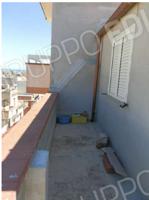
TERRAZZO "XX 7 "