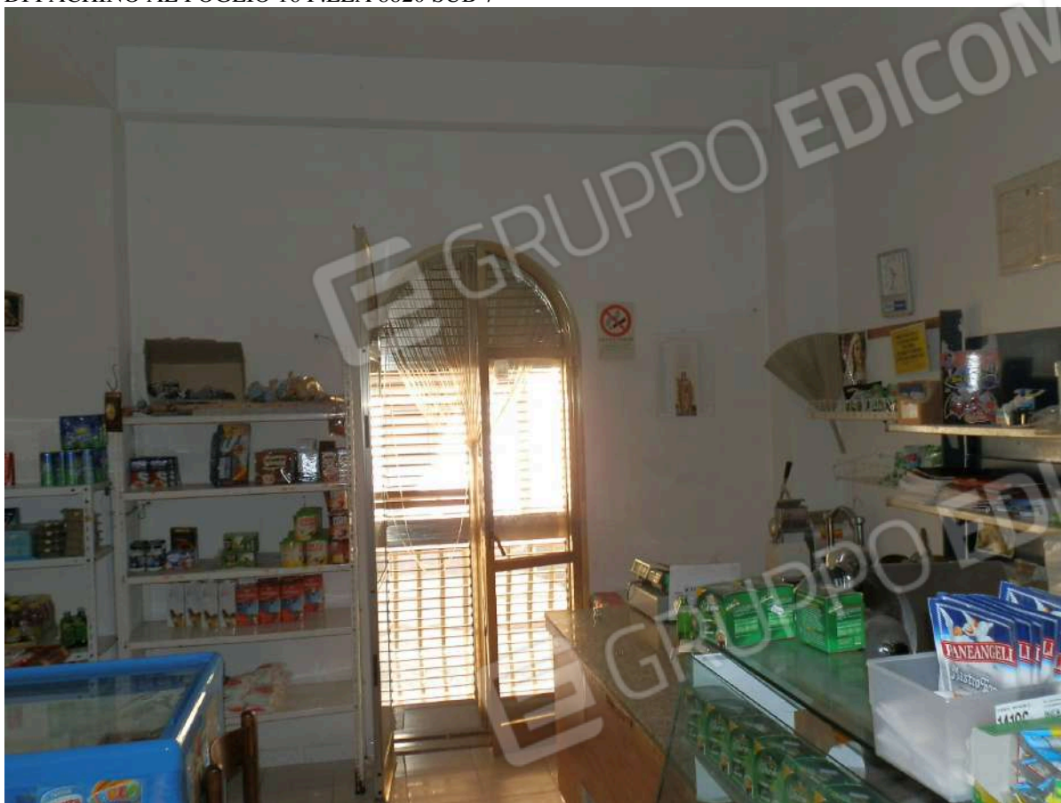
LOCALE COMMERCIALE "J 1 "

ALLEGATO FOTOGRAFICO IMMOBILE "J" SITO IN PACHINO, VIA CARACCIOLO N 5, CENSITO AL N.C.E.U. DEL COMUNE DI PACHINO AL FOGLIO 16 P.LLA 8820 SUB 7