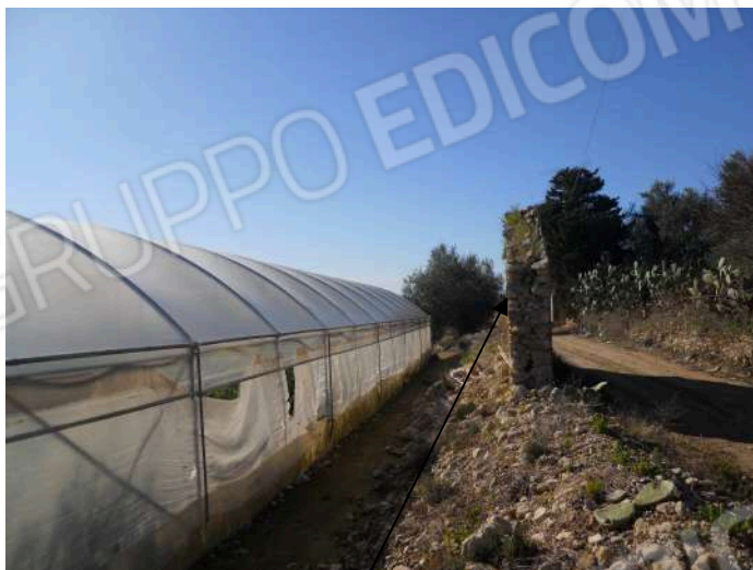
P.LLE 42 E 232 (FAB. RURALE RIMASTO SOLO UNA PARETE)