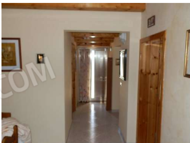
CORRIDOIO "XX 1 "