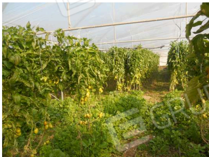
PARTICOLARE INTERNO SERRE COLTIVATE AD ORTAGGI