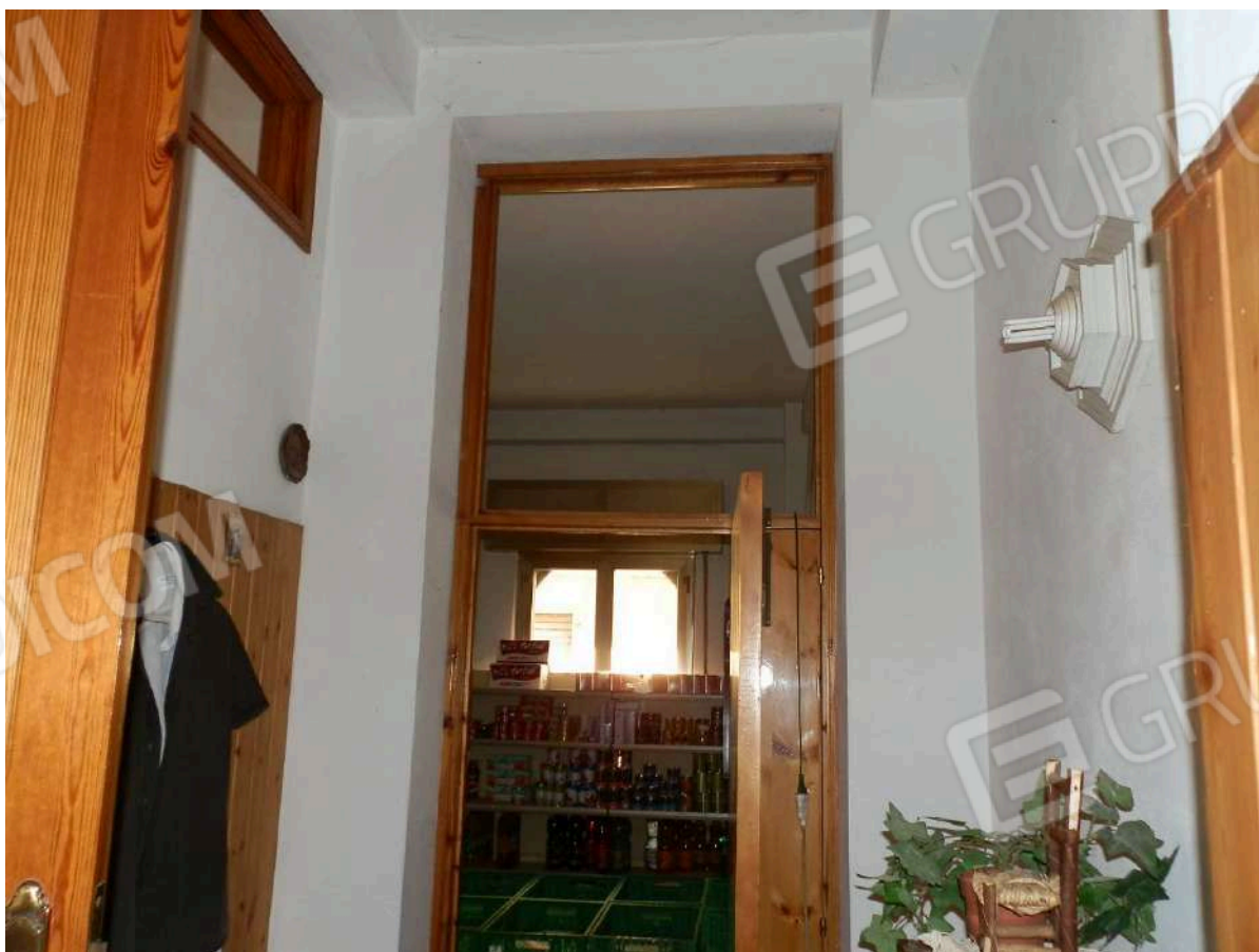
CORRIDOIO "J 2 "