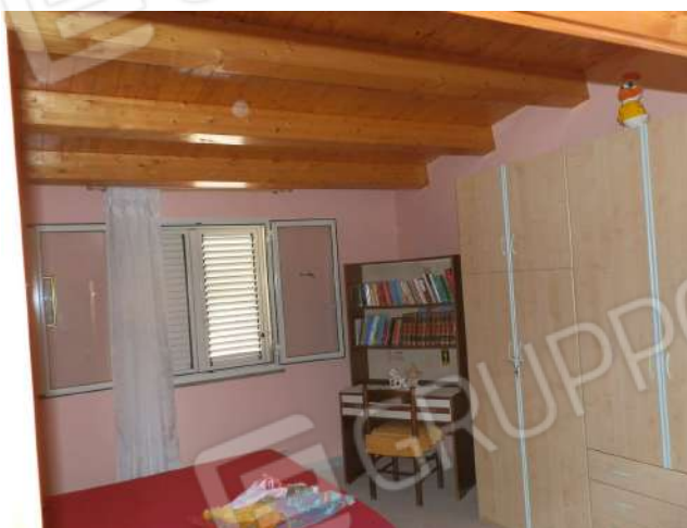
CAMERA DA LETTO "XX 3 "