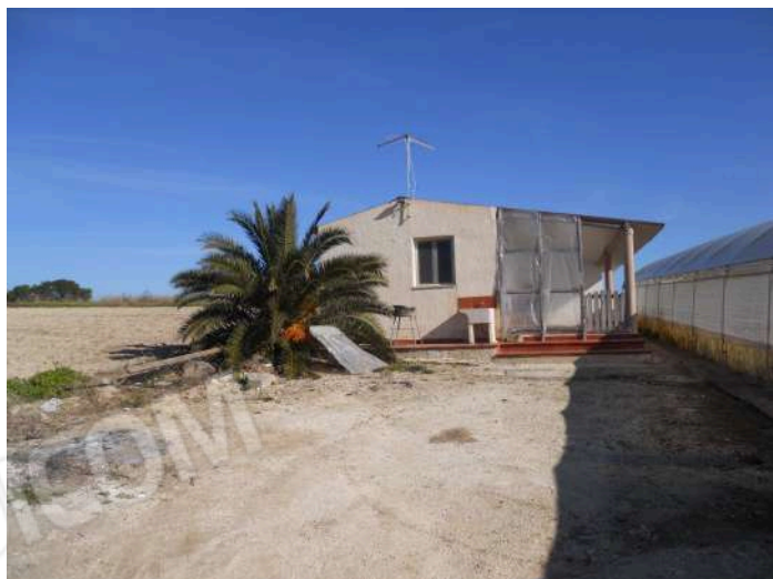
IMMOBILE PRESENTE NELLA PARTICELLA 60