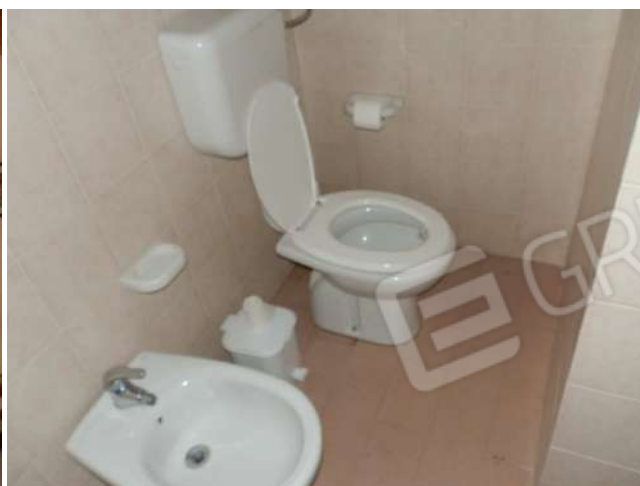
BAGNO "XX 4 "