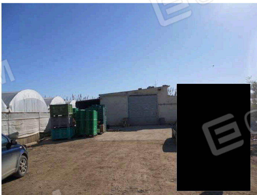
IMMOBILE IDENTIFICATO CON P.LLA 406