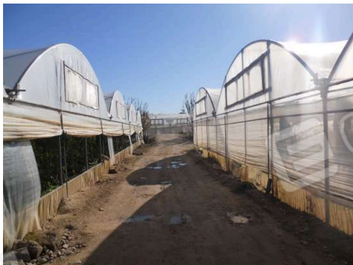
PARTE DELLE PARTICELLE 233-43