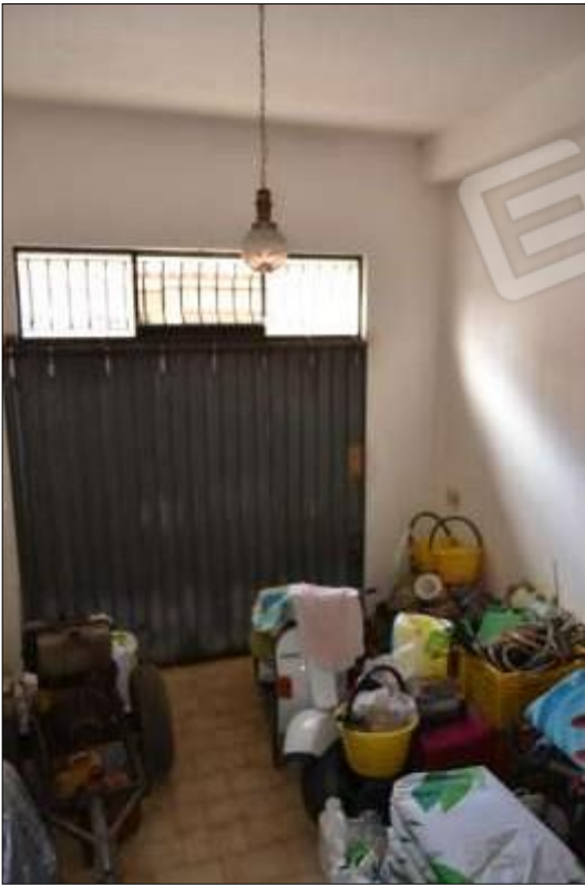
Fot. 1: garage, interno