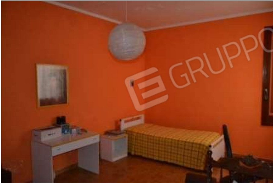
Fot. 7: camera da letto, p.1°