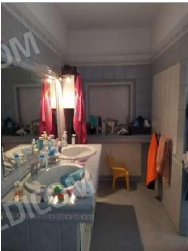
Fot. 8: bagno, piano 1°