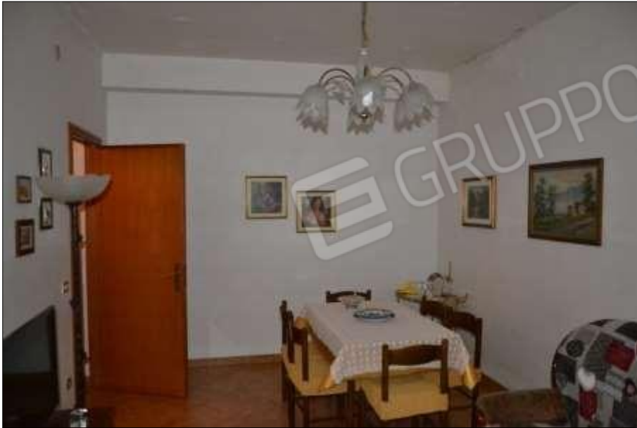
Fot. 5: sala da pranzo, p.t.