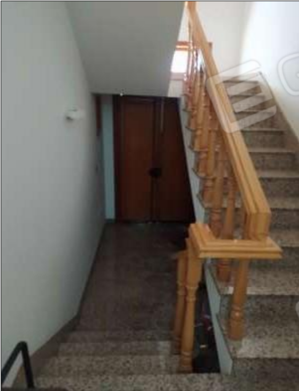
Fot. 1: ingresso e vano scala