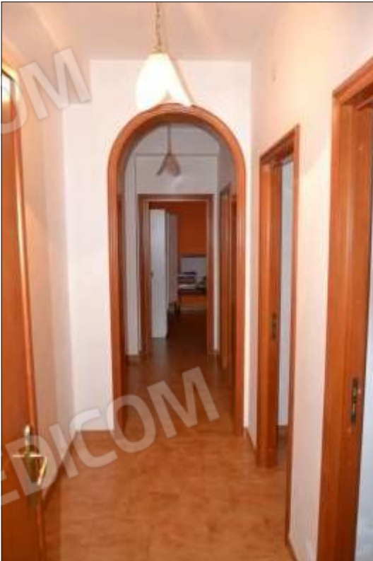
Fot. 6: corridoio piano 1°