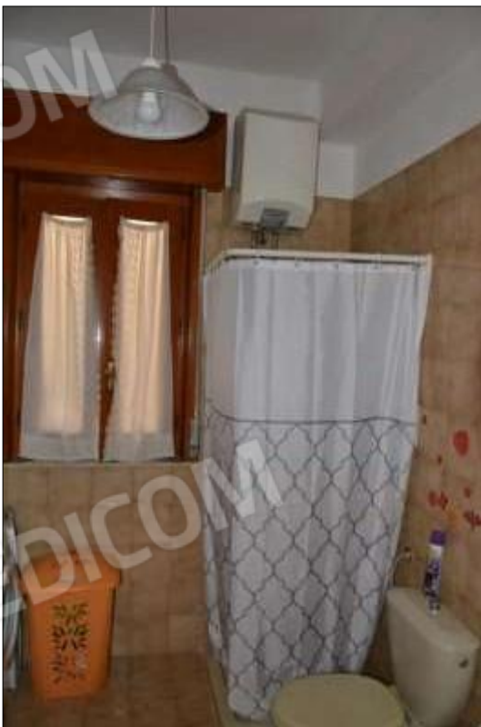
Fot. 4: bagno, p.t.