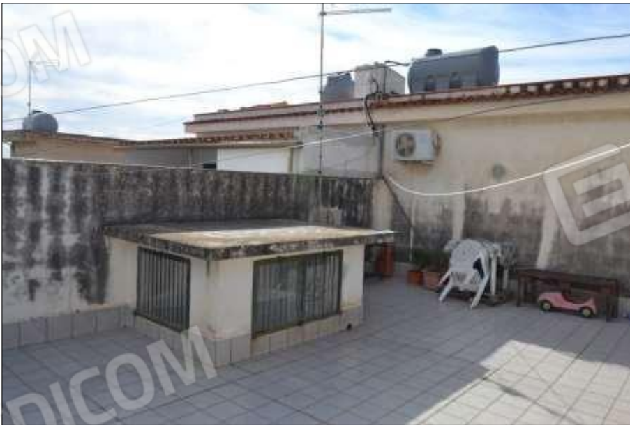
Fot. 14: terrazzo piano 2°