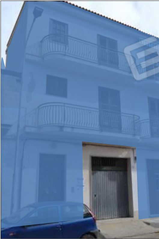
Fot. 3: prospetto, particolare