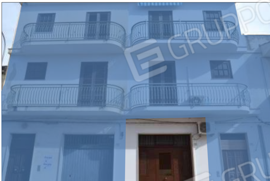
Fot. 1: prospetto principale