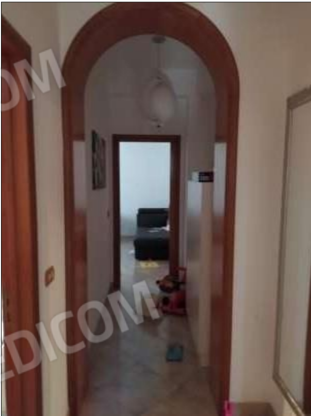
Fot. 6: corridoio piano 1°