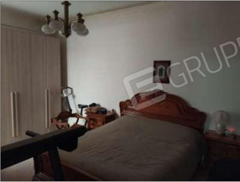
Fot. 5: camera matrimoniale, p.t.