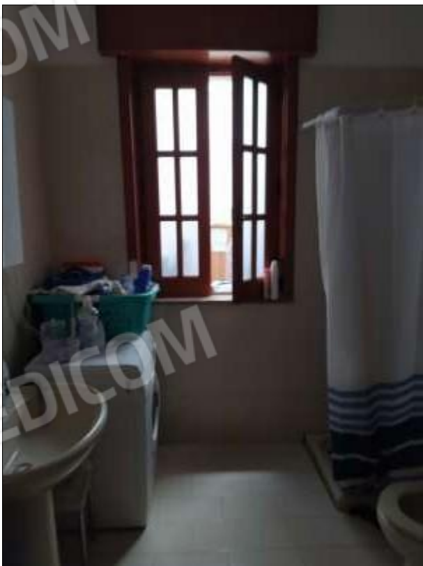
Fot. 4: bagno, p.t.