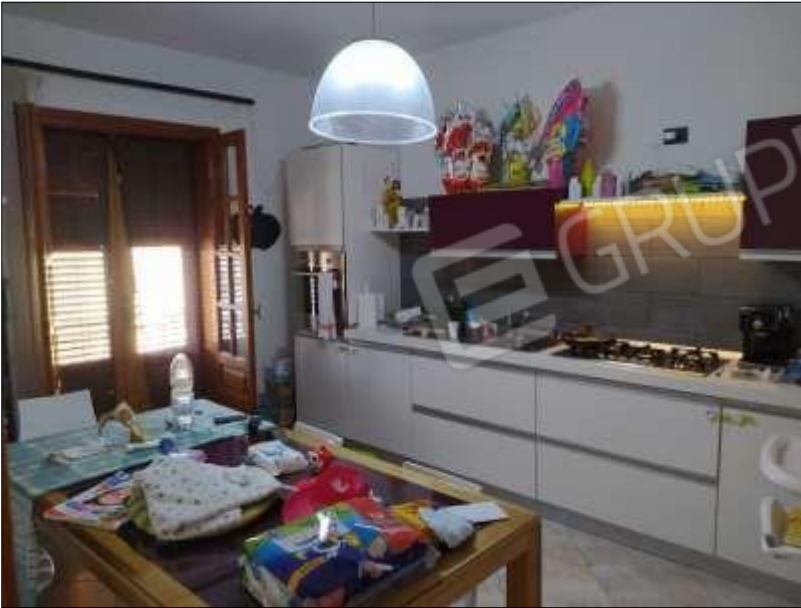
Fot. 11: cucina, piano 2°