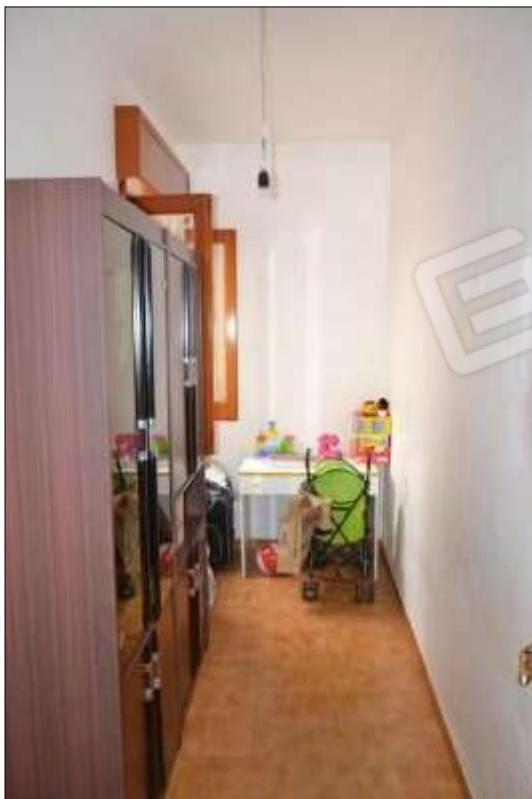
Fot. 9: piccola stanza stretta e lunga, piano 1°