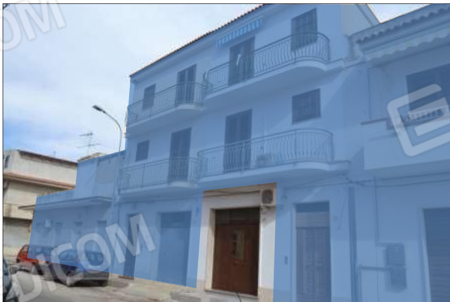
Fot. 2: prospetto principale