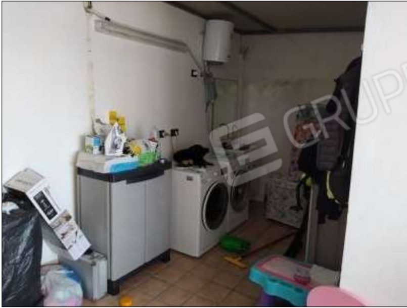
Fot. 13: vano ricavato per chiusura parziale dell'originaria terrazza, piano 2°