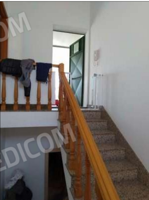
Fot. 10: rampa scale che conduce al piano 2°