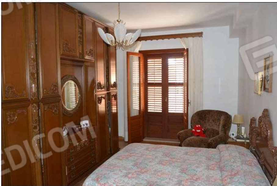
Fot. 10: camera da letto matrimoniale, piano 1°