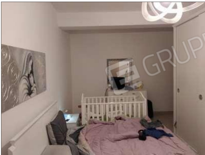
Fot. 7: camera da letto, p.1°