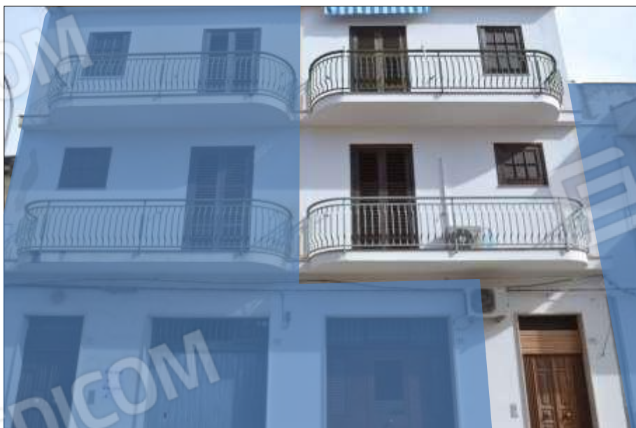
Fot. 16: prospetto principale, particolare