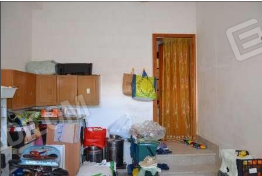
Fot. 2: garage, interno