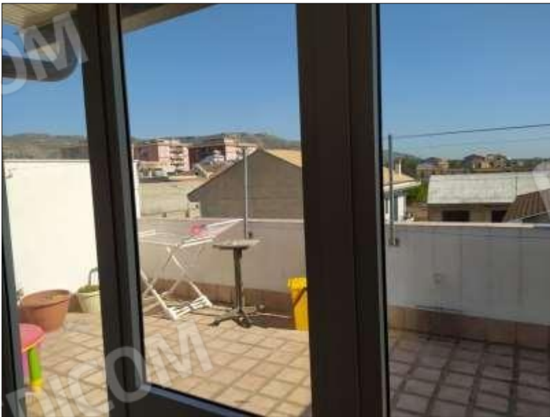
Fot. 14: terrazzo piano 2°