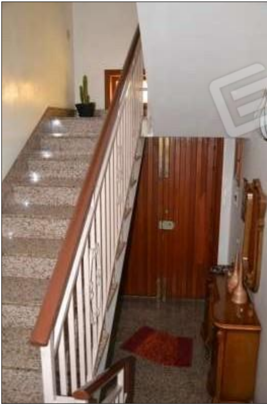
Fot. 1: ingresso e vano scala