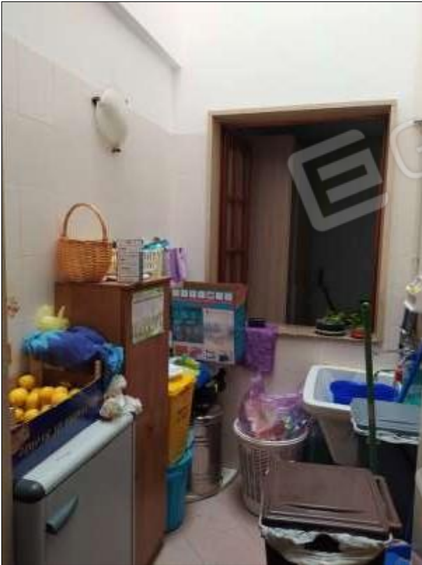
Fot. 3: pozzo luce-lavanderia , p.t.