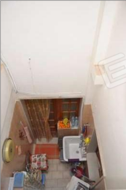
Fot. 3: pozzo luce-lavanderia al p.t., vista dal piano 1°