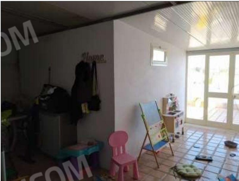
Fot. 12: vano ricavato per chiusura parziale dell'originaria terrazza, piano 2°