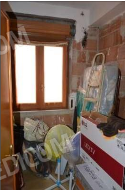
Fot. 8: vano ripostiglio, piano 1°