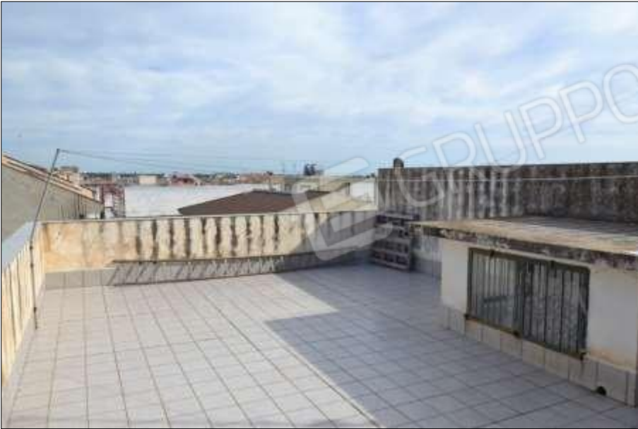
Fot. 13: terrazzo piano 2°