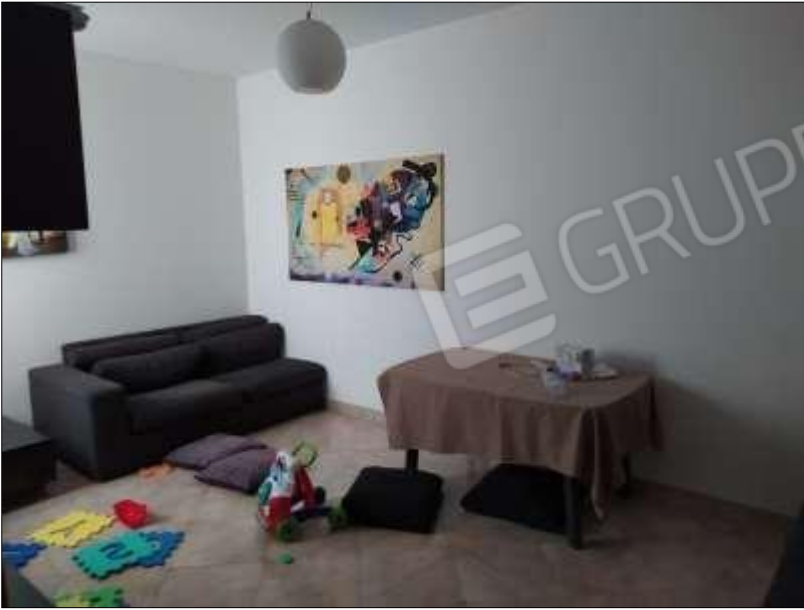
Fot. 9: soggiorno, piano 1°