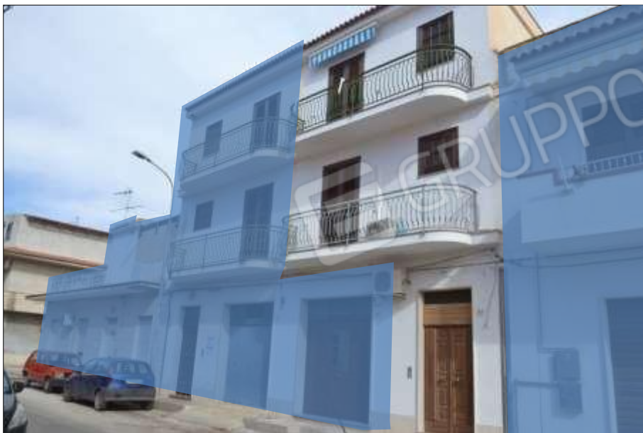
Fot. 15: prospetto principale