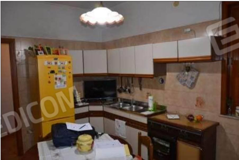
Fot. 2: cucina, p.t.