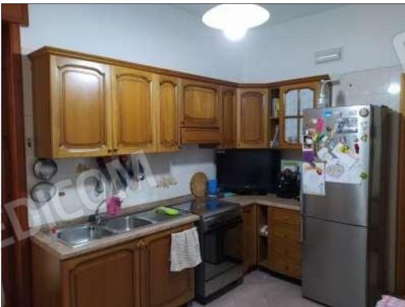
Fot. 2: cucina, p.t.