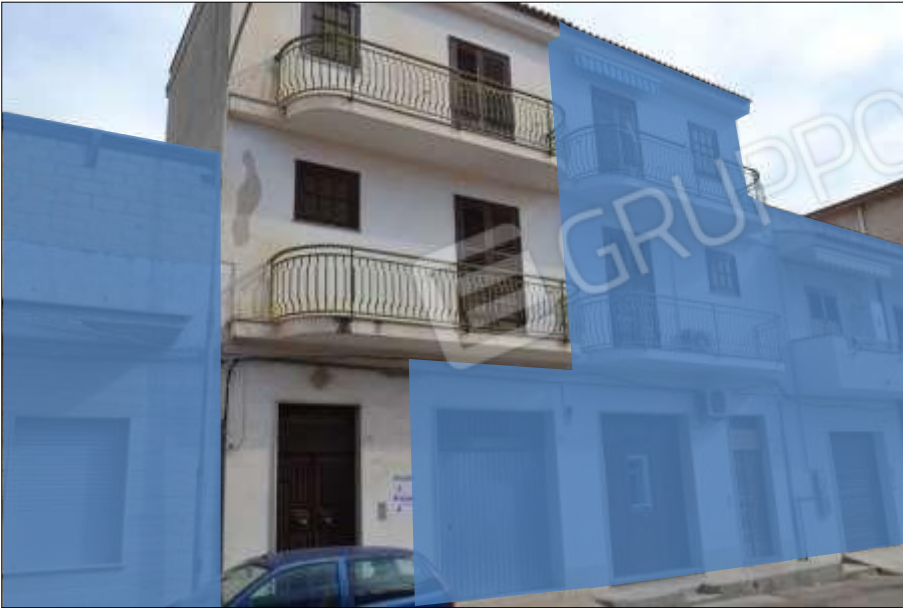
Fot. 15: prospetto principale