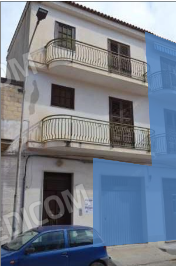
Fot. 16: prospetto principale, particolare