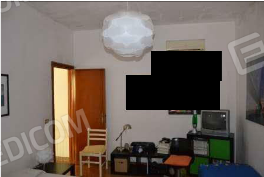
Fot. 12: camera piano 2°