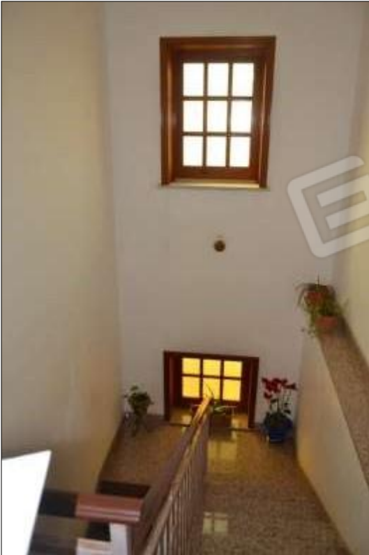
Fot. 11: rampa scale che conduce al piano 2°