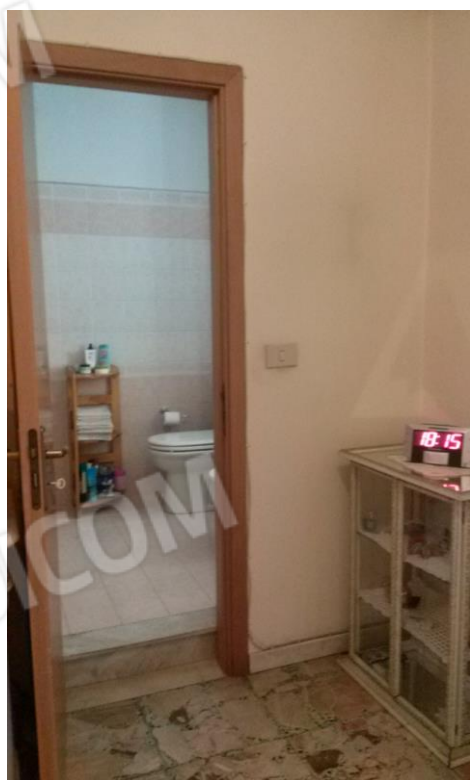
foto 9 – bagno al piano primo con accesso dalla camera matrimoniale