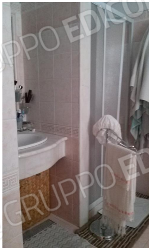
foto 8 – bagno al piano primo con accesso dalla camera matrimoniale