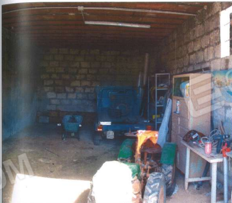
Interno garage, Lotto A e B.