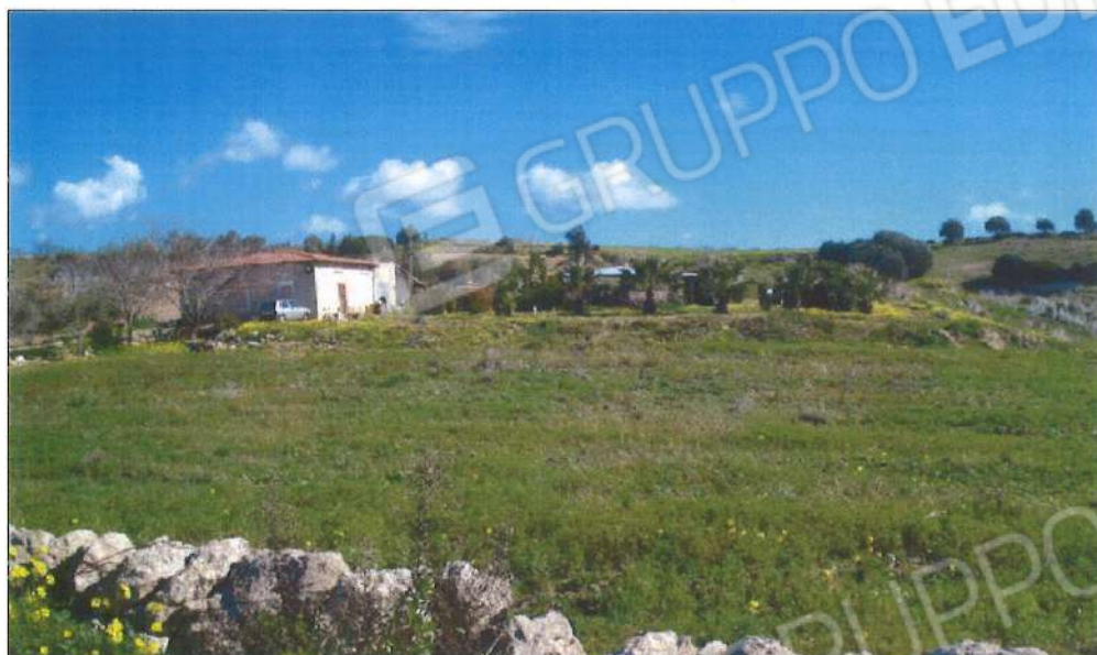
Panoramica Lotto A e B.