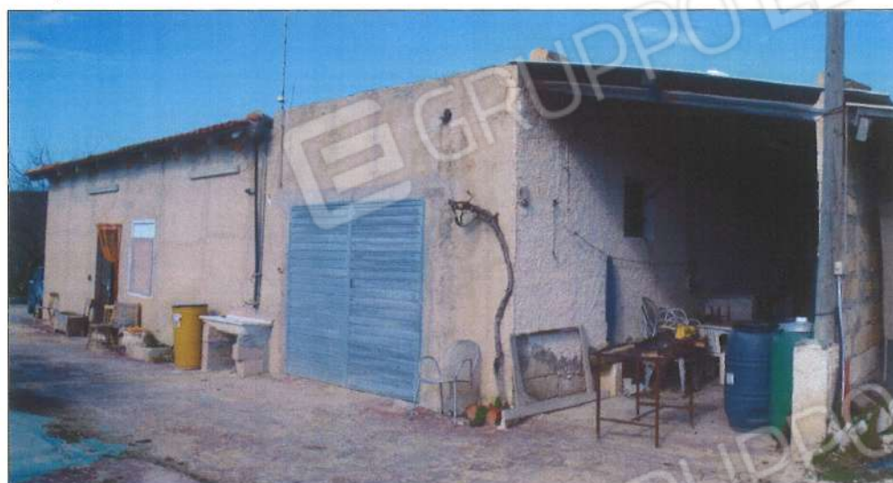
Prospetto sud-est fabbricato.