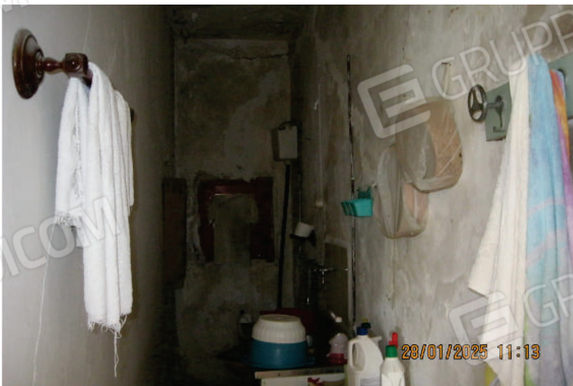
Foto 10: il corridoietto presente all'interno del magazzino con installato un wc ed un lavandino