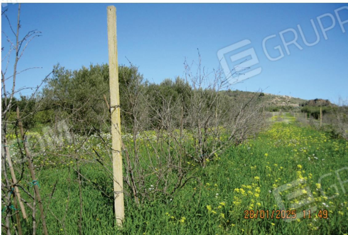
Foto 20: altra rappresentazione fotografica dell'impianto arboreo morto