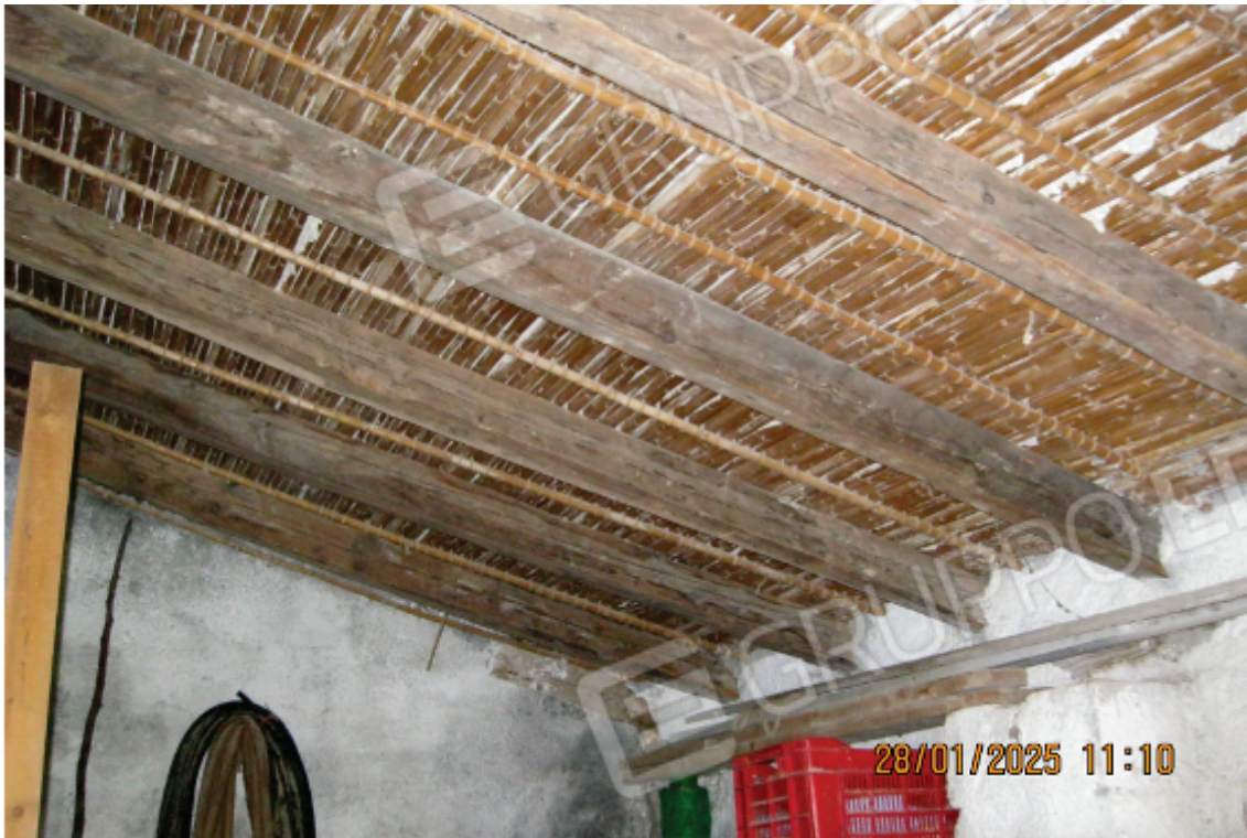
Foto 3: il magazzino della foto precedente visto dall'interno; si noti il tetto in canne e gesso