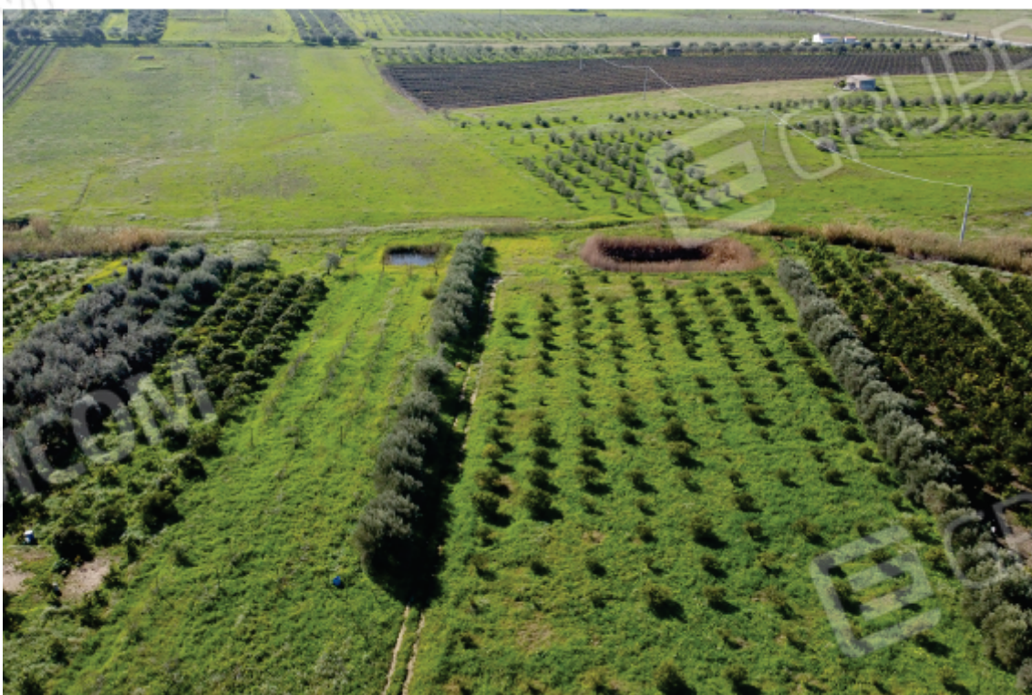
Foto 24: altra rappresentazione del terreno pignorato fotografato dall'alto; sulla destra l'agrumeto, sulla sinistra l'impianto arboreo a spalliera, separati dalla ventiera di olivi; in fondo i due invasi artificiali