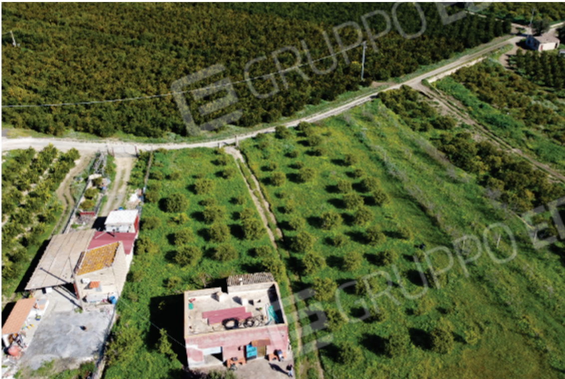
Foto 27: i magazzini visti dall'alto del fabbricato a corpo unico; si noti la stradella poderale che taglia l'agrumeto e che conduce al cancello di ingresso al fondo