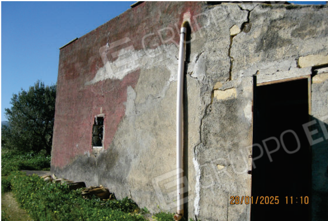
Foto 1: due dei tre magazzini adiacenti tra loro, visti dall'esterno