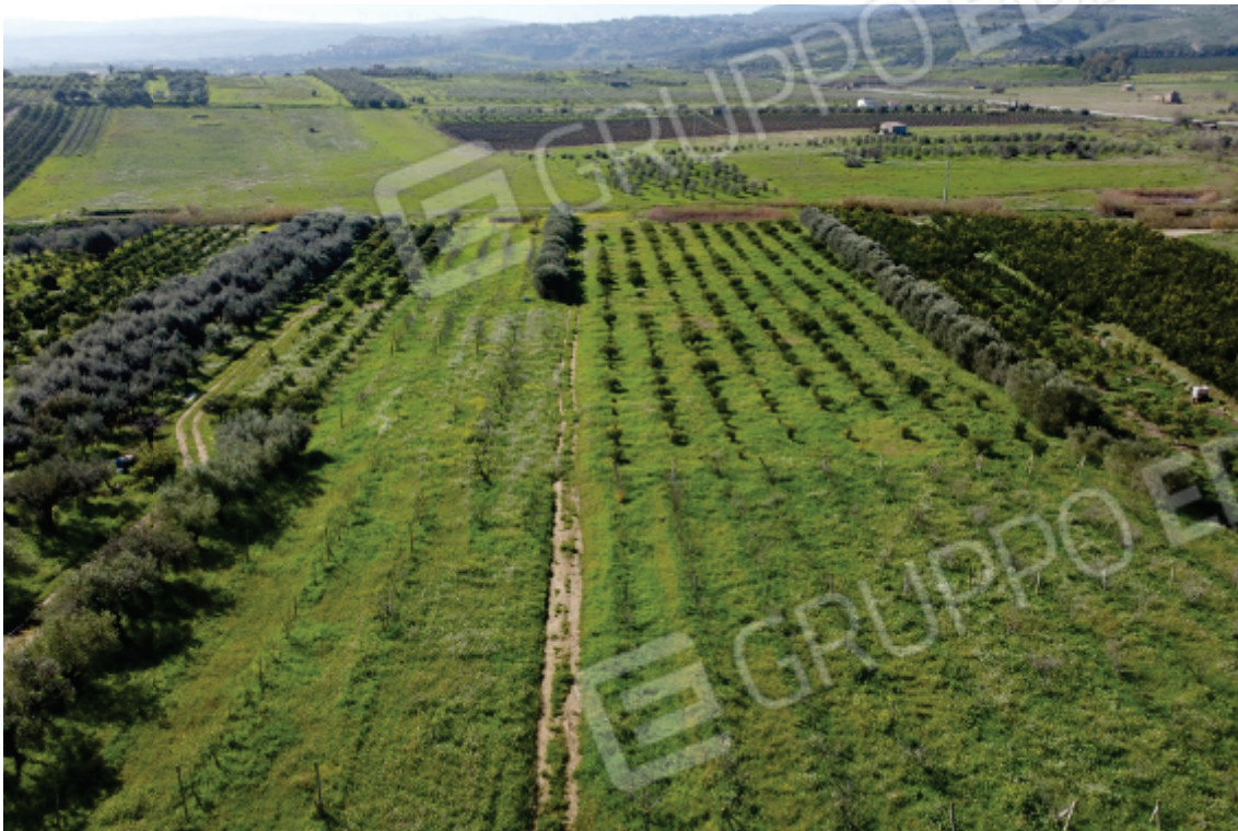
Foto 23: il terreno pignorato visto dall'alto; si notino le colture arboree a spalliera e l'agrumeto