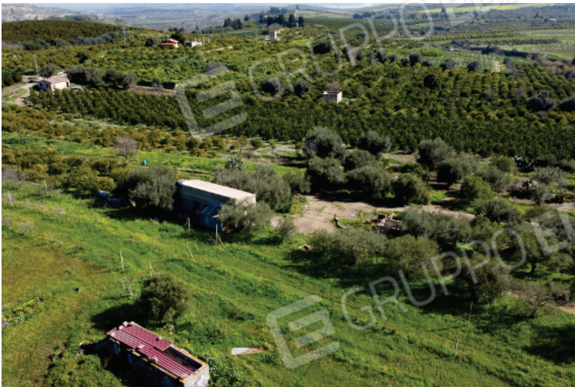
Foto 29: in primo piano il fabbricato adibito a porcilaia con la copertura in pannelli coibentati