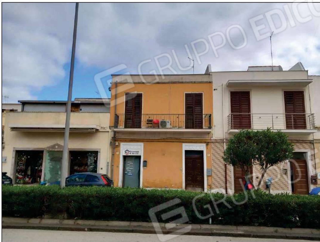
Foto 1: Vista della palazzina su due piani posta nel Viale Luigi Cadorna