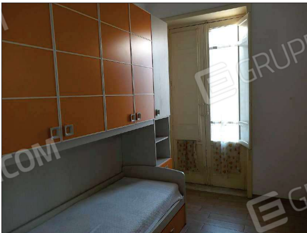
Foto 4: Vista della cameretta con affaccio sulla viabilità pubblica