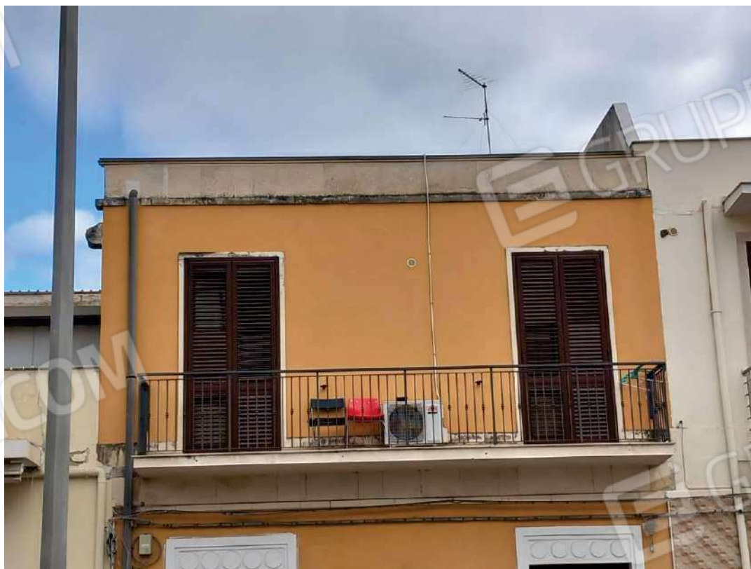
Foto 2: Individuazione del cespite oggetto della procedura posto al piano primo