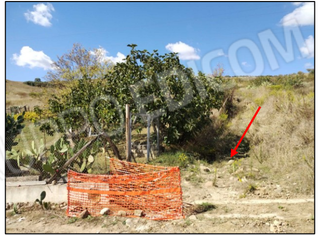
Foto 4 Ingresso da Sp 121 viottolo in sterrato Lotto di terreno Fig. 9 p.lla 1078