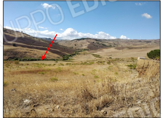
Foto 2 Confine lato torrente Porzione Vincolata (Legge Galasso) Lotto di terreno Fg. 13 p.lla 108