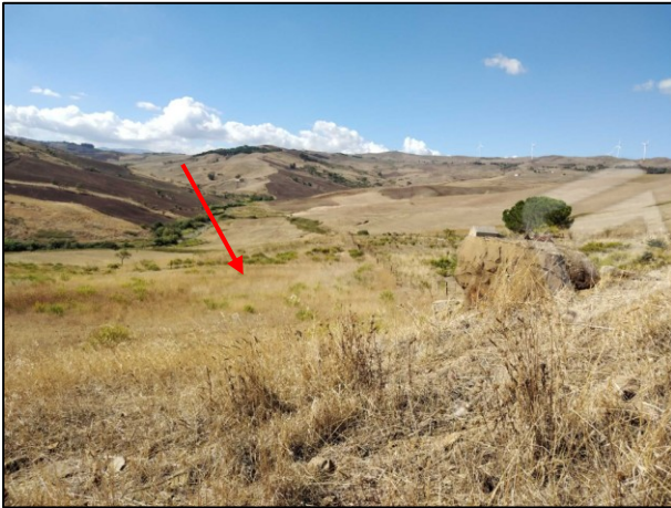
Foto 1 Lotto di terreno raggiungibile da Viottolo peditabile Evidenziato in rosso il fondo Fg. 13 p.lla 108