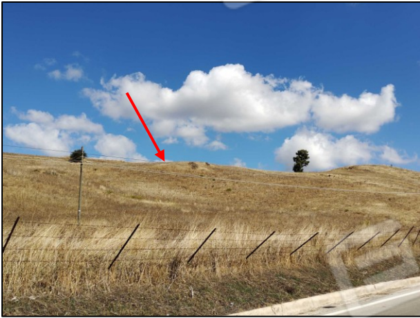
Foto 3 Lotto di terreno raggiungibile da Viottolo pedonabile in sterrato Lotto di terreno Fig. 13 p.lla 199