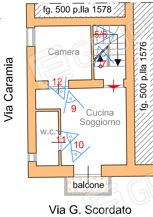
PLANIMETRIA PIANO PRIMO