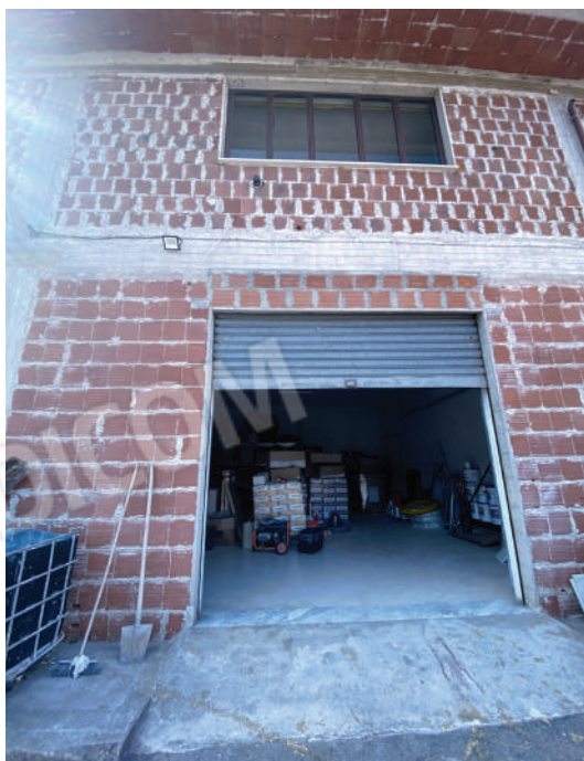
Foto 15. Accesso piano seminterrato.