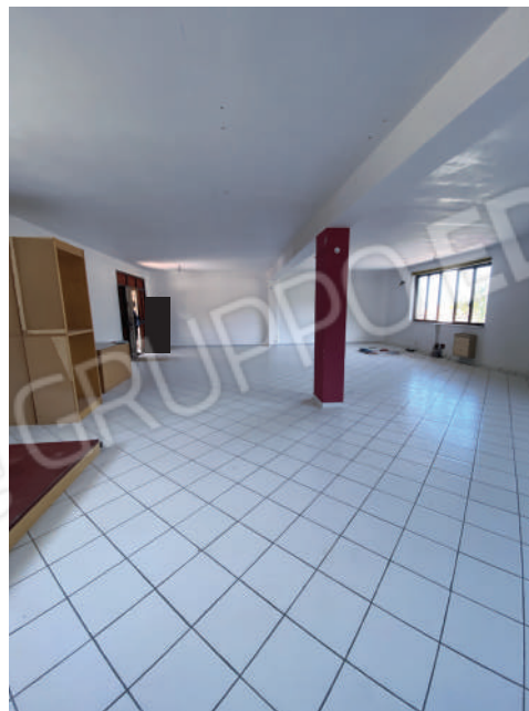
Foto 34. Porzione di piano terra adibita a magazzino/artigianale.