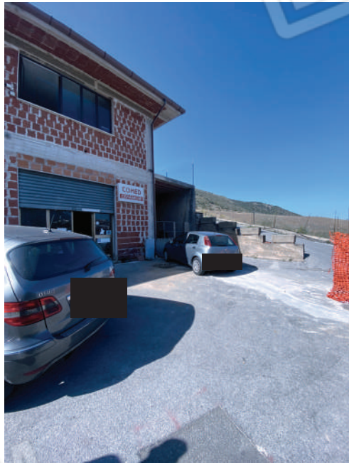
Foto 29. Piano seminterrato, piazzale.

ALLEGATO A: DOCUMENTAZIONE FOTOGRAFICA LOTTO UNICO