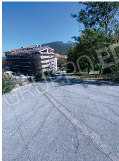
Foto 2. Strada di accesso al lotto.