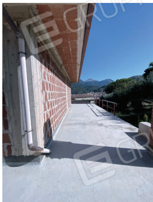
Foto 12. Terrazzo antistante la porzione di piano terra adibita a magazzino.