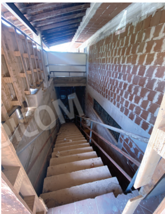
Foto 31. Scala di collegamento, tra piano seminterrato e piano terra, posta nell'intercapedine chiusa.