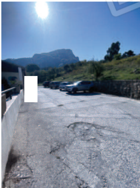
Foto 9. Piazzale piano terra.

ALLEGATO A: DOCUMENTAZIONE FOTOGRAFICA LOTTO UNICO