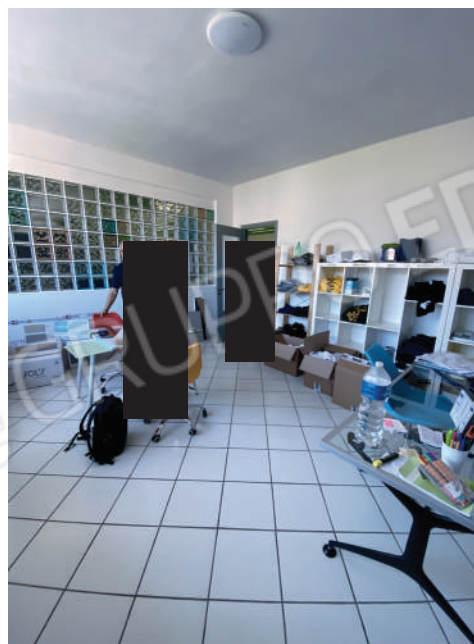
Foto 42. Porzione di piano terra adibita ad ufficio.