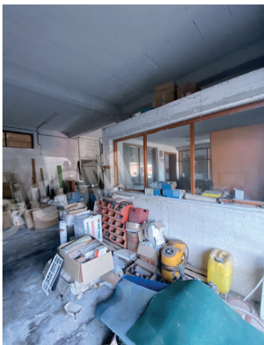
Foto 27. Piano seminterrato, Vano 3.