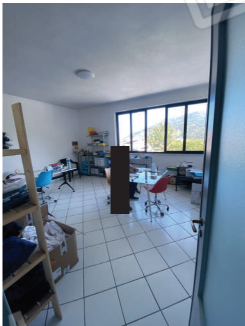
Foto 41. Porzione di piano terra adibita ad ufficio.

ALLEGATO A: DOCUMENTAZIONE FOTOGRAFICA LOTTO UNICO