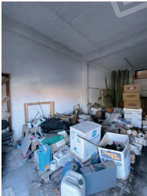
Foto 25. Piano seminterrato, Vano 3.

ALLEGATO A: DOCUMENTAZIONE FOTOGRAFICA LOTTO UNICO