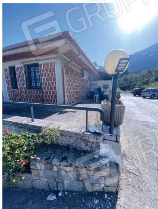
Foto 8. Prospetto laterale e piazzale piano terra.