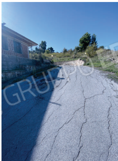
Foto 6. Strada di accesso al lotto.