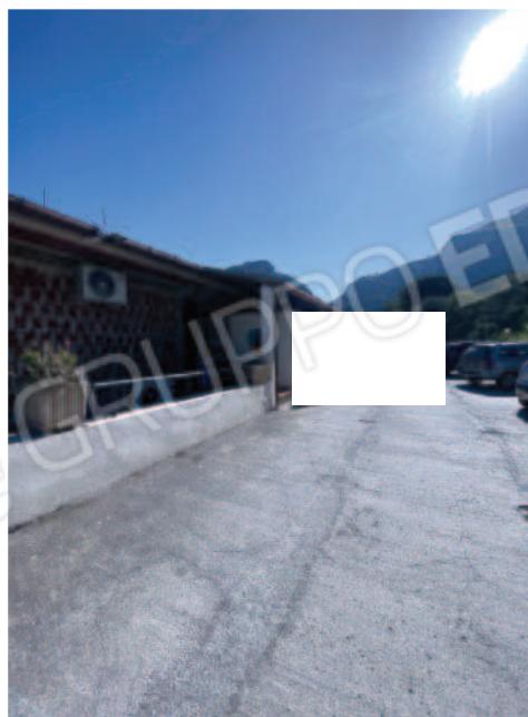
Foto 10. Piazzale piano terra.