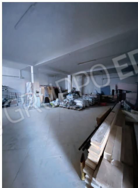
Foto 18. Piano seminterrato, Vano 1.