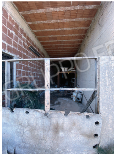
Foto 30. Piano seminterrato, porzione d'intercapedine chiusa.