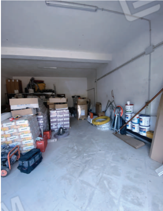
Foto 21. Piano seminterrato, Vano 2.

ALLEGATO A: DOCUMENTAZIONE FOTOGRAFICA LOTTO UNICO