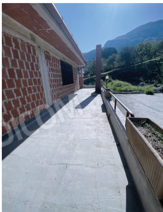
Foto 11. Terrazzo antistante la porzione di piano terra adibita a magazzino.