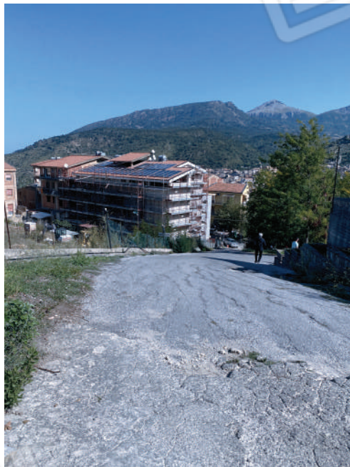
Foto 1. Strada di accesso al lotto.

ALLEGATO A: DOCUMENTAZIONE FOTOGRAFICA LOTTO UNICO