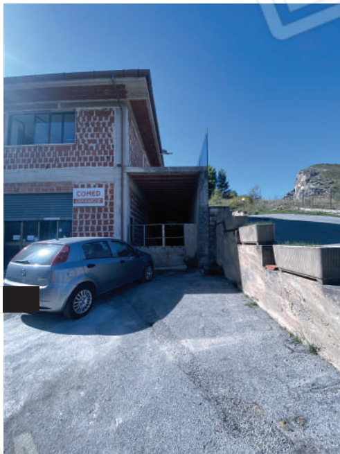
Foto 5. Piazzale piano seminterrato.

ALLEGATO A: DOCUMENTAZIONE FOTOGRAFICA LOTTO UNICO