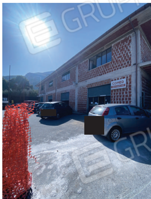
Foto 4. Piazzale piano seminterrato.