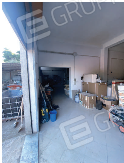
Foto 16. Piano seminterrato, Vano 2.