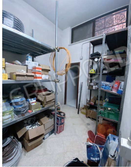
Foto 22. Piano seminterrato, Vano 2, accessori.