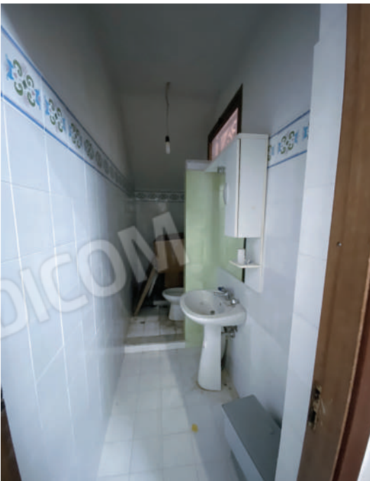
Foto 23. Piano seminterrato, Vano 2, wc.