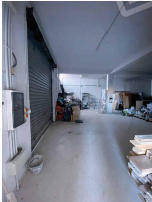
Foto 17. Piano seminterrato, Vano 1.

ALLEGATO A: DOCUMENTAZIONE FOTOGRAFICA LOTTO UNICO