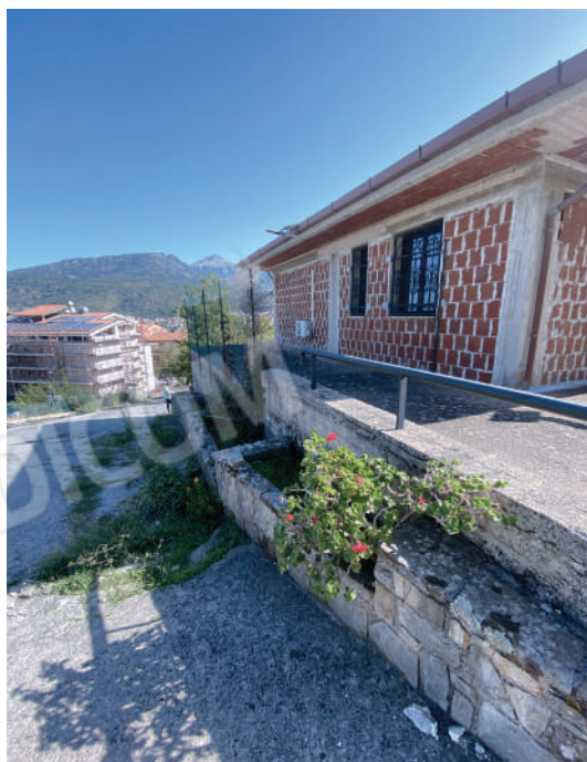
Foto 7. Prospetto laterale.