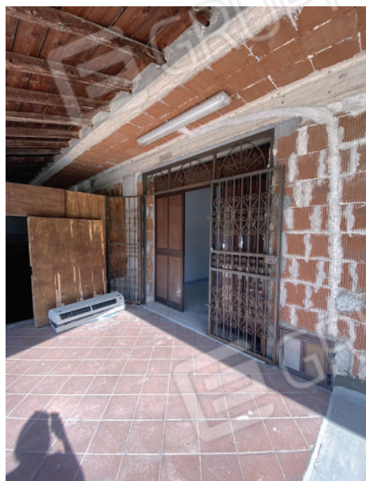
Foto 32. Accesso alla porzione di piano terra adibita a magazzino/artigianale.