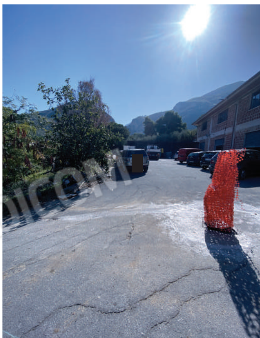
Foto 3. Strada di accesso al lotto e piazzale.