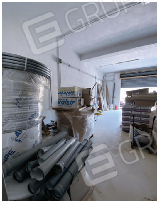
Foto 24. Piano seminterrato, Vano 2.