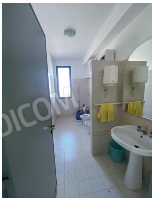
Foto 43. Porzione di piano terra adibita ad ufficio.