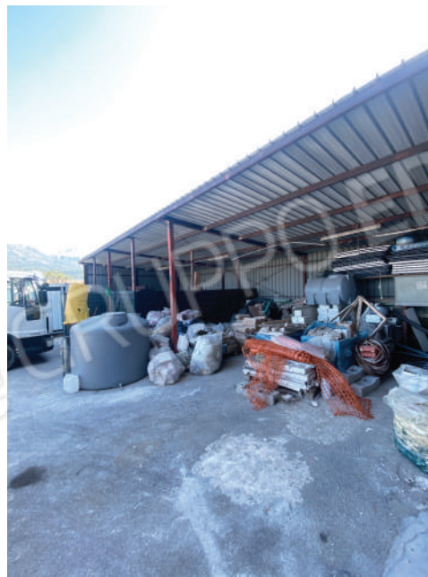
Foto 14. Tettoia.