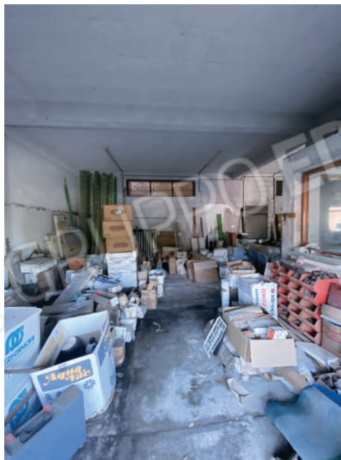
Foto 26. Piano seminterrato, Vano 3.