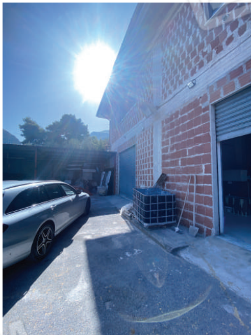
Foto 13. Accesso piano seminterrato.

ALLEGATO A: DOCUMENTAZIONE FOTOGRAFICA LOTTO UNICO