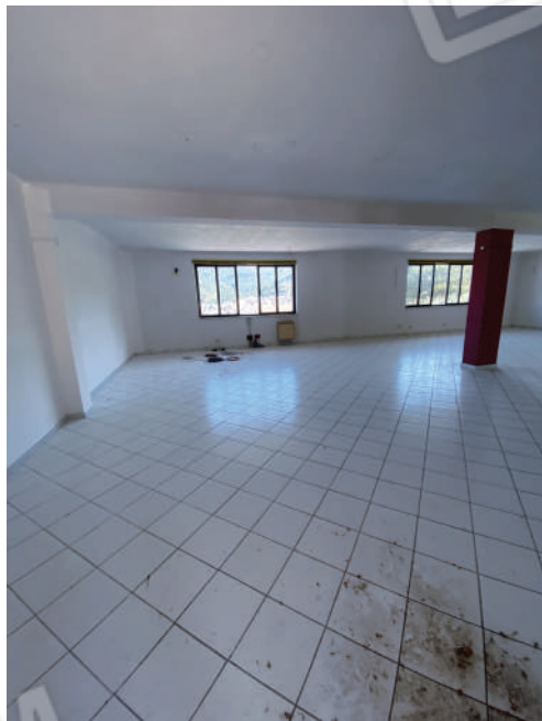
Foto 33. Porzione di piano terra adibita a magazzino/artigianale.

ALLEGATO A: DOCUMENTAZIONE FOTOGRAFICA LOTTO UNICO