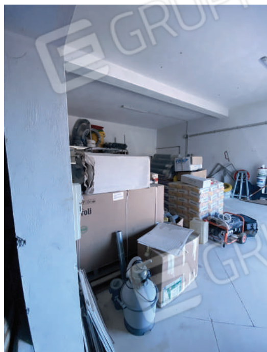
Foto 20. Piano seminterrato, Vano 2.