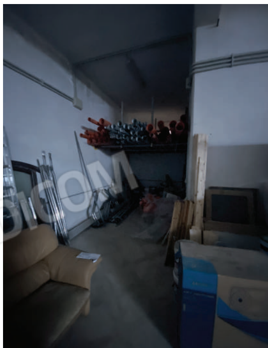
Foto 19. Piano seminterrato, Vano 1.