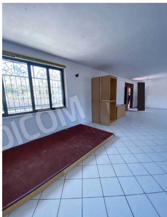
Foto 35. Porzione di piano terra adibita a magazzino/artigianale.