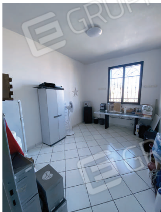
Foto 44. Porzione di piano terra adibita ad ufficio.