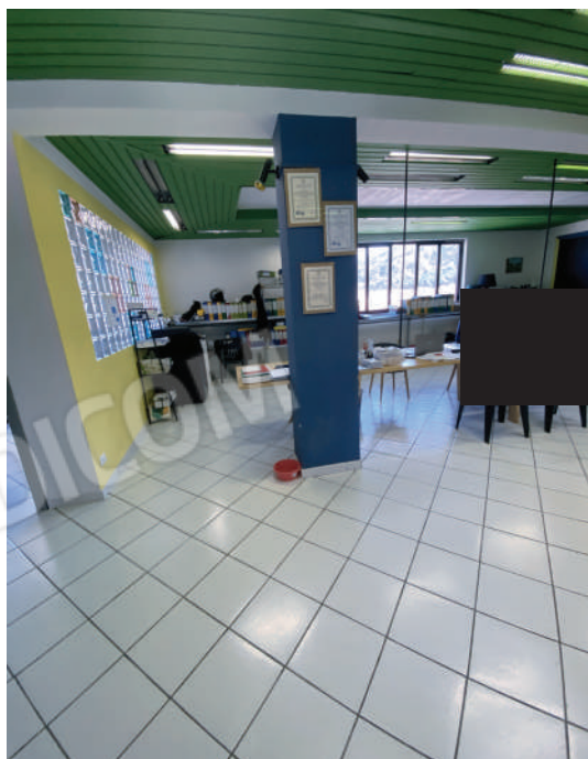
Foto 39. Porzione di piano terra adibita ad ufficio.