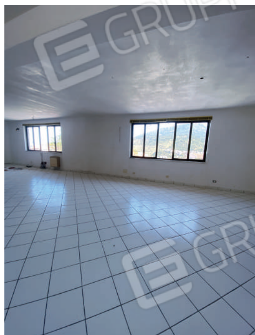
Foto 36. Porzione di piano terra adibita a magazzino/artigianale.