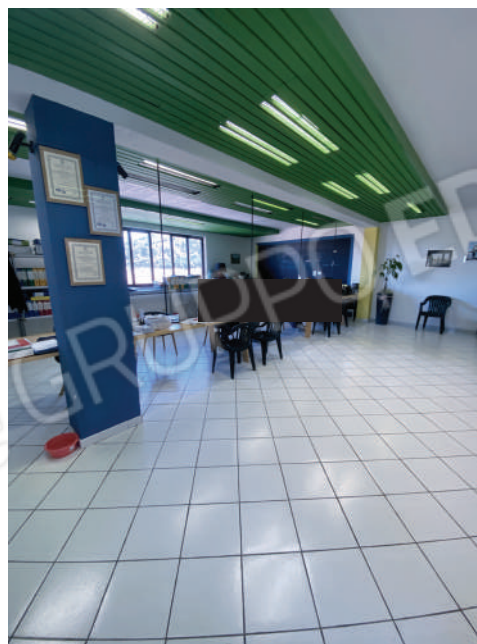
Foto 38. Porzione di piano terra adibita ad ufficio.