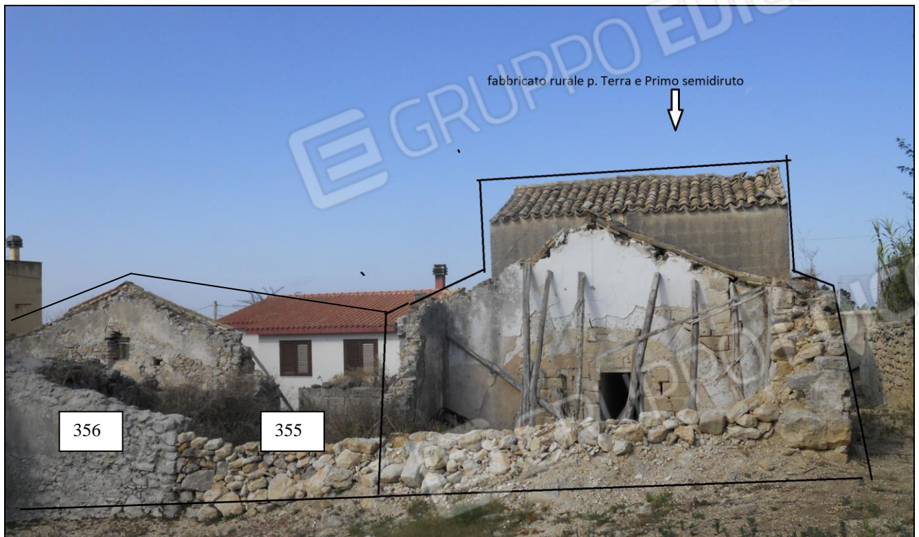
Foto 3 Vista panoramica lato posteriore p.lle 50 sub. 1-2, 355 e 356