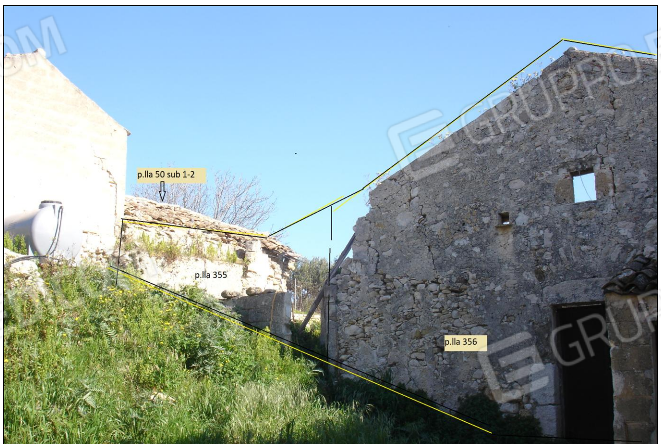
Foto 4 Vista panoramica lato principale p.lle 355 e 356