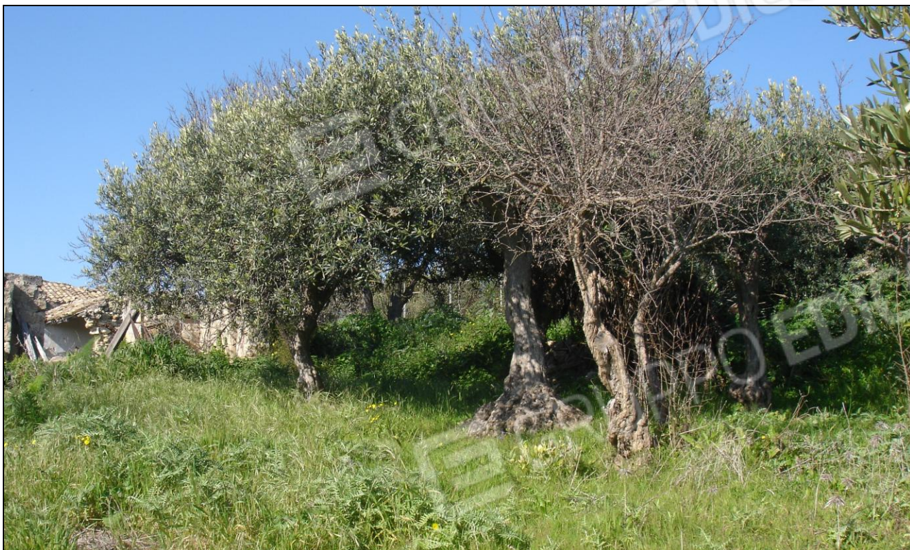
Foto 3 Vista porzione di area libera p.lla 353 e 254