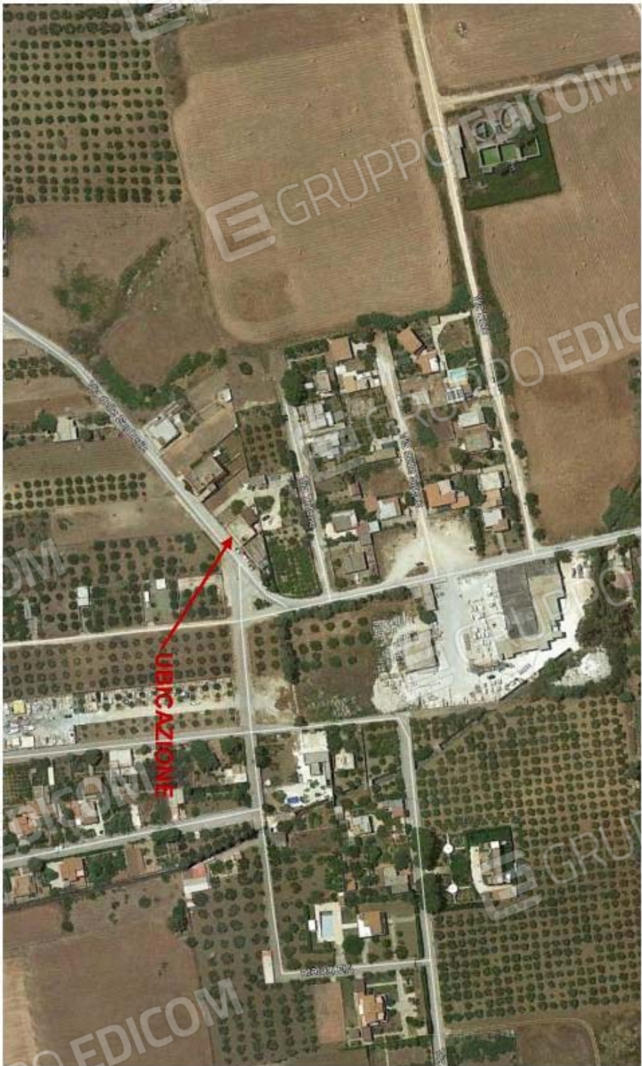
Foto 1: Vista satellitare della zona in cui è ubicato il fabbricato