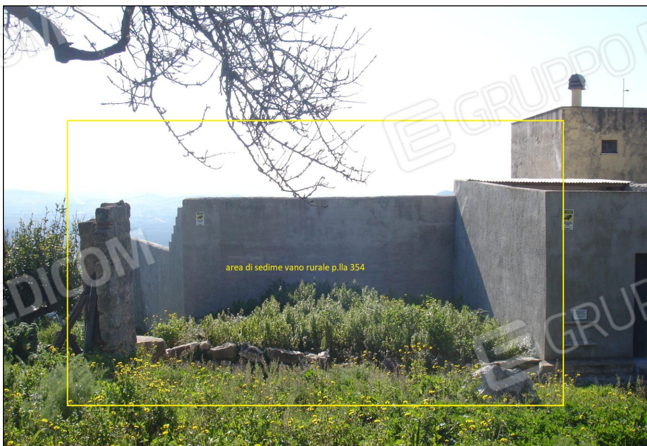
Foto 4 Vista area di sedime vano rurale p.lla 354