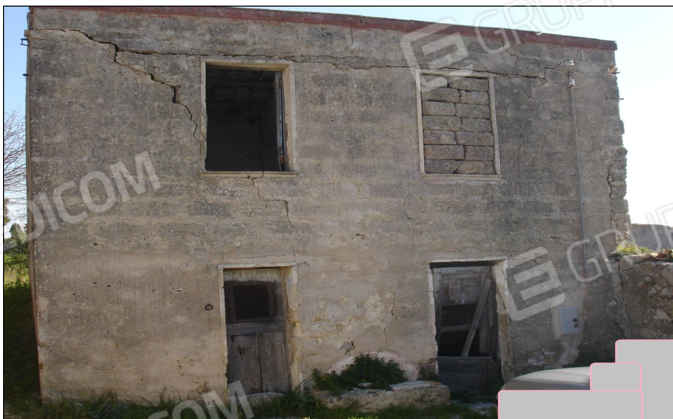
Foto 2: Vista del lato principale fabbricato rurale p.la 50 sub. 1-2