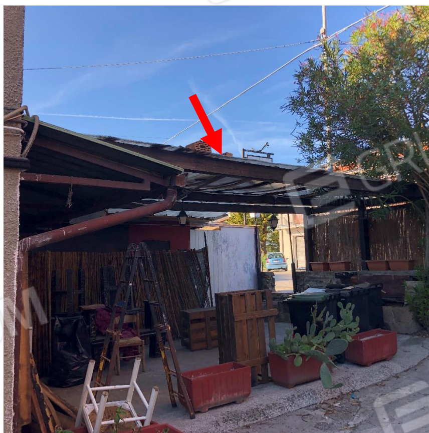
Foto 6 – Tettoia eseguita in assenza di titolo, per la quale si prevede la demolizione (indicata con la freccia rossa)