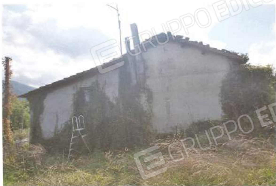
7) prospetto nord; 8) prospetto est;