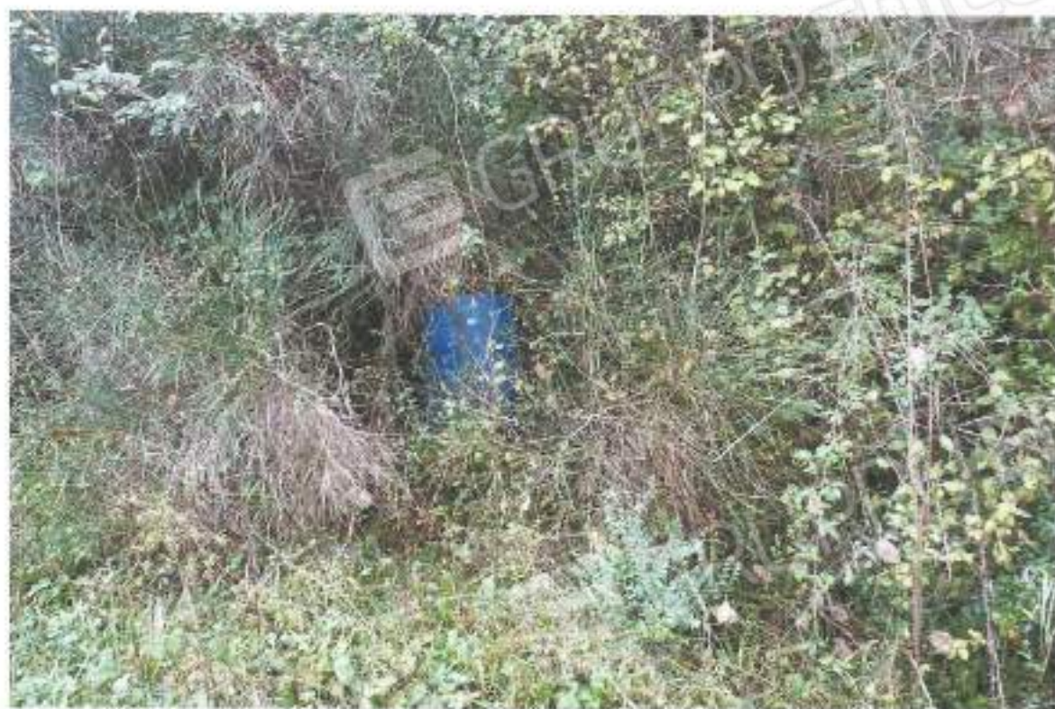
17) pozzo della part. 110; 18) pozzo della part. 164;