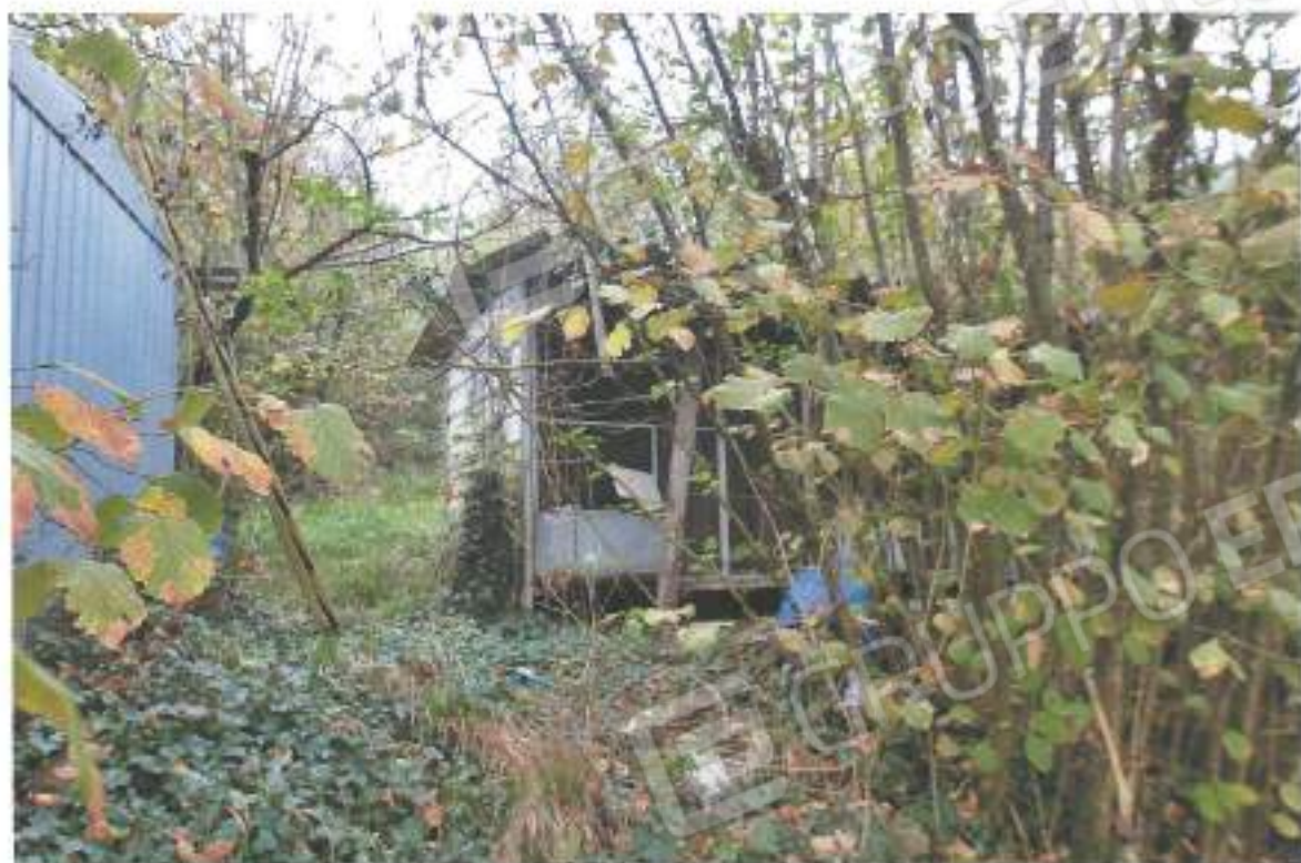
15) annesso agricolo della part. 164 da demolire; 16) annesso agricolo della part. 164 da rimuovere;