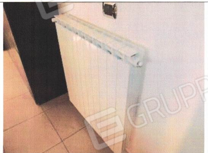
Unità immobiliare foglio n° 35, particella n° 1844, sub. 46