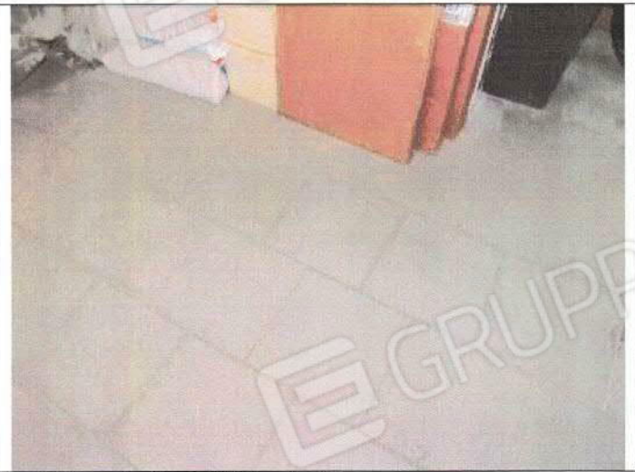
Unità immobiliare accessoria - foglio n° 35, particella n° 1844, sub. 53