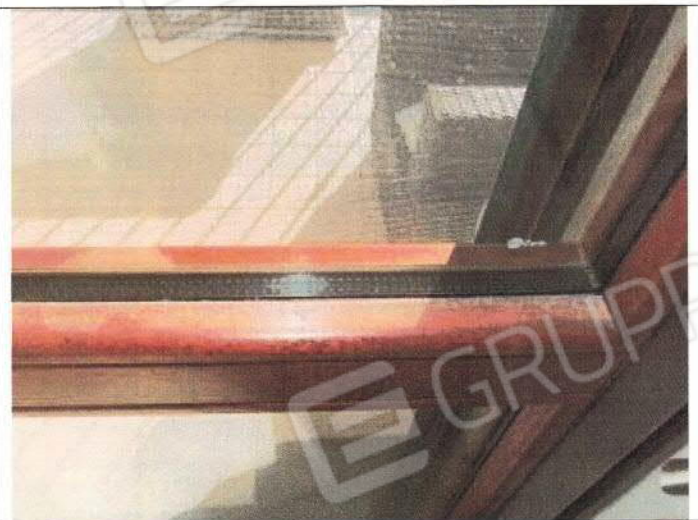
Unità immobiliare foglio n° 35, particella n° 1844, sub. 46