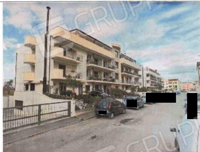
Vista esterna del complesso edilizio di cui le unità oggetto di stima fanno parte