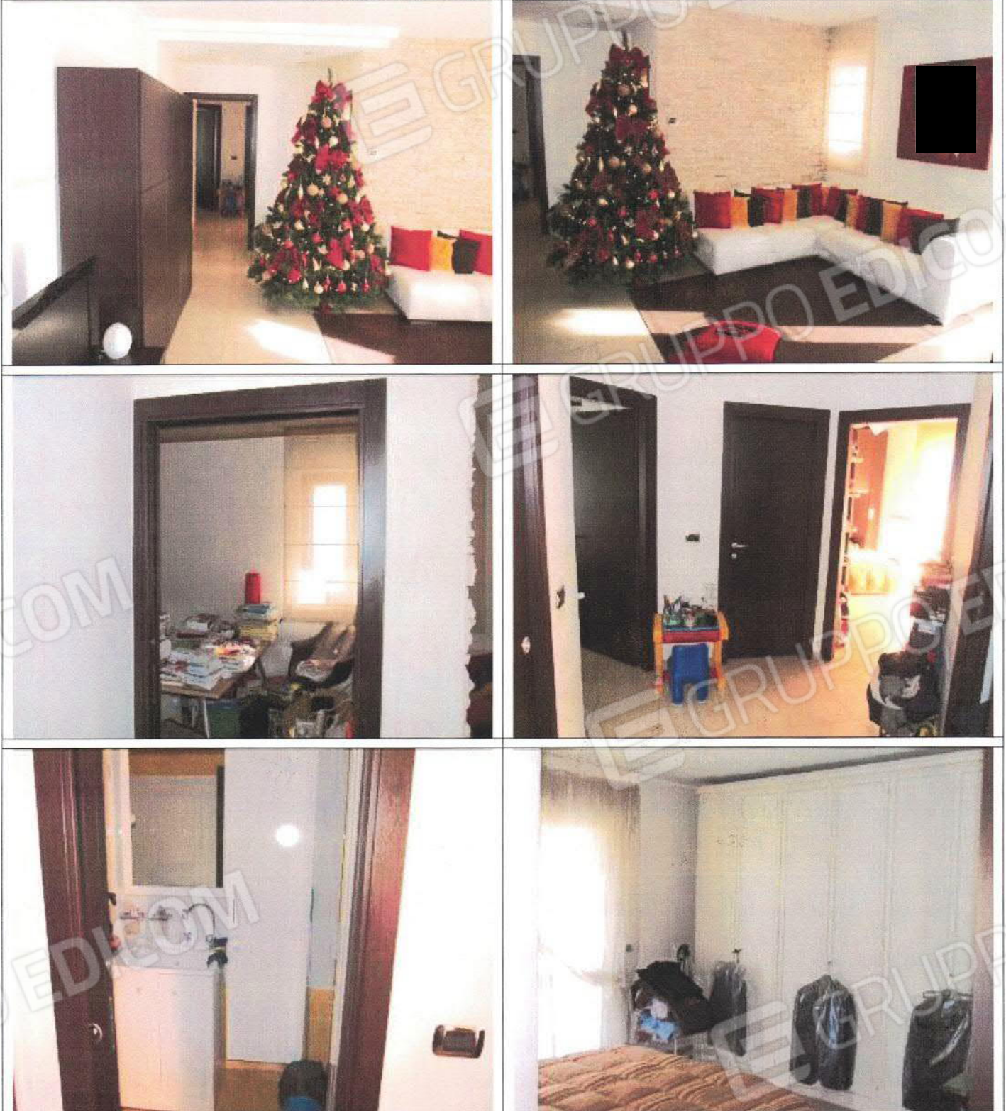
Unità immobiliare foglio n° 35, particella n° 1844, sub. 46