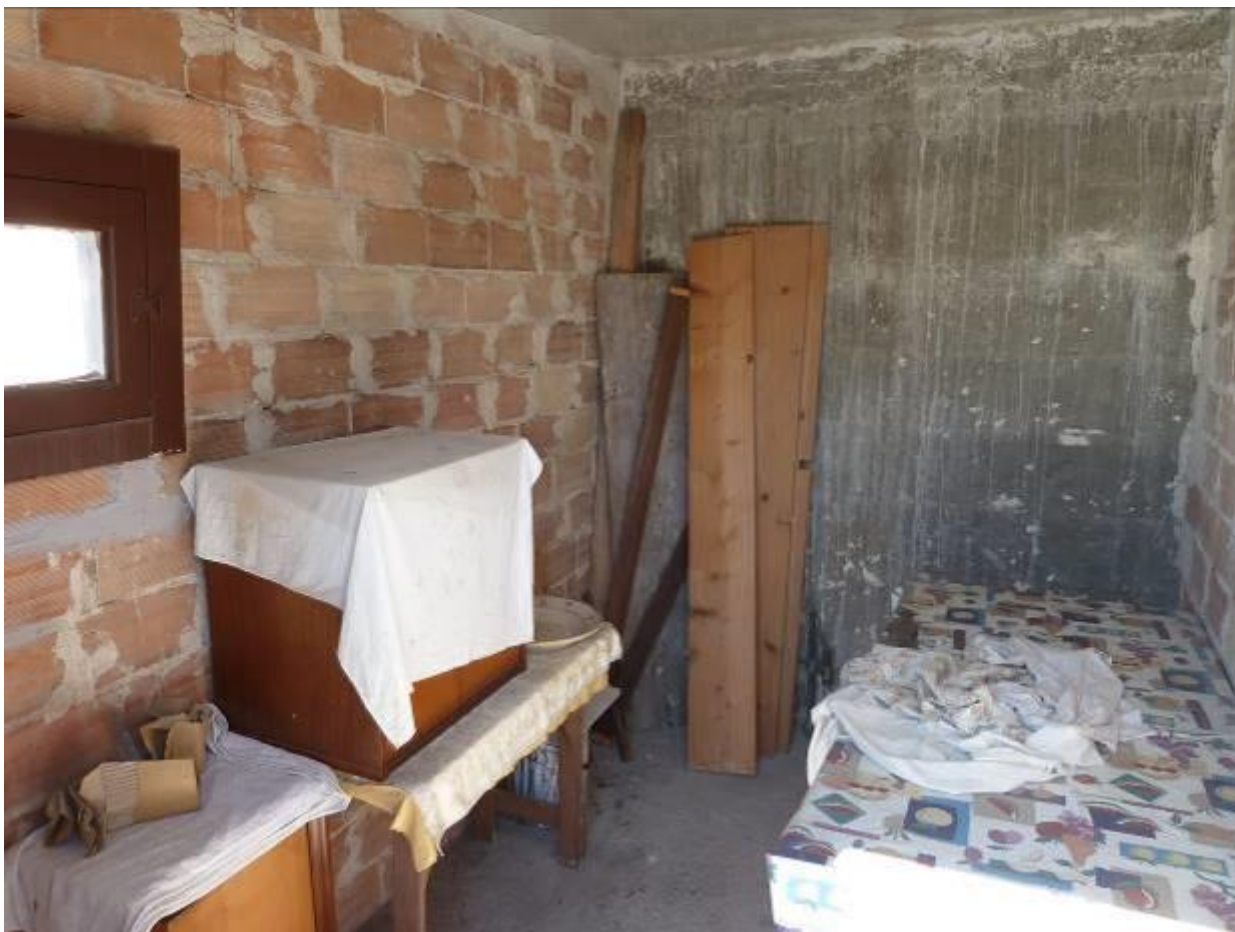
16) Dettaglio di corpo ripostigli e terrazzo di copertura al P.3° dello stabile de quo