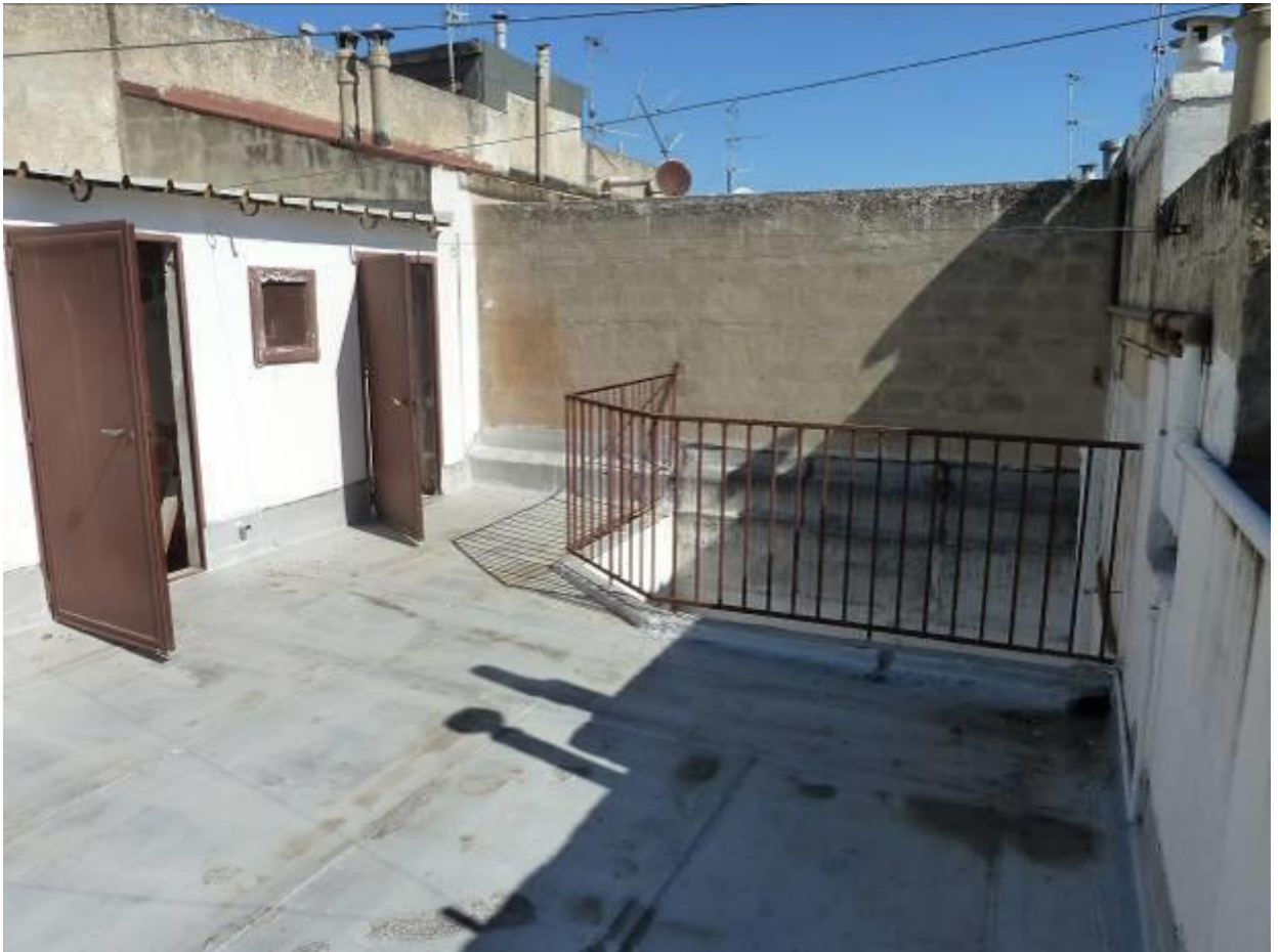
12) Dettaglio del cavedio posto a piano con U.I. censita al Fg.159 mappale 3630/5