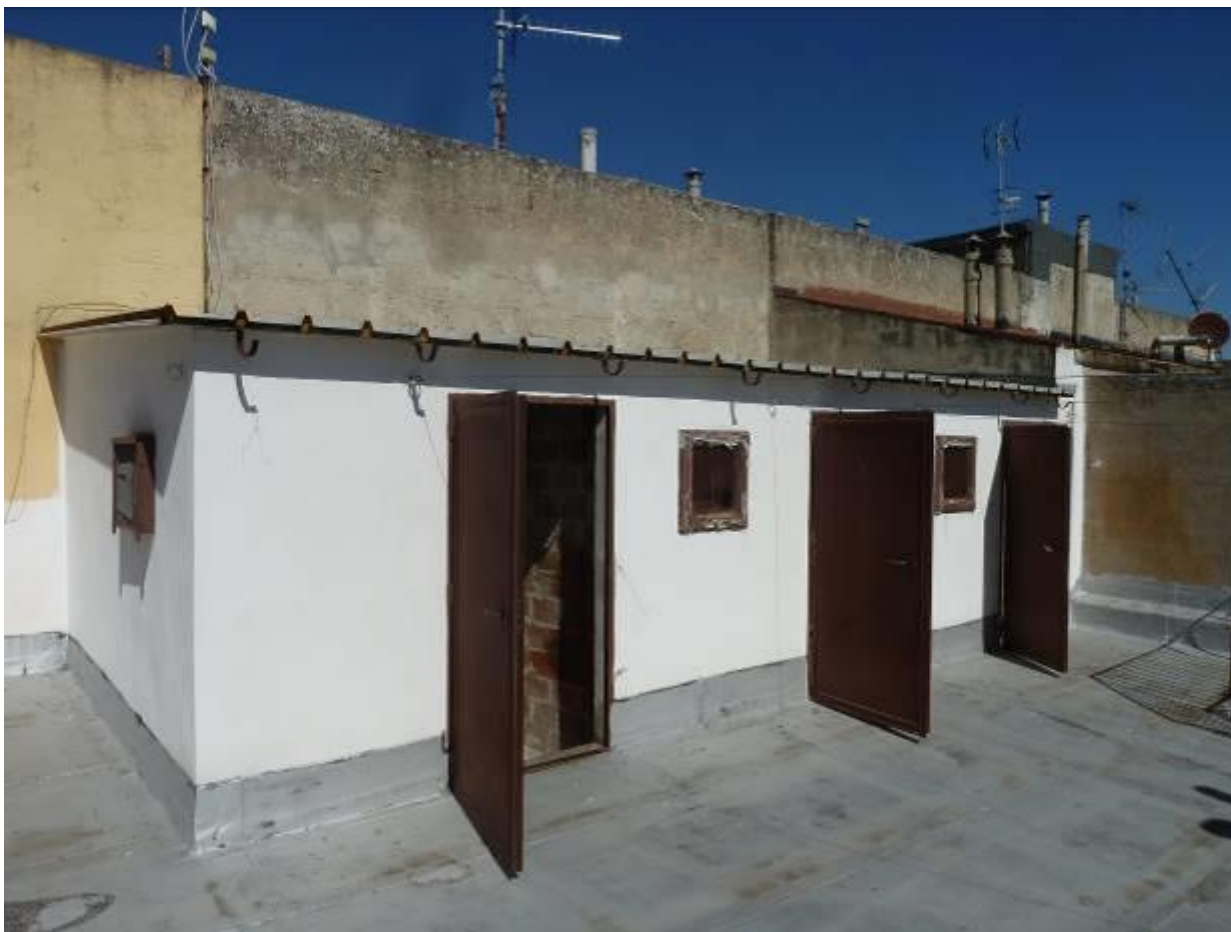
14) Dettaglio all'interno del vano ripostiglio 1 posto a Piano 3° dell'edificio de quo