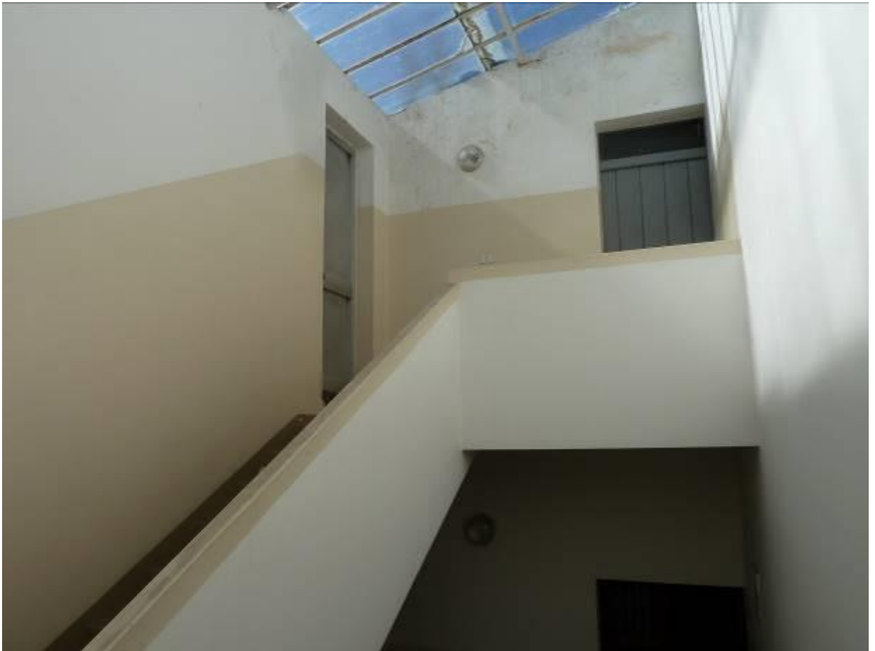
10) Dettaglio del vano lavatoio comune, e di passaggio per il terrazzo di copertura