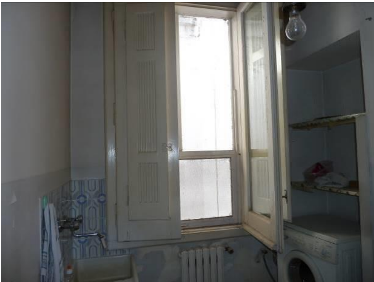
08) Dettaglio della camera dell'U.I. in questione, che affaccia su Via Annunziatella