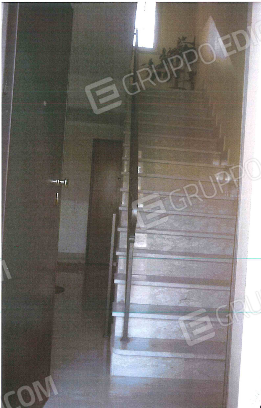
FOTO N.14 INTERNO VANO SCALA COMUNE