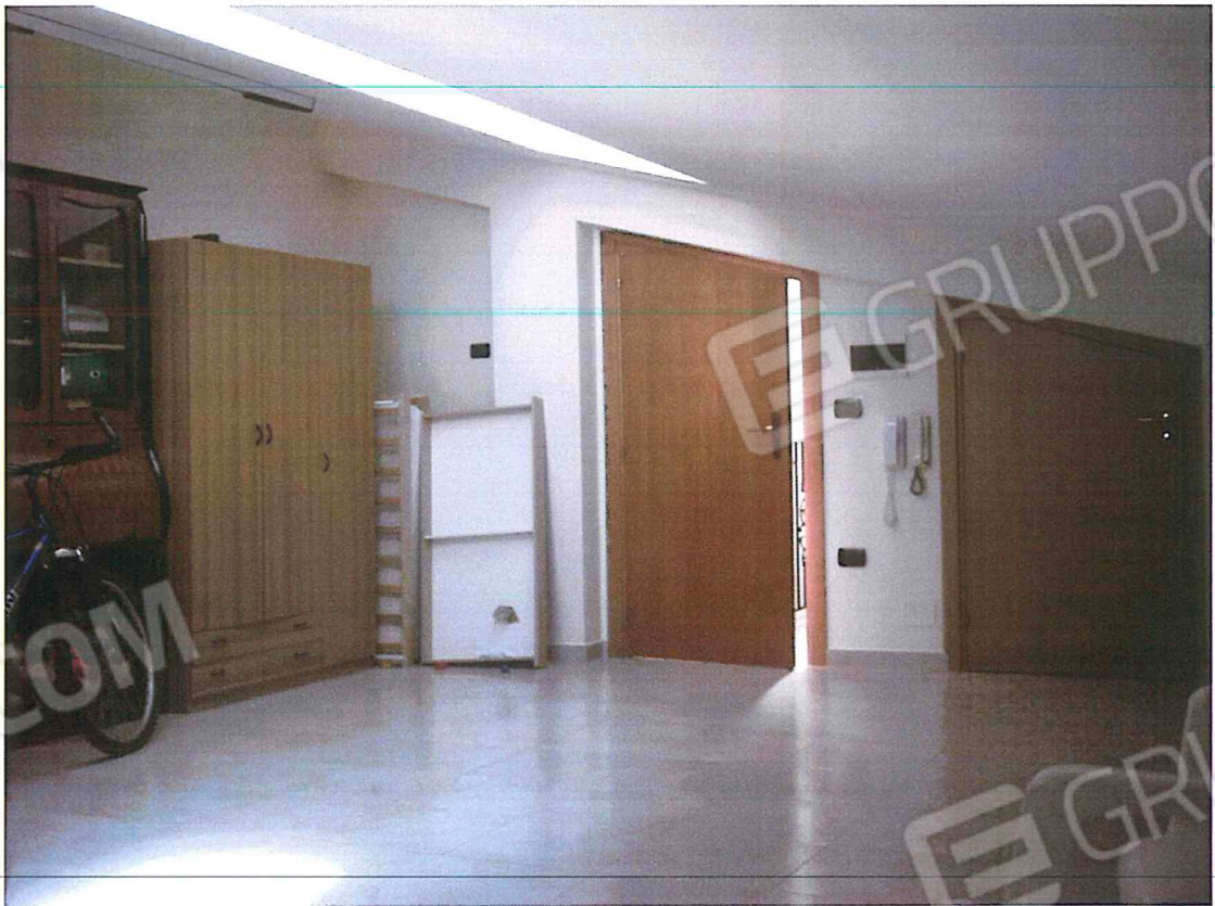
FOTO N.11 INTERNO PIANO SOTTOTETTO RIPRESA INGRESSO