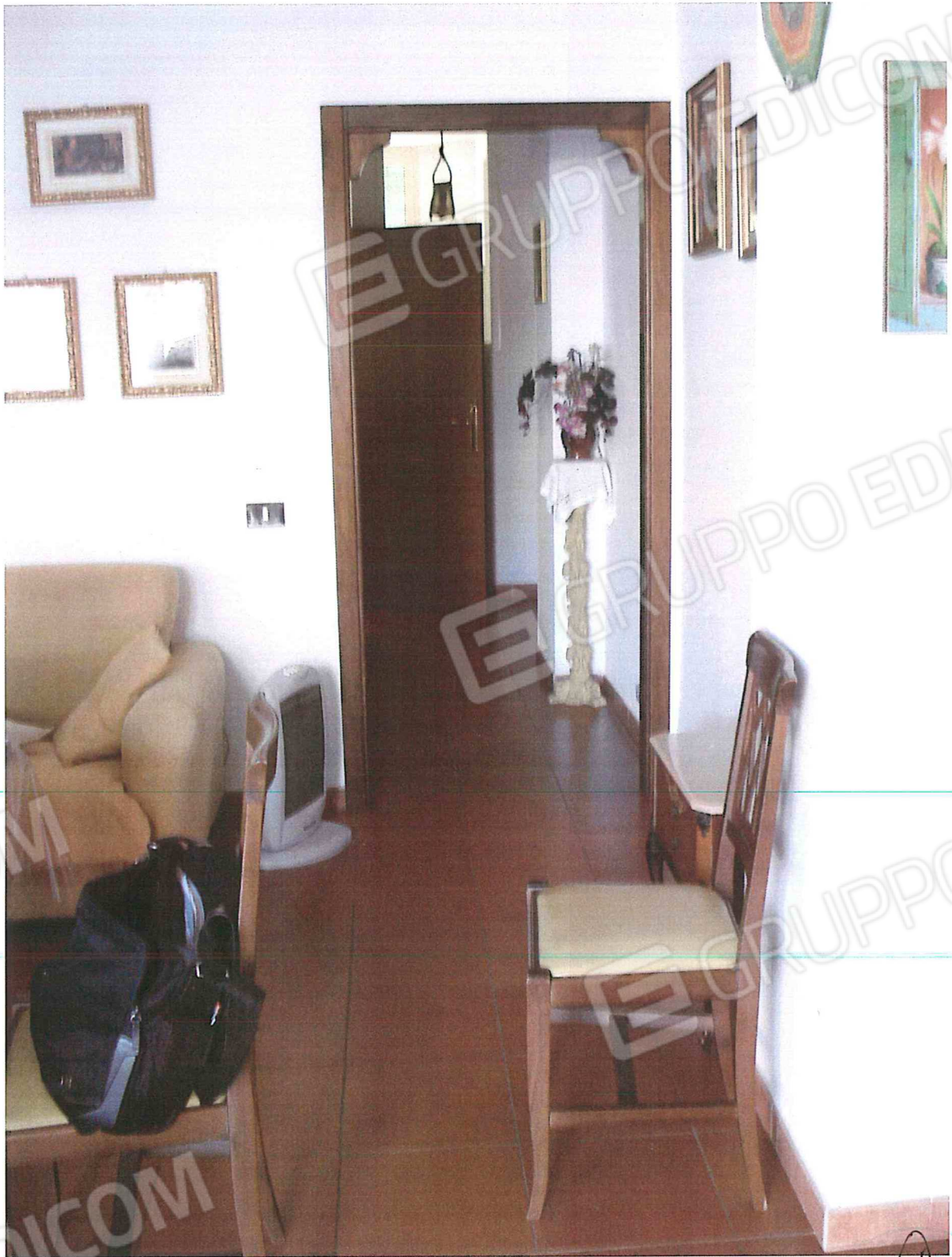
FOTO N.6 INTERNO PIANO SEMINTERRATO RIPRESA SOGGIORNO/PRANZO - DISIMPEGNO

A handwritten signature in black ink, consisting of a stylized, cursive 'S' followed by a checkmark.