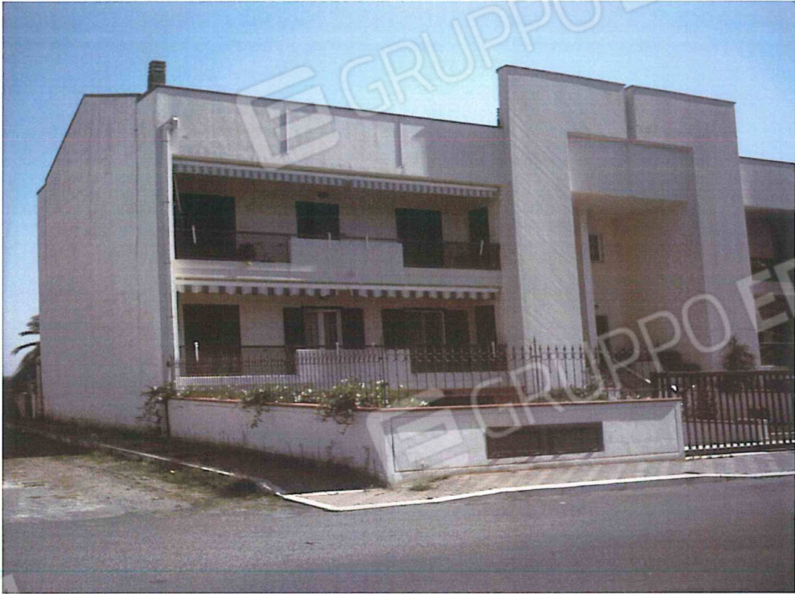
FOTO N.1 ESTERNO INGRESSO VIA ANZIO - RIPRESA DA NORD A SUD