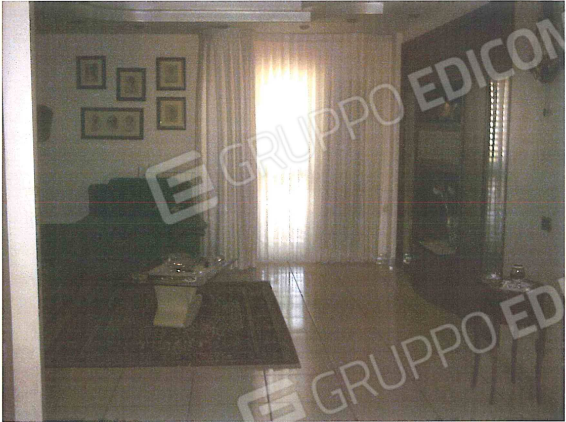
FOTO N.10 INTERNO ABITAZIONE PIANO PRIMO RIPRESA SOGGIORNO