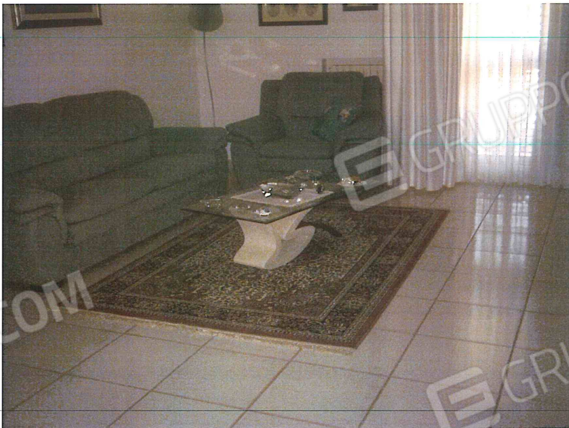
FOTO N.8 INTERNO ABITAZIONE PIANO PRIMO RIPRESA SOGGIORNO