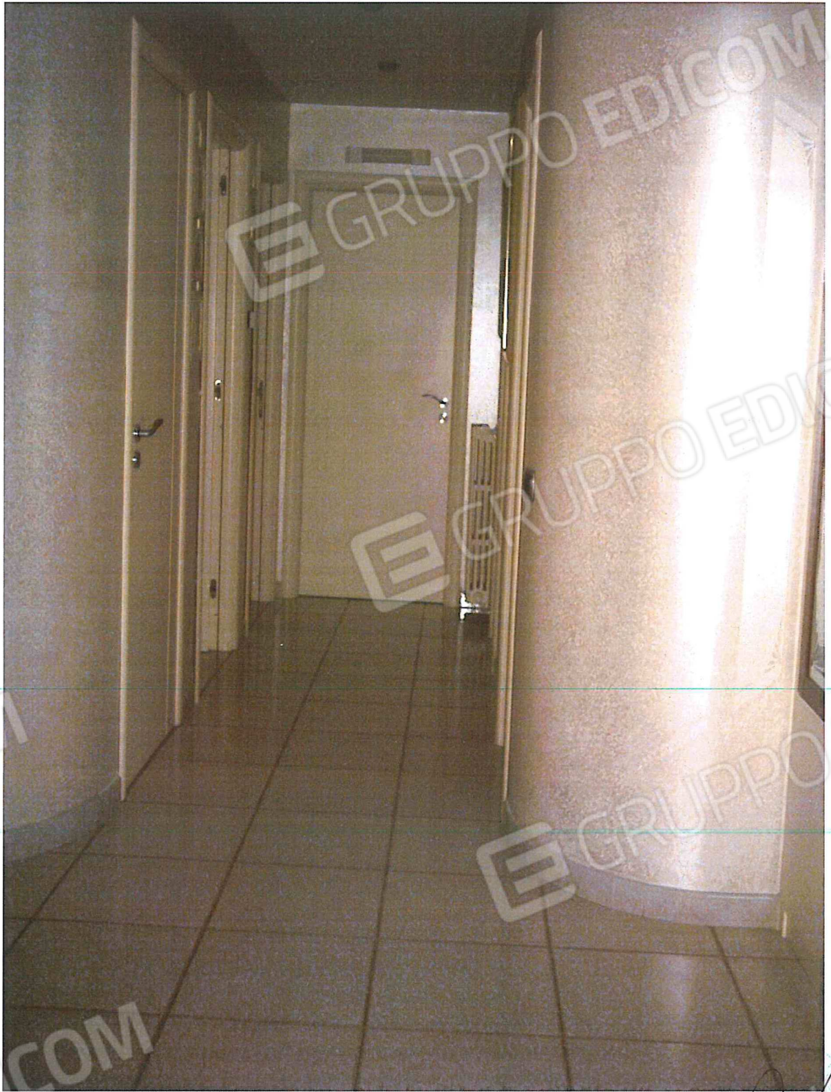
FOTO N.9 INTERNO ABITAZIONE PIANO PRIMO RIPRESA DISIMPEGNO