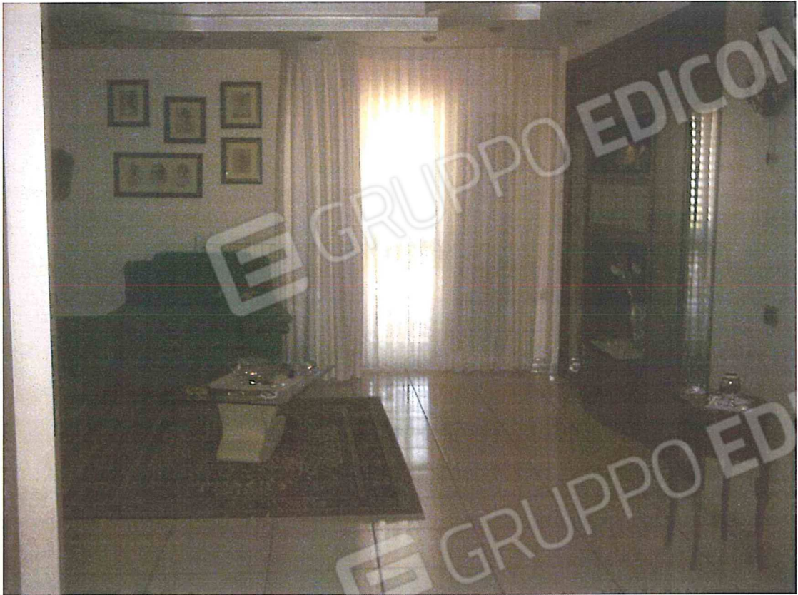
FOTO N.10 INTERNO ABITAZIONE PIANO PRIMO RIPRESA SOGGIORNO