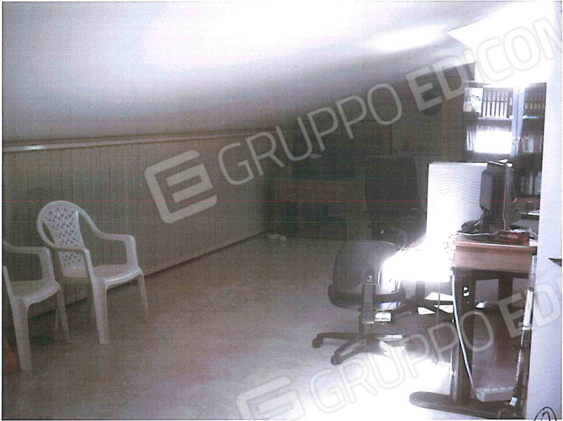
FOTO N.12 INTERNO PIANO SOTTOTETTO