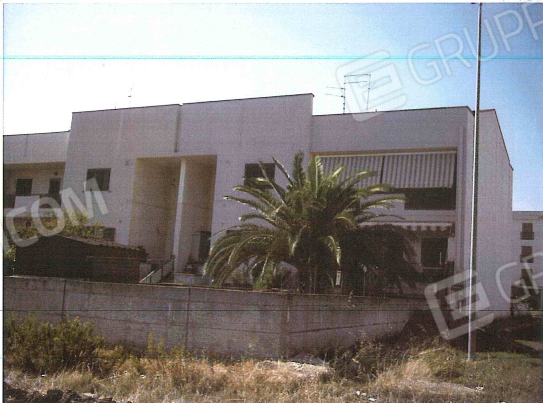
FOTO N.2 ESTERNO GIARDINO POSTERIORE INGRESSO VIA ANZIO - RIPRESA DA EST A OVEST