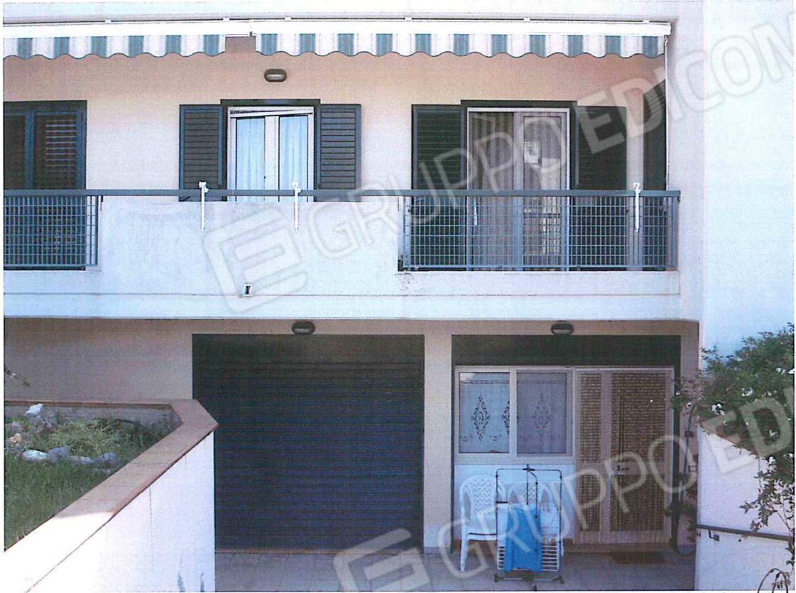
FOTO N.4 ESTERNO RIPRESA INGRESSO PIANO SEMINTERRATO VIA ANZIO