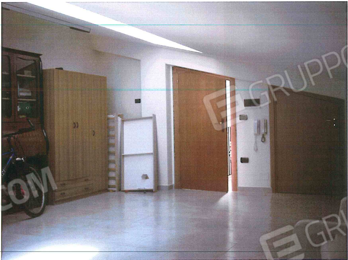
FOTO N.11 INTERNO PIANO SOTTOTETTO RIPRESA INGRESSO