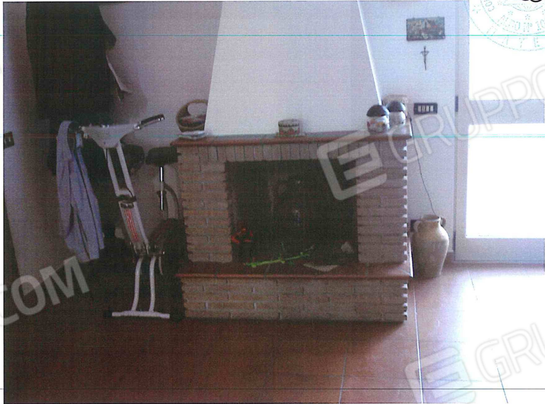
FOTO N.5 INTERNO PIANO SEMINTERRATO RIPRESA SOGGIORNO/PRANZO