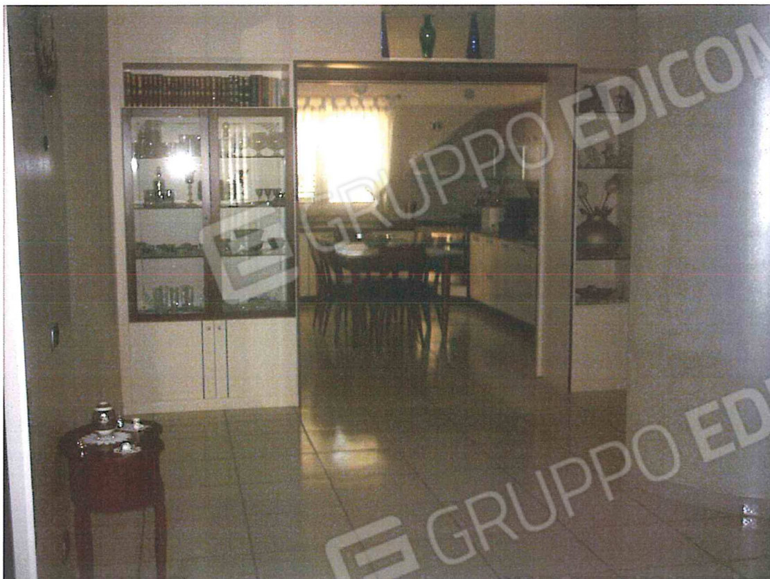
FOTO N.7 INTERNO ABITAZIONE PIANO PRIMO RIPRESA SOGGIORNO - CUCINA