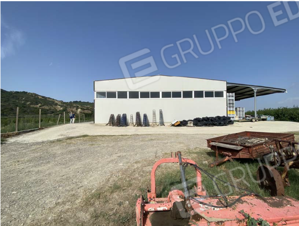
FOTO 11 - Tettoia annessa a volume capannone NON LEGITTIMO lato NORD