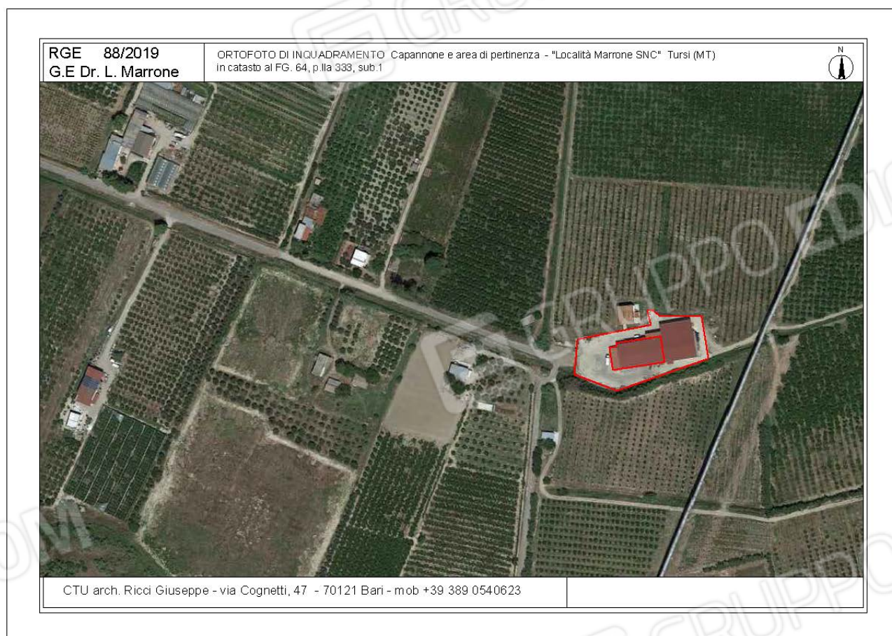
Fg. 64 – p.lla 333

LOTTO 002: capannone agricolo e pertinenza sito in contrada Marone snc – Tursi (MT)