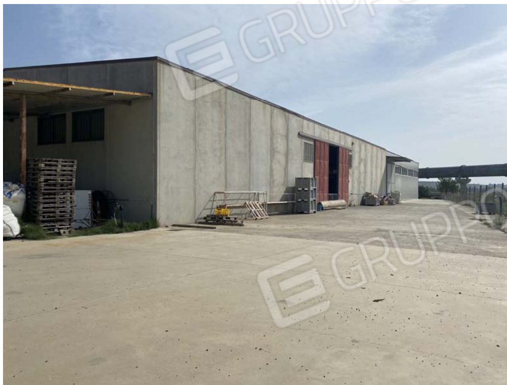
FOTO 9 - vista tettoia esterna capannone lato ovest