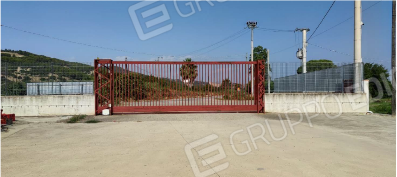
FOTO 2 vista dall'ingresso del compendio immobiliare