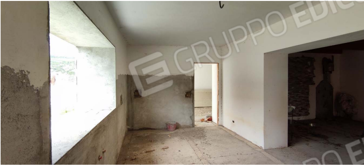
FOTO 11 viste deposito annesso al fabbricato – fg. 64 p.lla 372 sub.1