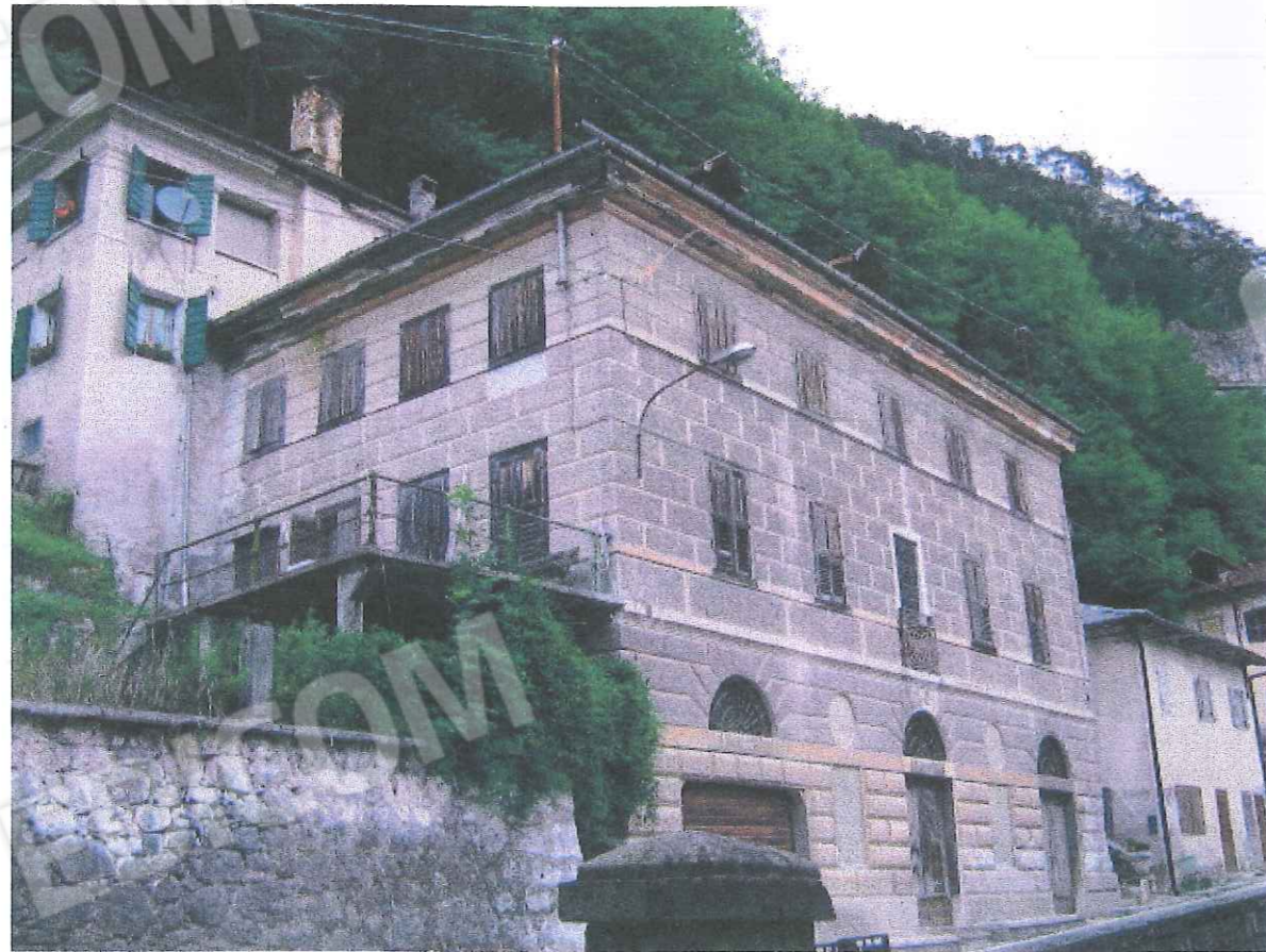
CONO VISIVO: DA SUD-OVEST