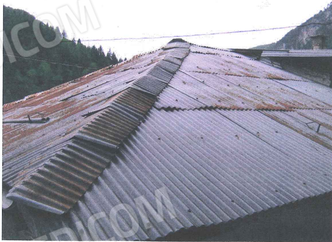
PARTICOLARE DEL MANTO DI COPERTURA DETERIORATO