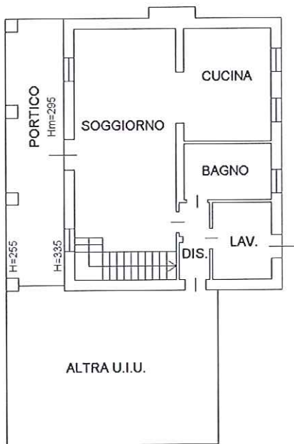
PIANO TERRA H=270